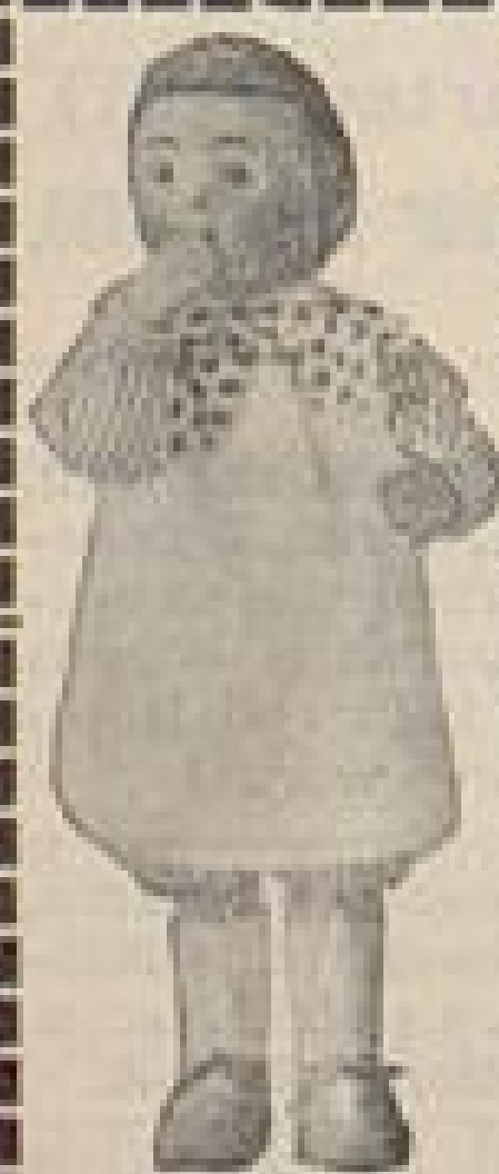
Paul 35 cm M 6.—

Für Angabe von Inter- essenten-Adressen ist der Verlag der »Neuen Frauen- kleidung« jederzeit dankbar.