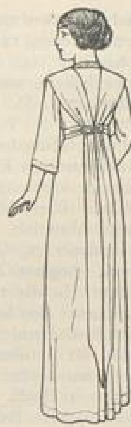
Rückansicht zu Abb. VII.

Abb. I. Einfaches Nachmittagskleid aus mittelblauem Seidenkrepp aus dem Atelier von Geschwister Bollmann, Leipzig, Thomasring 5. Blaue, buntbedruckte Seide (futuristische) ist für die Garnitur genommen. In ganzer Länge ist die vordere Mitte des Kleides mit Knopf- und Spangenschmuck ausgestattet, die Spangen sind von bunter Seide, die Knöpfe vom Stoff des Kleides über Holzformen gearbeitet. Den Ansatz des dreibahnigen Rockes an die Kimonotaille deckt ein buntseidener Gürtel, der am vorderen Schluß und in der hinteren Mitte mit Schleifen endet. Die Hinterbahn fällt zur Tollfalte aus, sie hat etwa 40 cm vom unteren Rand entfernt einen breiten