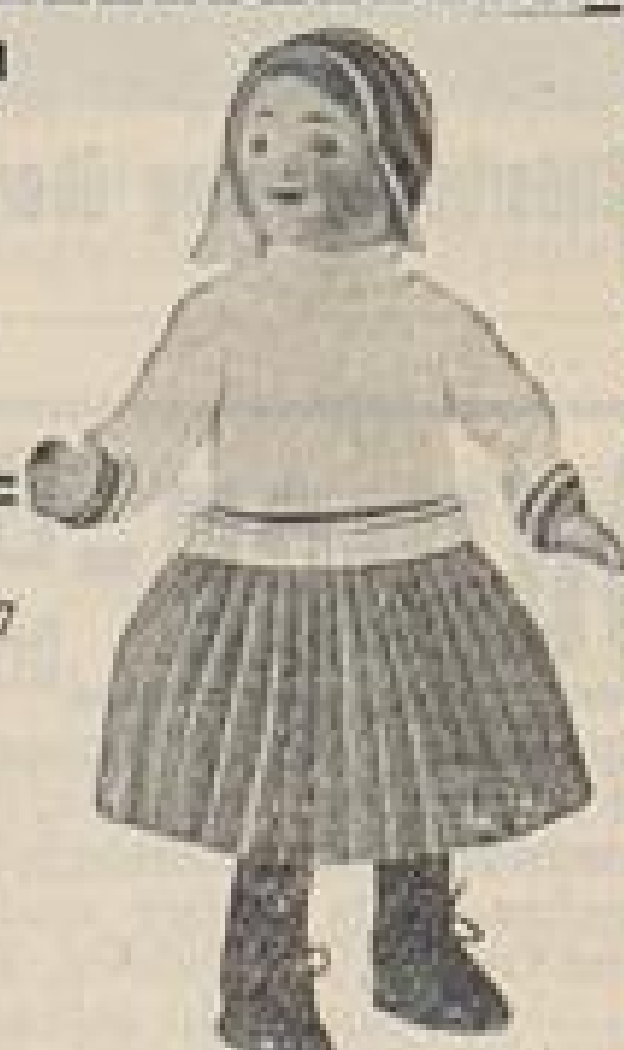
Olga 35 cm M 6.25