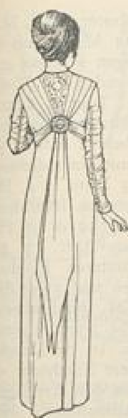
Rückansicht zu Abb. VI.

Abb. I. Einfaches Nachmittagskleid aus mittelblauem Seidenkrepp aus dem Atelier von Geschwister Bollmann, Leipzig, Thomasring 5. Blaue, buntbedruckte Seide (futuristische) ist für die Garnitur genommen. In ganzer Länge ist die vordere Mitte des Kleides mit Knopf- und Spangenschmuck ausgestattet, die Spangen sind von bunter Seide, die Knöpfe vom Stoff des Kleides über Holzformen gearbeitet. Den Ansatz des dreibahnigen Rockes an die Kimonotaille deckt ein buntseidener Gürtel, der am vorderen Schluß und in der hinteren Mitte mit Schleifen endet. Die Hinterbahn fällt zur Tollfalte aus, sie hat etwa 40 cm vom unteren Rand entfernt einen breiten