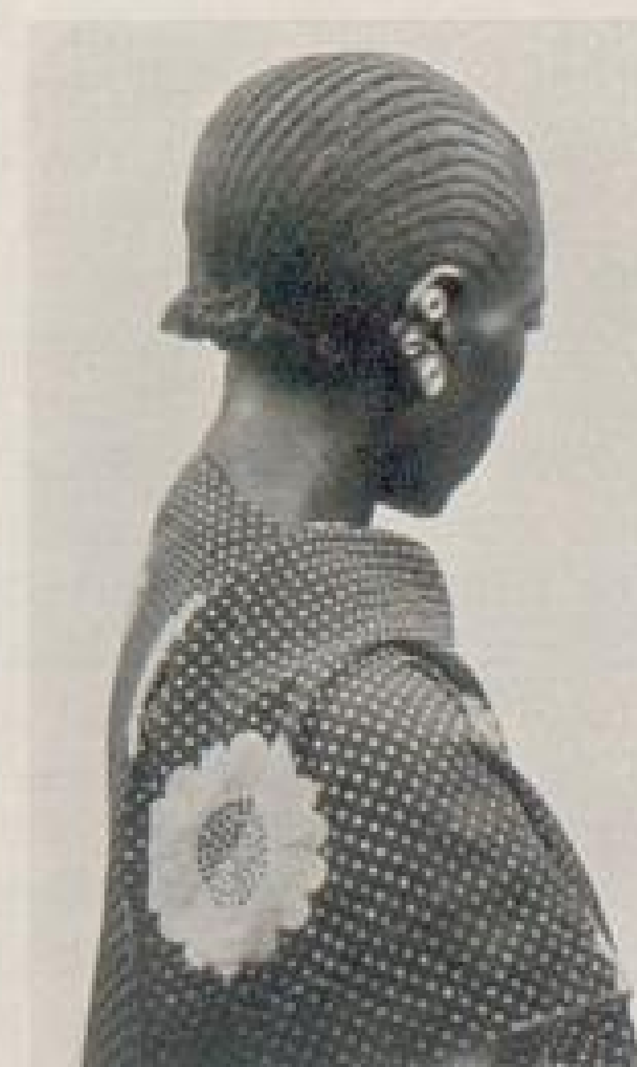
Abb. XIV. Fertige Haartracht u. Ohrknöpfe. Zu den Ausführungen: Etwas von der Haartracht der Negerfrauen in Ostafrika. S. 84.