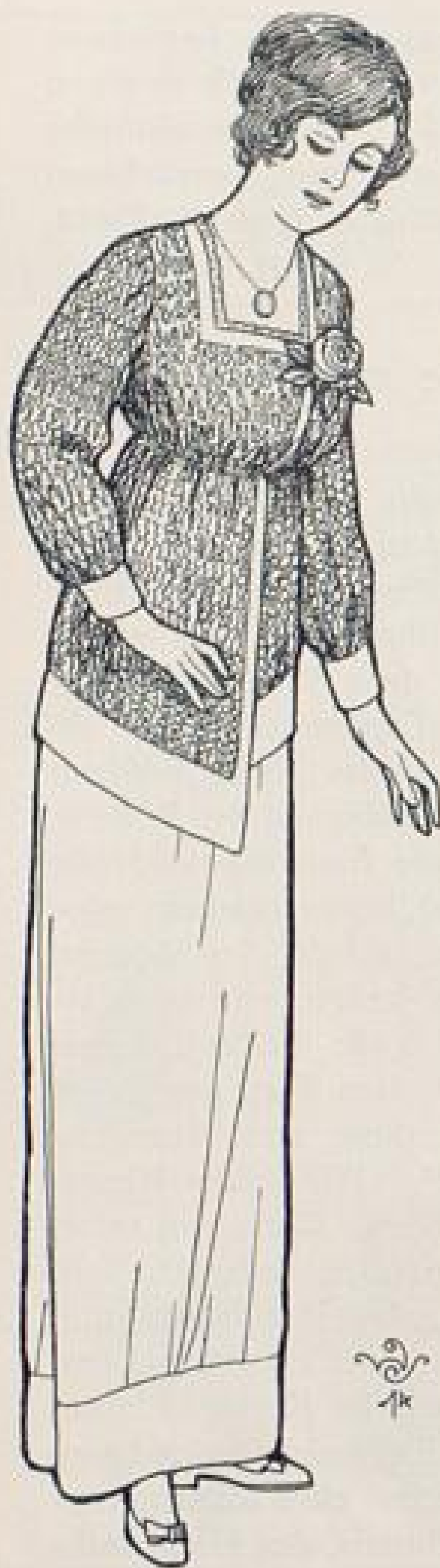
Abb. XI. Hauskleid, entworfen von Walter Schulze, Berlin. Beschreibung Seite XI u. f. u. Schnittmusterbogen Nr. 3.

auf das Bewußtsein im Allgemeinen. Also der Ausdruck einer volkserzieherischen, nicht religiösen Tendenz.