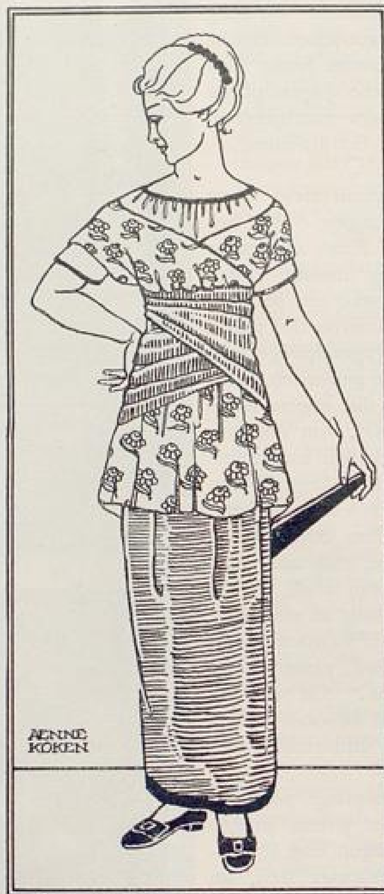
Abb. V. Jugendliches Abendkleid entworfen von Anne Koken, Hannover. Beschreibung und Rückansicht Seite XI u. f.

Die Frage nach dem rechten Weg in der Jugendpflege, nach der rechten Methode wird erst brennend, wenn man sich wirklich an die Arbeit herangewagt hat. Obgleich meine Tätigkeit noch eine unerprobte und meine Erfahrung nur auf ganz bestimmte Verhältnisse beschränkt ist, so wird ein Bericht über die Kruppsche Jugendpflege, den ich in der nächsten Nummer dieser Zeitschrift geben möchte, zeigen, wie viel neue Wege gesucht werden müssen und wie mancherlei Anregung die gebildete Frau dabei geben kann.