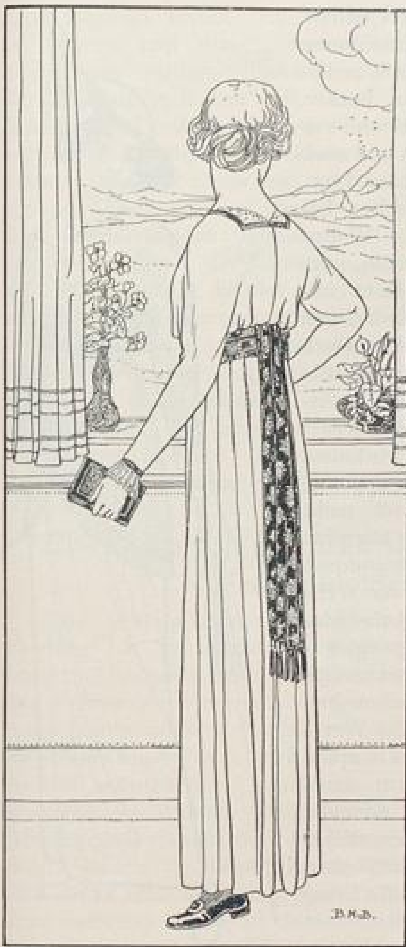
Abb. X. Rückansicht zu Abb. IX.

Empfangszimmer mit harten, steifen Stühlen, dann das Arbeitszimmer mit kleinem Schreibtisch, daran anschließend ein Bücherzimmer und zuletzt das Schlafstübchen, in dem noch die Bettstelle steht, die zusammengeklappt und so als Koffer auf die Reise mitgenommen wurde. —