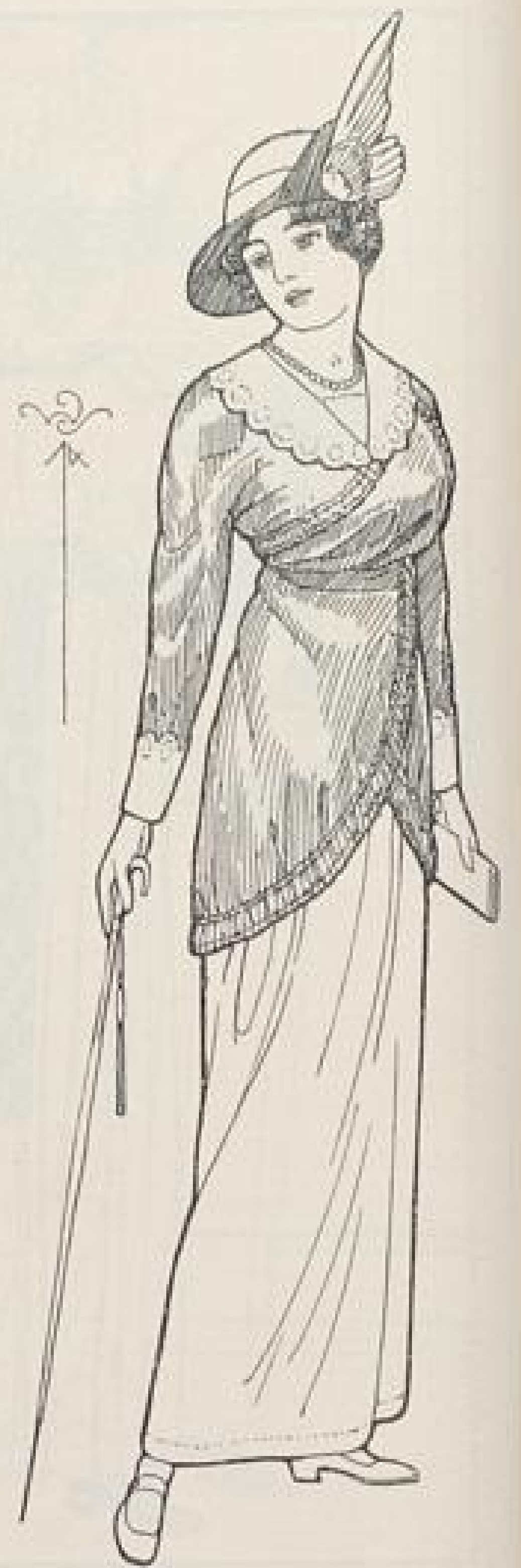
Abb. XII. Straßenkleid, entworfen von Walter Schulze, Berlin. Beschreibung Seite XI u. f., Schnitt der Jacke, Schnittmuster- bogen Nr. 4.