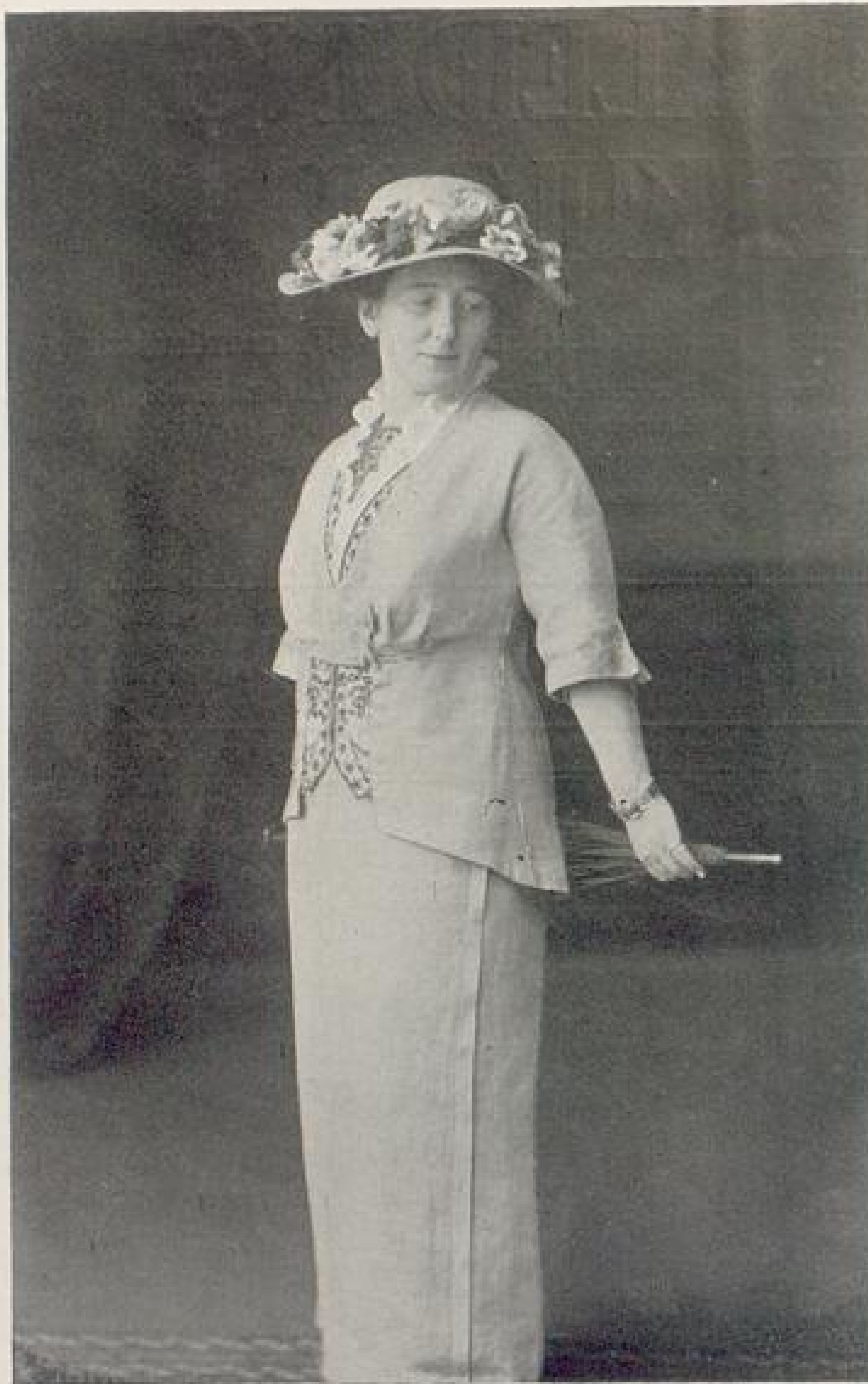
Abb. II. Lila Leinenkleid mit eingesetzter Weste von Emmy Schoch, Karlsruhe. Beschreibung Seite XI u. f.

die uns umgebenden Gegenstände — sie sind nicht so rasch aus der Welt zu schaffen. Wenn frühere Generationen ohne weiteres Gutes auch als gut betrachteten, so müssen wir uns belehren lassen, daß dasjenige, was uns gut schien, tatsächlich schlecht war. Gewiß wird heute in den meisten Gewerben nach dieser Richtung Aufklärung gegeben und vor allem in den Gewerbeschulen, d. h. der Lehrer wird den Schüler bei den einzelnen Lehrgegenständen des Gewerbes die neuen Forderungen in dem Maße zu demonstrieren suchen, als sie ihm selbst geläufig geworden sind. Aber wird nicht auf diese Weise manches Einseitige, Halbverdaute gelehrt werden? Und vor allen Dingen: muß es nicht mühsam und zeitraubend sein, immer wieder am einzelnen Gegenstand große allgemeine Forderungen klar zu legen? Und wird nicht dem Schüler in vielen Fällen der Zusammenhang des einzelnen unklar, der Überblick über das Ganze vorenthalten bleiben? Hier könnten, wie uns scheint, nur allgemein belehrende Vorträge helfen und zwar nicht nur für die zukünftigen Gewerbetreibenden, sondern vor allem