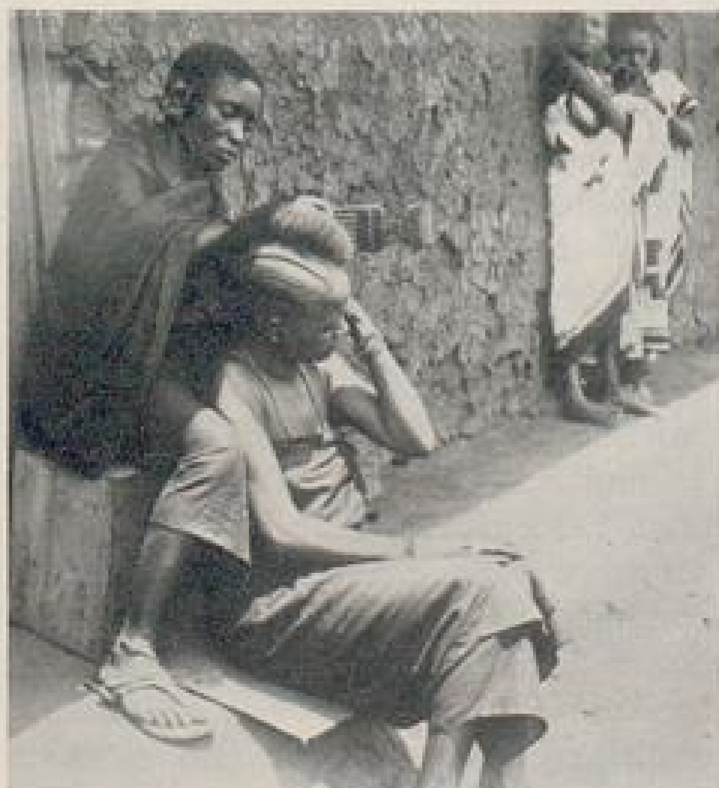
Abb. XIII. Bei der Toilette. Zu den Ausführungen: Etwas von der Haartracht der Negerfrauen in Ostafrika. Seite 84.

Und da ist es höchst merkwürdig, daß die modernen Kleiderkünstlerinnen mit wenigen rühmlichen Ausnahmen,