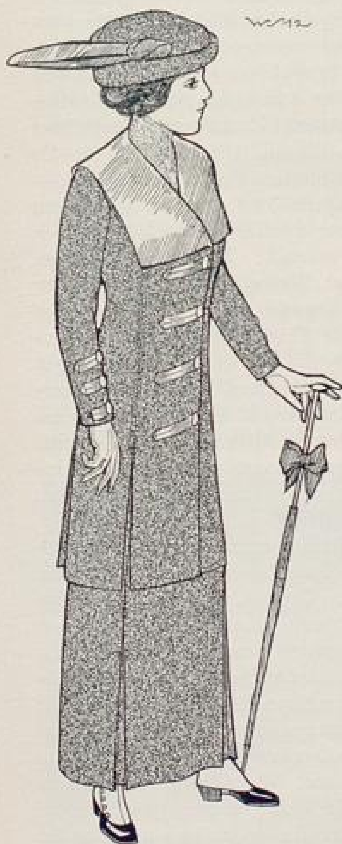
Abb. XI. Straßenkleid mit Jacke. Beschreibung Seite IX u. f. und Schnittmusterbogen Fig. 1—9.