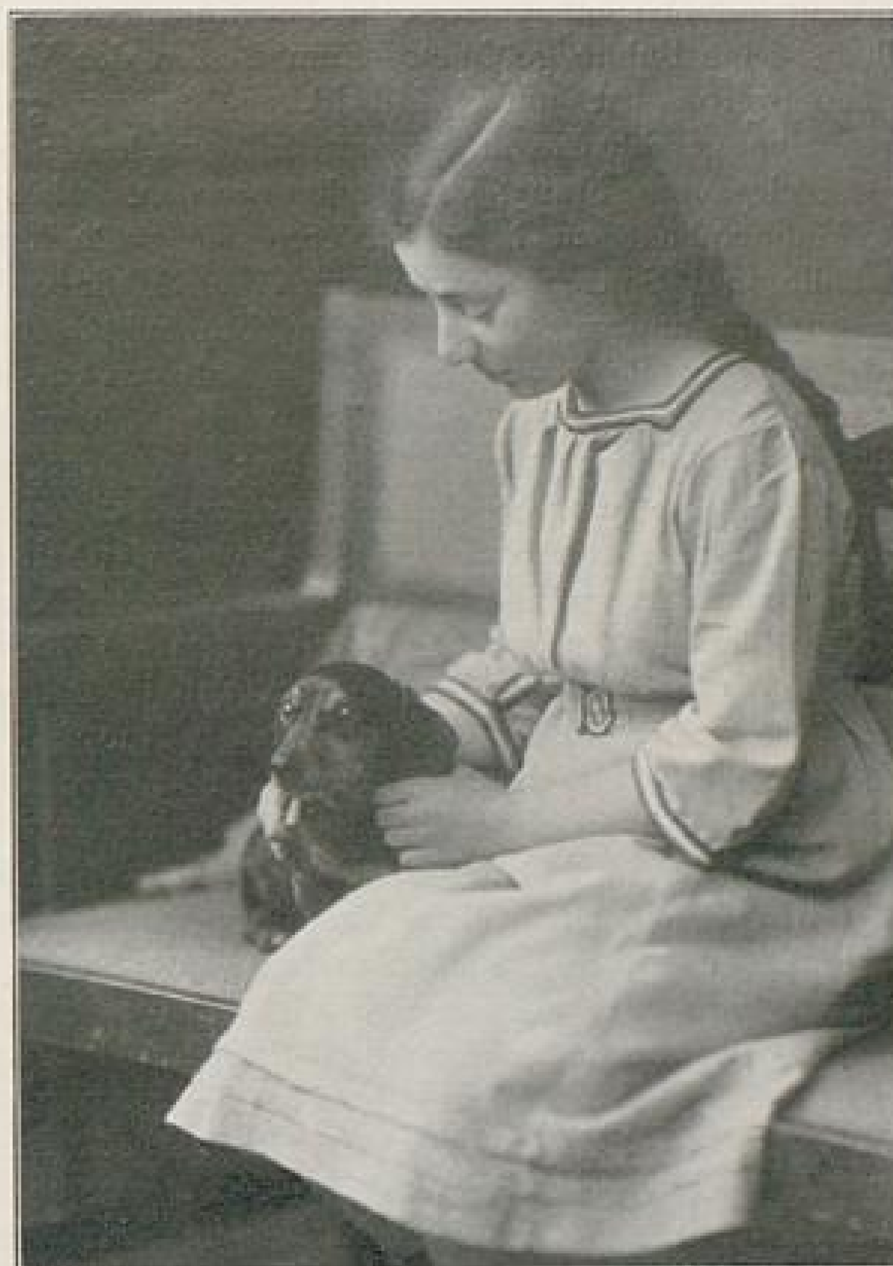
Abb. IX. Neues Neldakleid für Mädchen und Erwachsene von Eva Mertens - Köln. Beschreibung und Rückansicht Seite IX u. f.

sich in Geistesschwäche und Irrsinn offenbaren. — Es ist klar, daß eine derartige, auf den Schulen eingeführte Belehrung wirksamer sein muß, als alle sonstigen gegen den Alkoholgenuß angewandten Mittel. Und man wird im Anschluß daran unwillkürlich fragen, ob es nicht Aufgabe der Schule wäre, in den Oberklassen gewisse Grundzüge der Gesundheitspflege zu lehren, damit unsere künftigen Mütter wissen, wie wir den schlimmsten Feinden der Volksgesundheit gegenüberzutreten haben. Und weiterhin drängt sich der Gedanke auf, ob dieser Unterricht nicht der Turn- und Gymnastiklehrerin übergeben werden müßte. Ihr liegt dieses Gebiet entschieden näher, als z. B. der Handarbeitsunterricht, der bei ihrer Anstellung vielfach als zweites Fach von ihr gefordert wird.