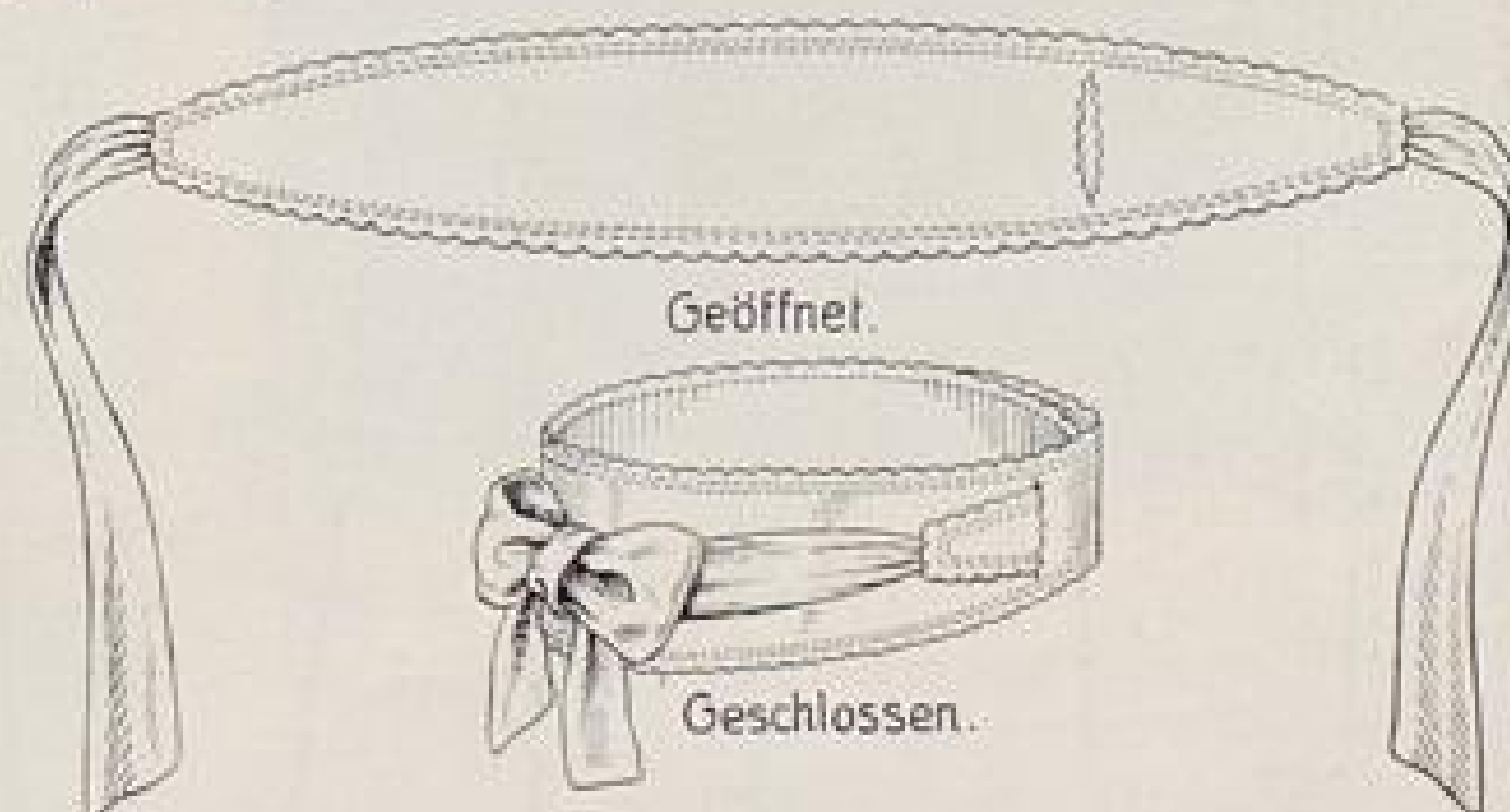
Abb. XVII. Babygürtel zum Festhalten der Tücher. Beschreibung Seite XI.