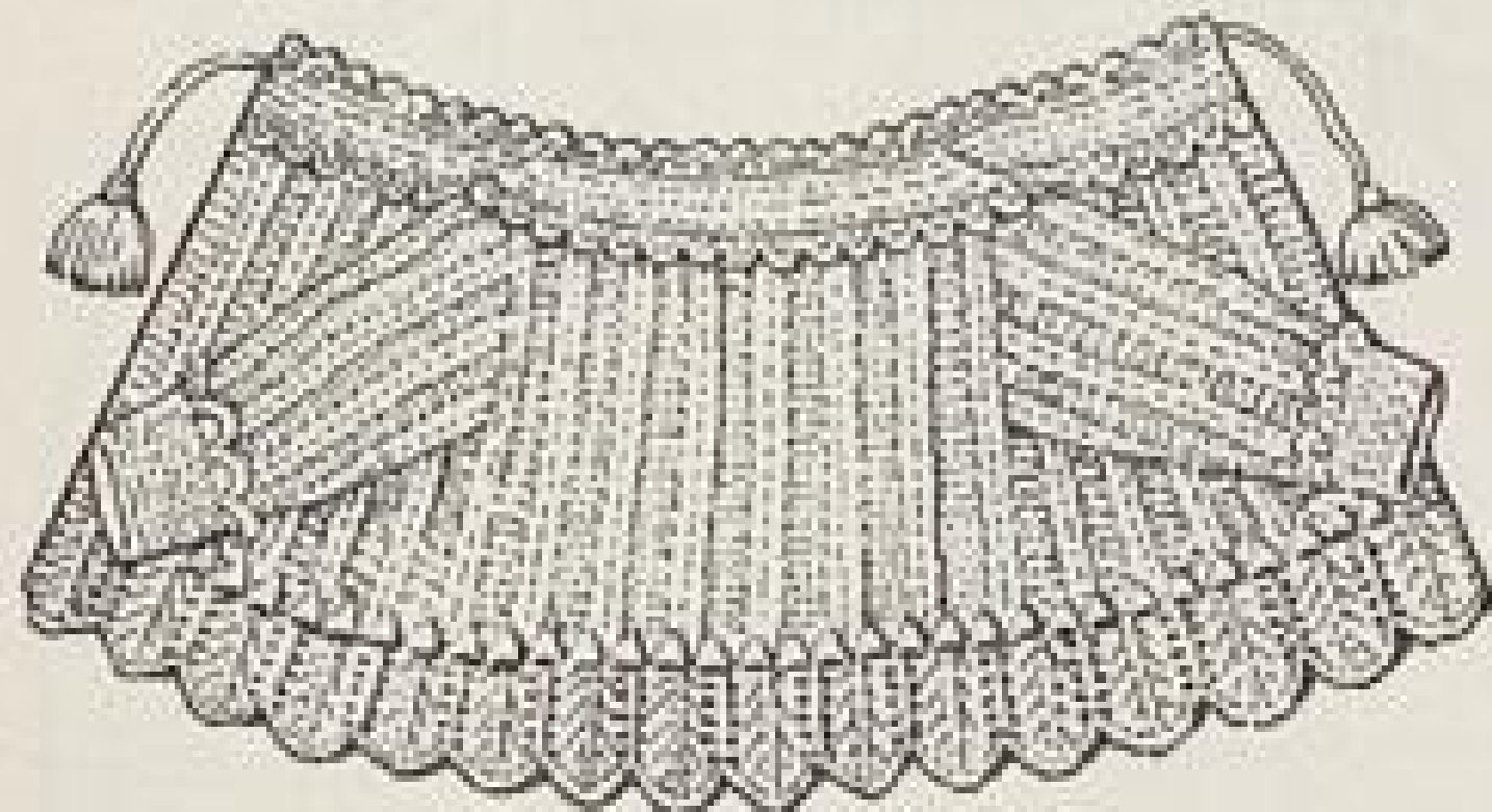
Abb. XV. Gestricktes Jäckchen. Strickanleitung Seite XI.