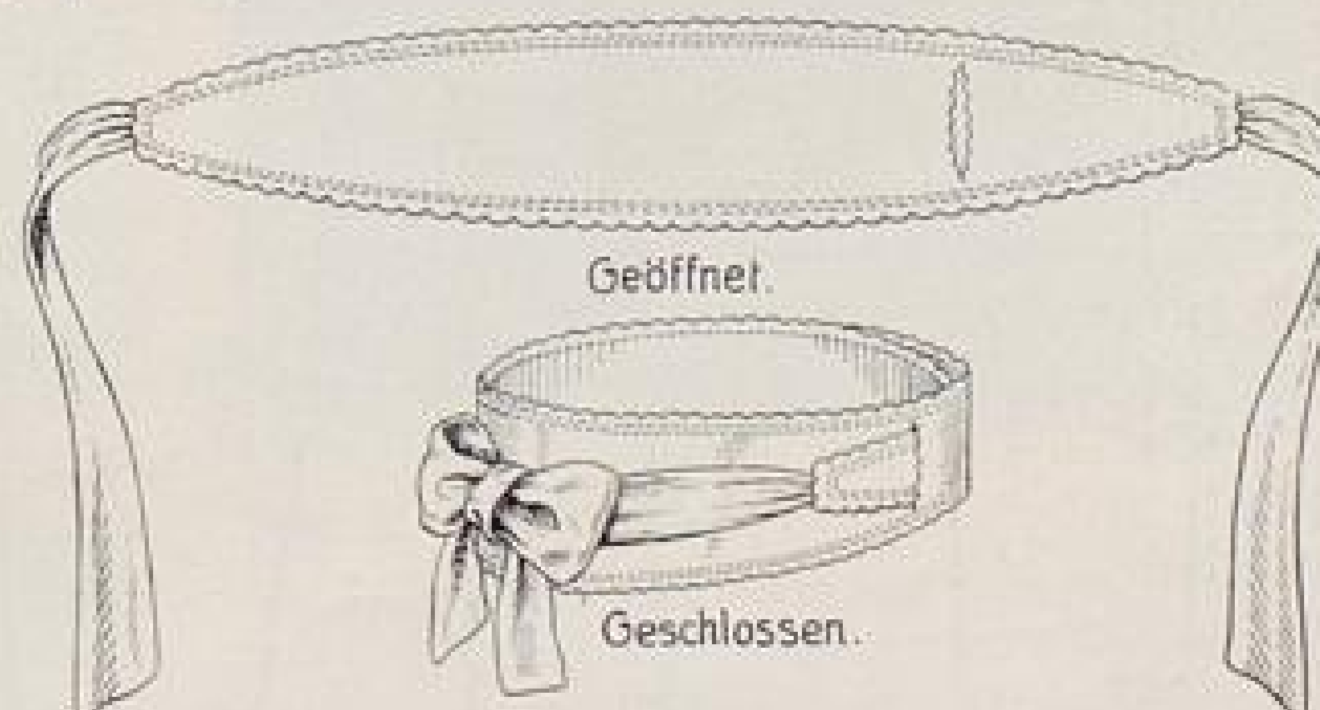
Abb. XVII. Babygürtel zum Festhalten der Tücher. Beschreibung Seite XI.

Was junge Leute wissen sollten und Eheleute wissen mußten. Von Dr. med. Franz Schönenberger und W. Siegert, Verlag Lebenskunst-Heilkunst, Berlin, SW. Preis 3 M.