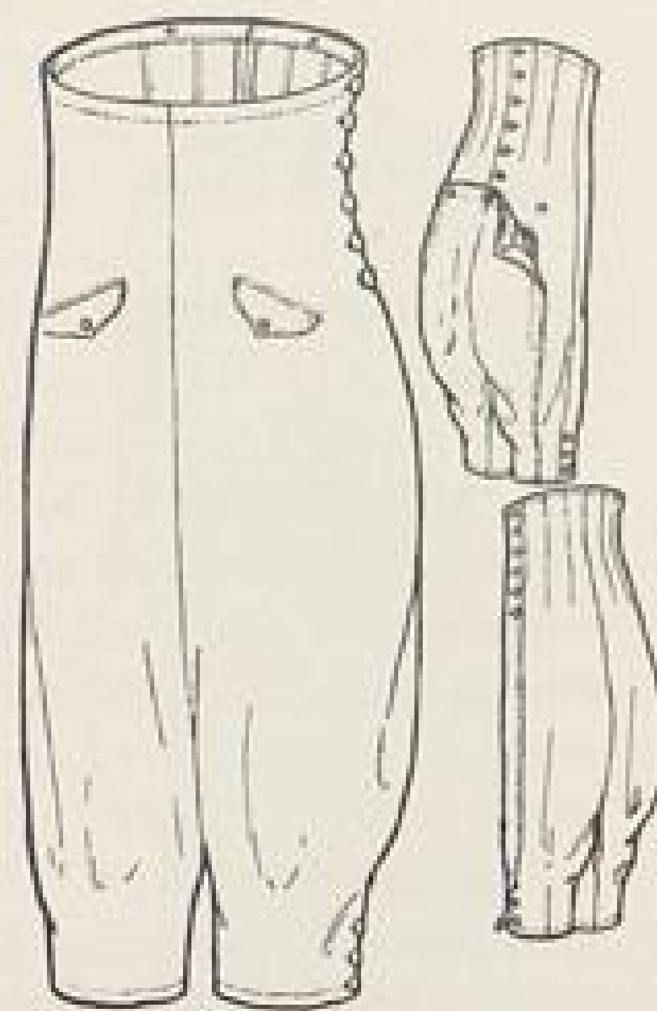
Abb. XIV. Sportbeinkleid, speziell zum Ski- laufen, zum Anknöpfen an ein Leibchen von Marg. Buschhausen-Köln.

Die Rückansicht zeigt eine Aus- führung als Reformhose.