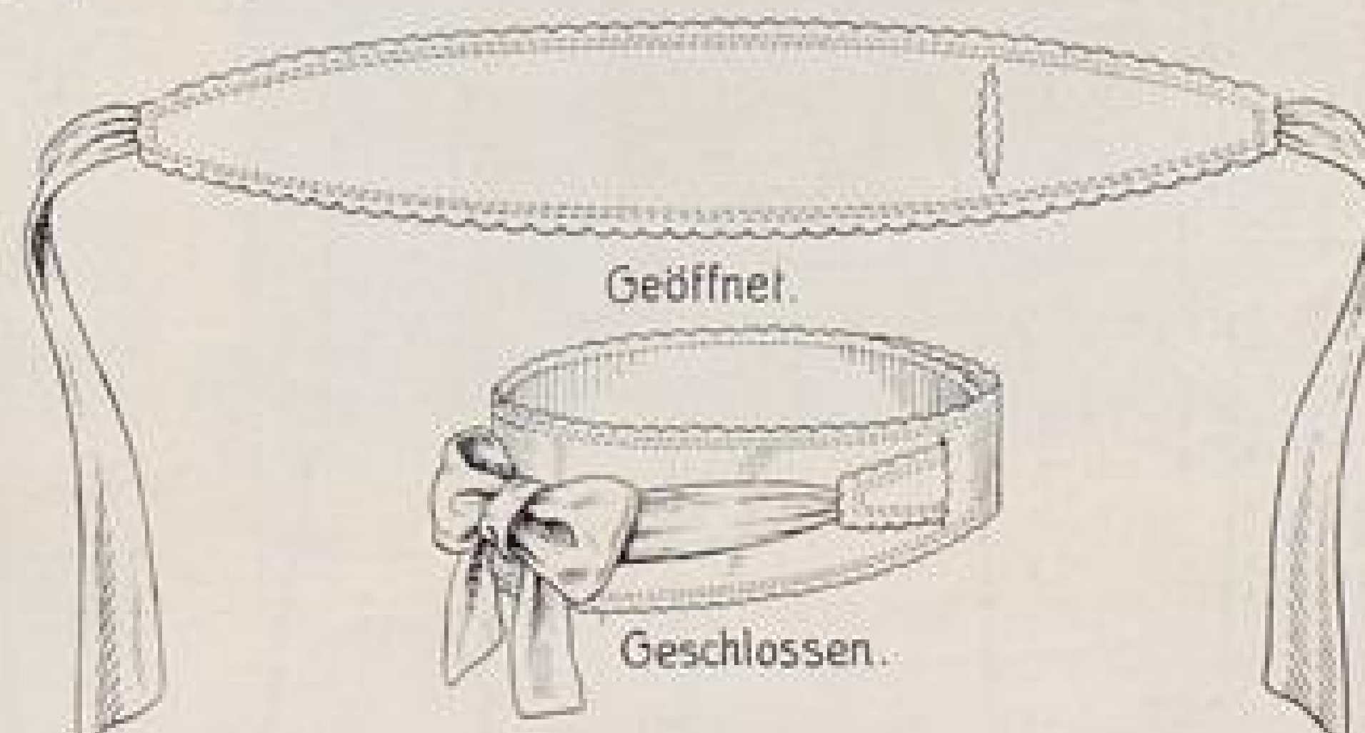
Abb. XVII. Babygürtel zum Festhalten der Tücher. Beschreibung Seite XI.