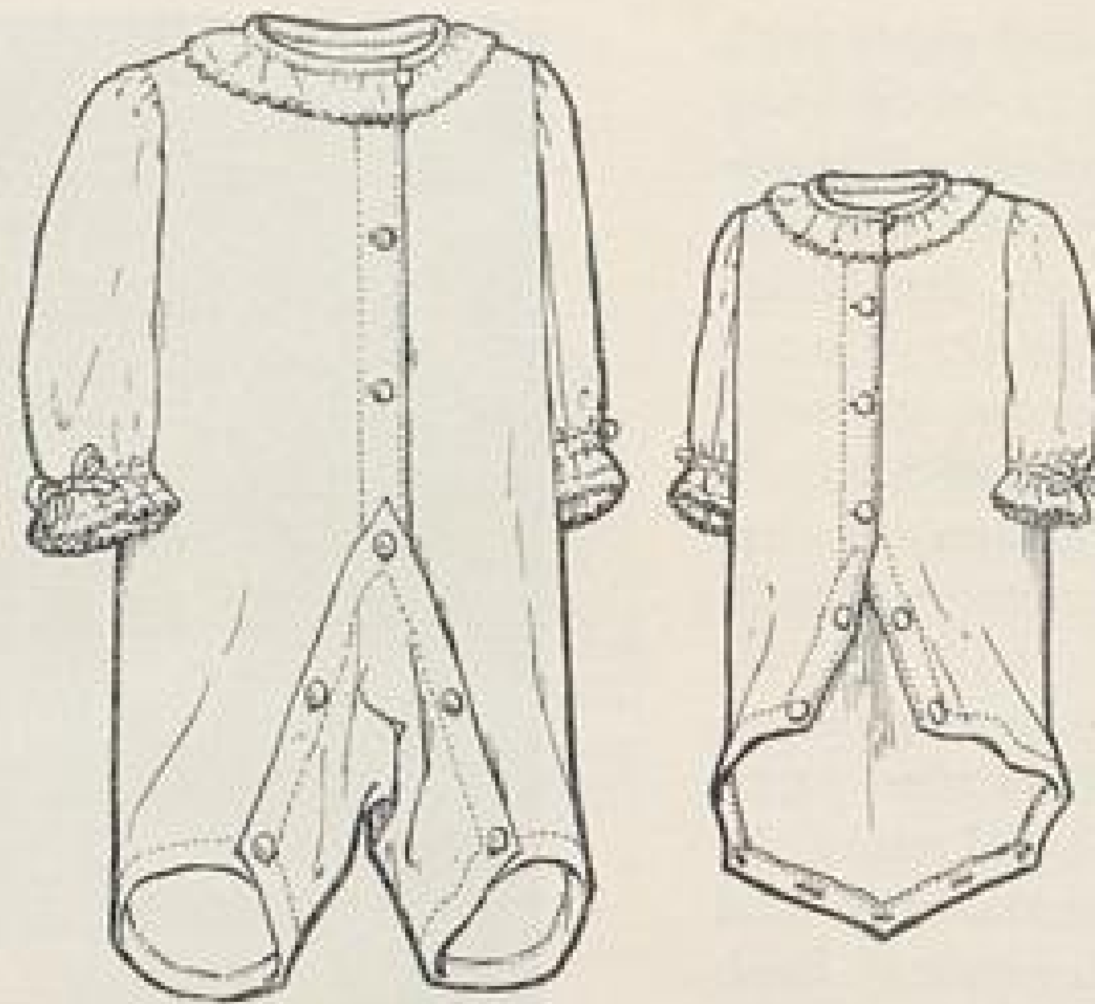
Abb. XIX. Nachthose für 1—2 jähriges Kind. Beschreibung Seite IX u. f. und Schnittmusterbogen Fig. 25 und 26.