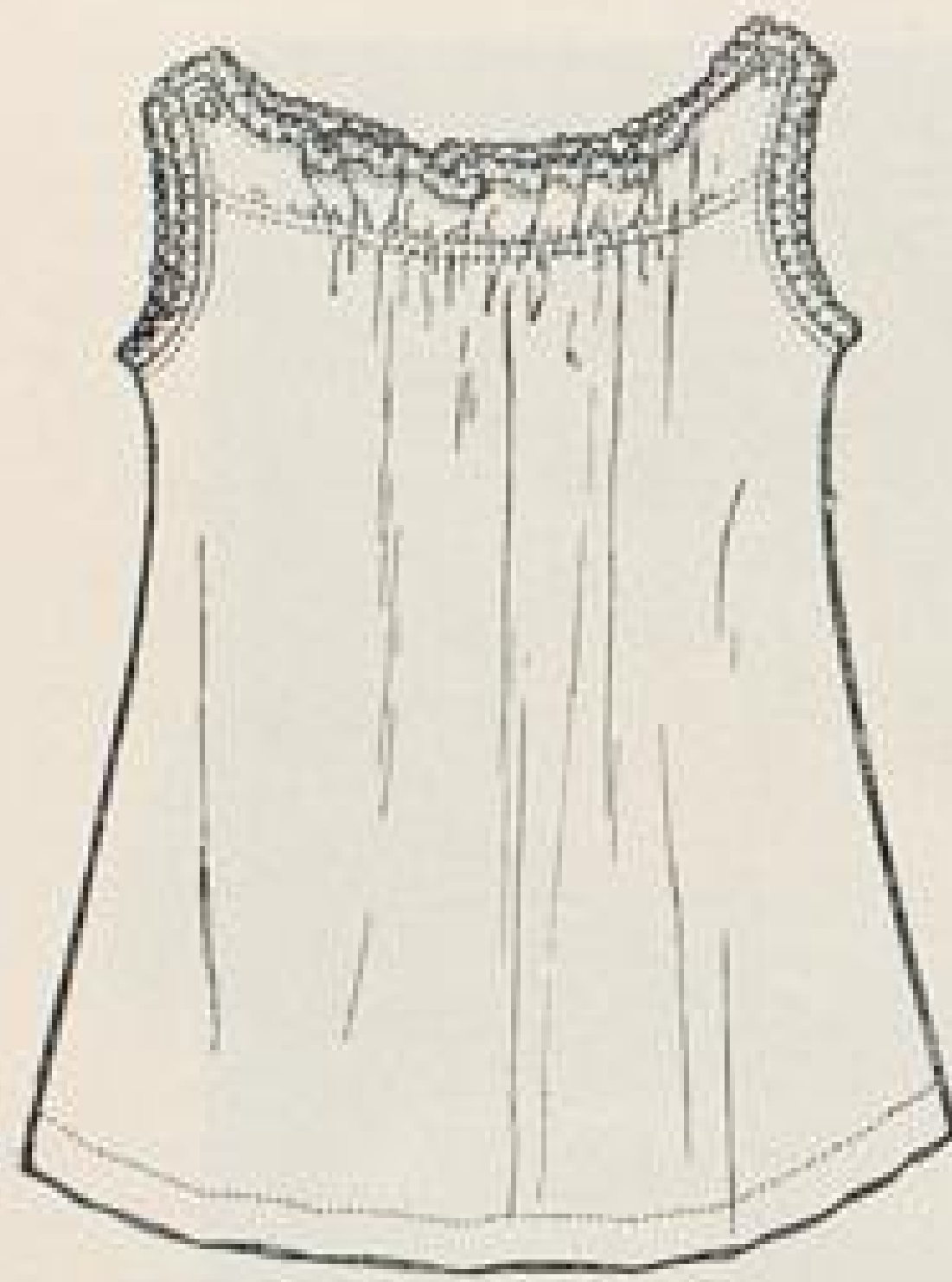
Abb. XVIII. Taghemd für 1—2 jähriges Kind. Beschreibung Seite IX u. f. und Schnittmusterbogen Fig. 23.