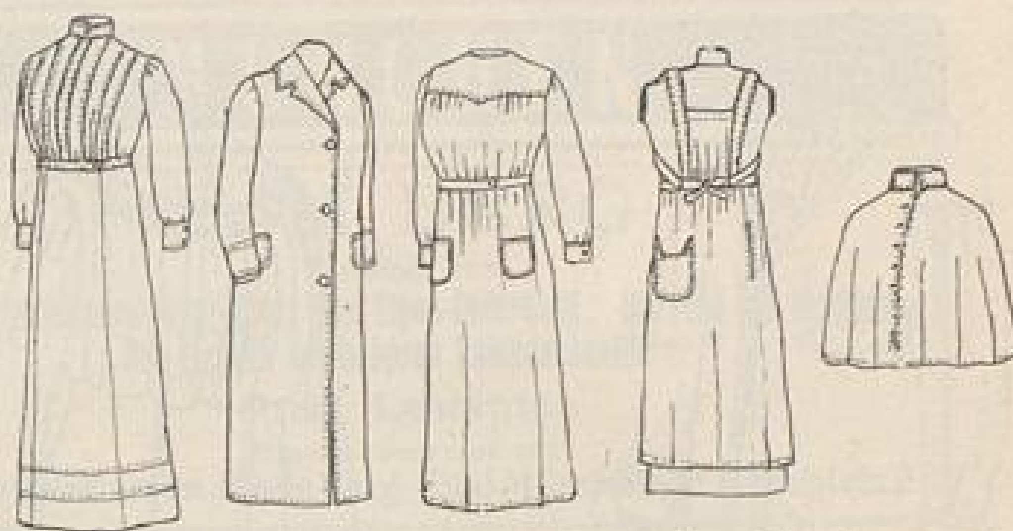
Abb. XI. Vollständige Kleidung für Krankenpflegerinnen. Kleid. Mantel. Ärmelschürze. Trägerschürze. Schulterkragen.

Abb. III. Straßenkleid aus einfarbigem Wollstoff. Grüner Stoff mit bunt gewebter Seide, in der blaue und grüne Farbentöne vorherrschen, geben das Material zu dem Kleide. Dazu passender Leder- oder Seidenstoffgürtel mit Perlmutter-Schnalle in den Farben der bunten Seide. Die anschließenden Ärmel sind mit starkem Paspelvorstoß aus dem Kleidstoff den tief geschnittenen Achseln untergesteppt. Knöpfe zum Gürtel passend. Vorstoß am Handgelenk aus bunter Seide. Der glatten, anliegenden Futtertaile sind die einfachen Futterärmel einzusetzen,