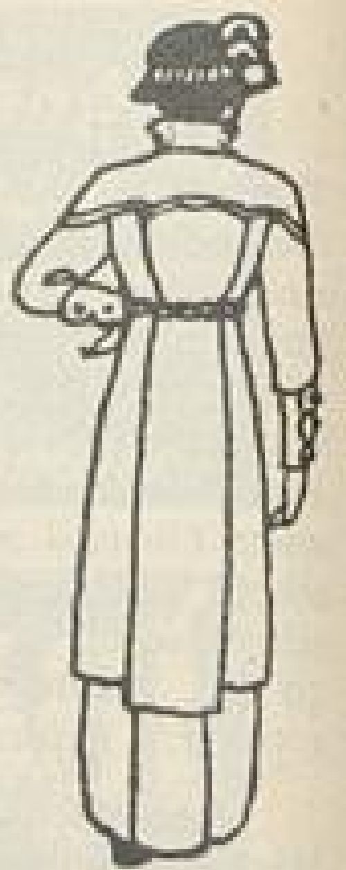
Rückansicht zu Abb. VII.

Abb. XI. Vollständige Kleidung für Krankenpflegerinnen. Mit unseren Abbildungen geben wir die Vorlagen der am gebräuchlichsten Kleidungsstücke, die für die z. Z. in den Samariterkursen ausgebildet werdenden Privatpflegerinnen zumeist in Frage kommen. Das Kleid ist aus Hemdbluse und angeknöpftem, fünfbahnigen Rock zusammengestellt, der abgesteppte Gürtel verdeckt die Knöpfe. Die Blusen-