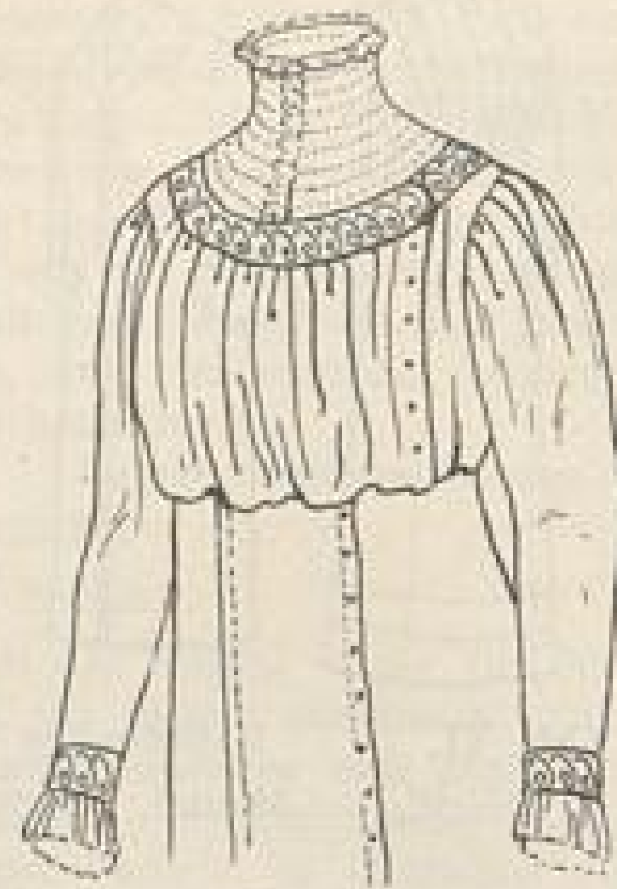
Bluse mit Tülleinsatz zu Abb. IV.