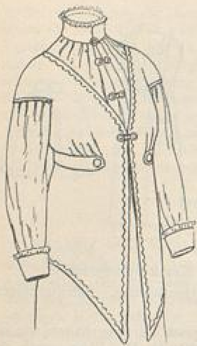
Jackentaille mit einfacher Bluse zu Abb. IV.