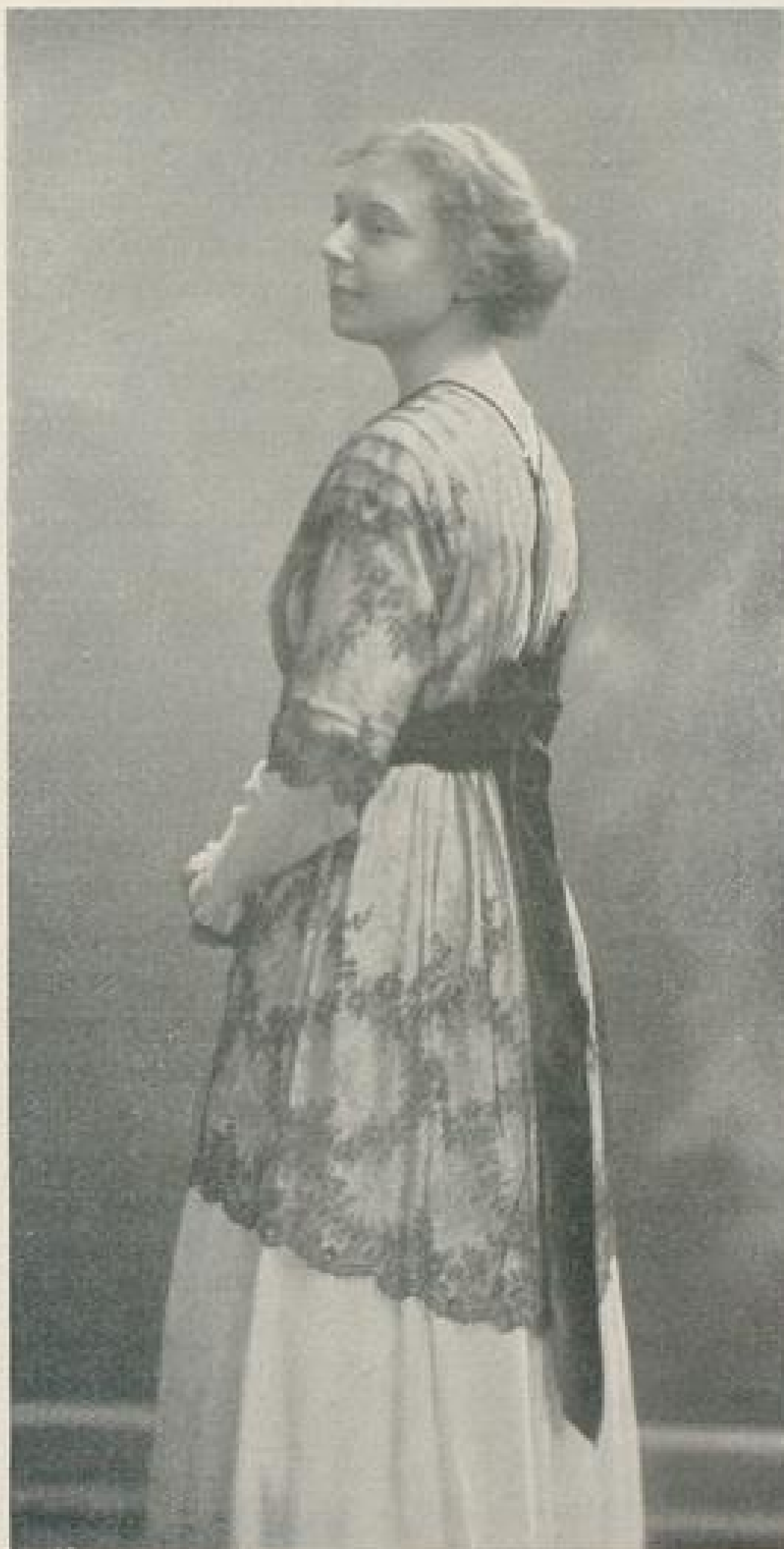
Abb. II. Gesellschaftskleid entworfen von E. Wolf-Hannover. Beschreibung Seite VII u. f.