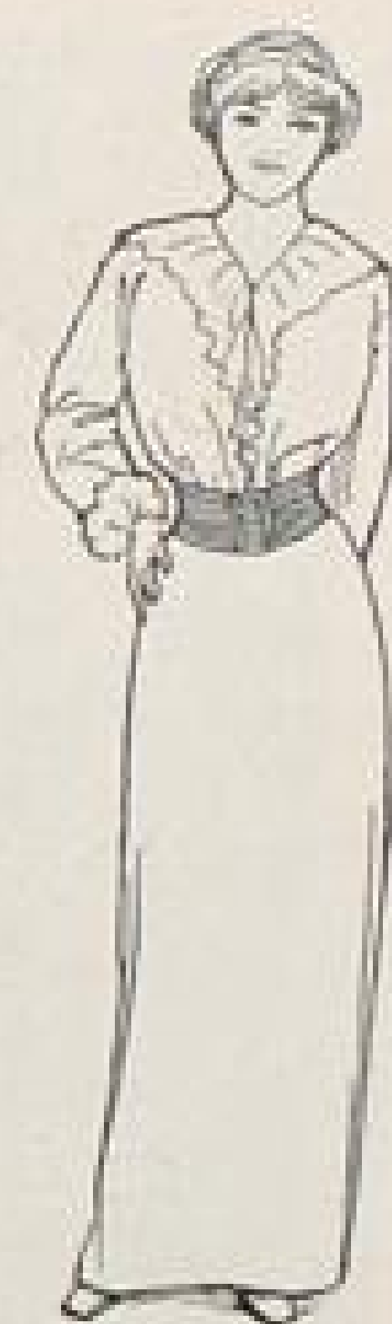
Zu dem Aufsatz: Gummigürtel.

Von der Fuldaer Bischofskonferenz. In den Beschlüssen der Bischofskonferenz über die sexuelle Aufklärung heißt es unter anderem: »Niemand sind gemeinsame