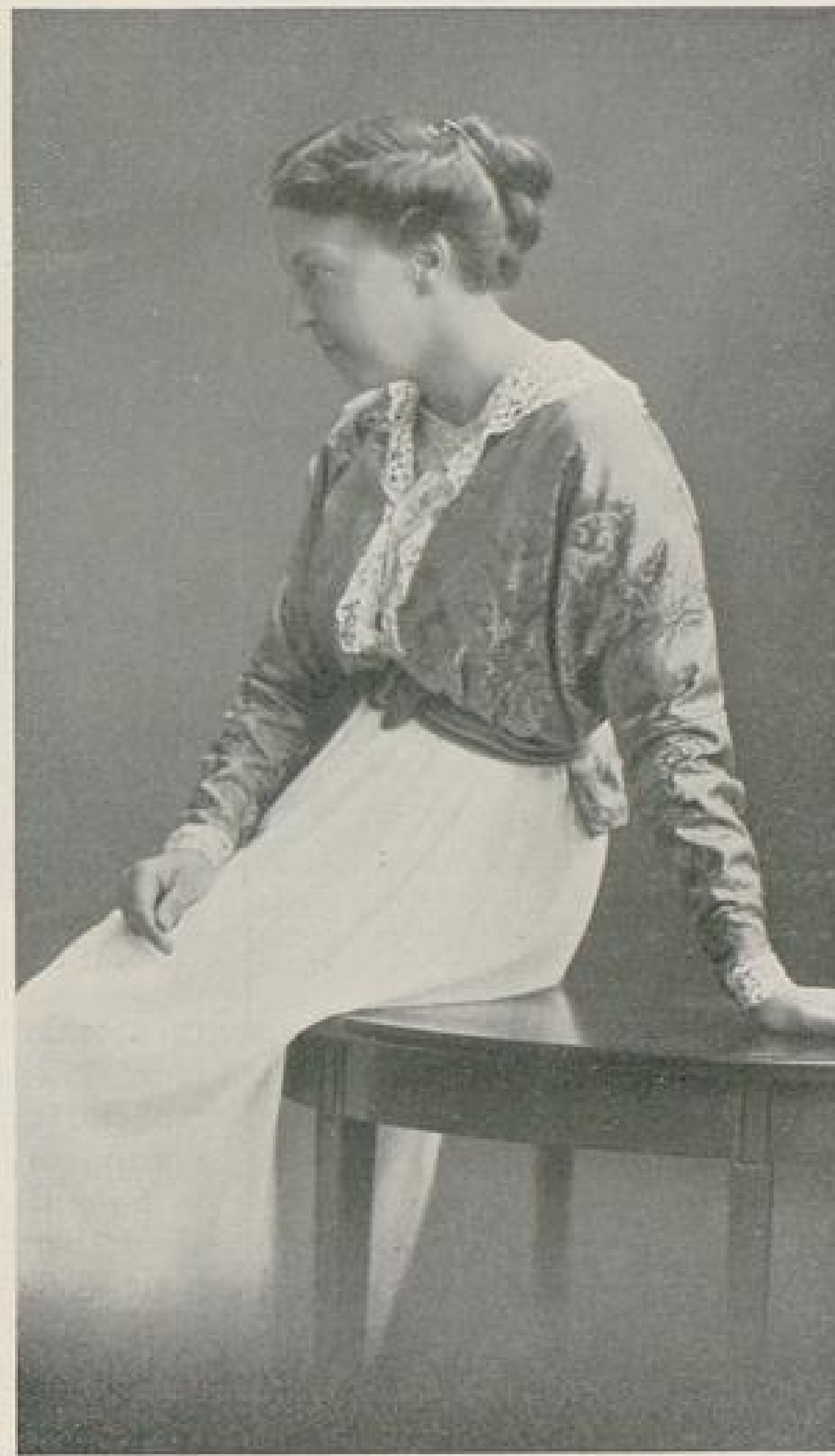
Abb. III. Blusenjäckchen entworfen von Eva Fricke-Hannover. Beschreibung Seite VII u. f.

die breitem sind. Darunter liegende Maße oder falsche Proportionen deuten auf krankhafte Veränderungen der Knochen, meist Reste von Rhachitis hin. Kräftig entwickelte Frauen können auch etwas breiter gebaut sein; das ist kein Fehler, wenn die Proportionen sonst stimmen.