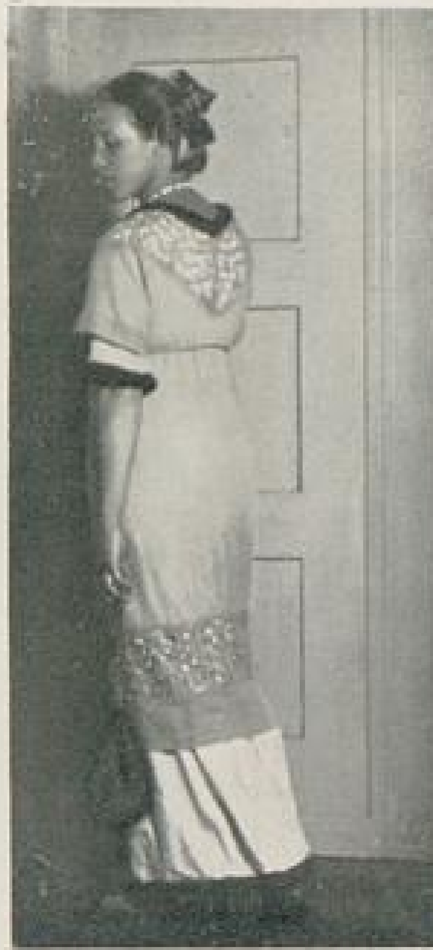
Abb. Va. Rückansicht zu Abb. V.

Der dem Rahmen des Spiels entwachsenen Interessengemeinschaft zwischen Knaben und Mädchen bleibt es versagt, auf das Gebiet des Unterrichts hinüberzugreifen. Diese und jene lernen lesen, schreiben, rechnen; für die einen und die andern liegt die Wüste Sahara in Afrika, die Wüste Gobi in Asien usw. — Solches übermitteln man ihnen jedoch nicht in einem Raum. An ihrer Heranbildung und der Vorbereitung auf den Ernst des Lebens dürfen sie nicht gemeinsam schaffen. Damit wird ihnen zugleich harm- und zwangloser Verkehr überhaupt verwehrt und das Zusammensein nur unter einem besondern »Schutz« und für bestimmte Gelegenheiten als »passend« hingestellt. Ungehindert, oder vielmehr geradezu angefeuert, dürfen sie auf Kinderbällen, einander umschlingend,