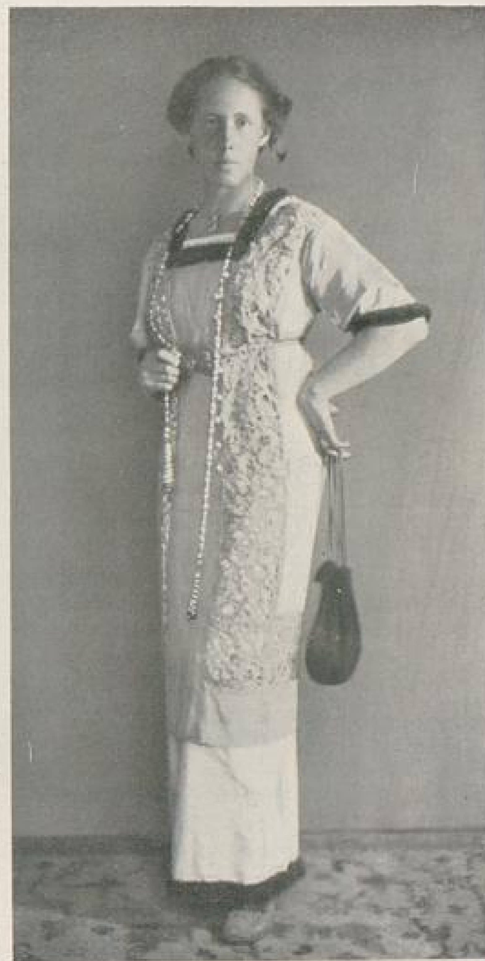
Abb. V. Gesellschaftskleid von E. Veil-von Neander-München. Beschreibung Seite VII u. f.

die Füße nach den Klängen der »schönen, blauen Donau« in Bewegung setzen. Würden sie aber zusammen in einer Klasse zum Flußlauf der Donau, zu fremden Sprachen usw. in innere Beziehungen treten, so ginge natürlich die Welt aus den Fugen.