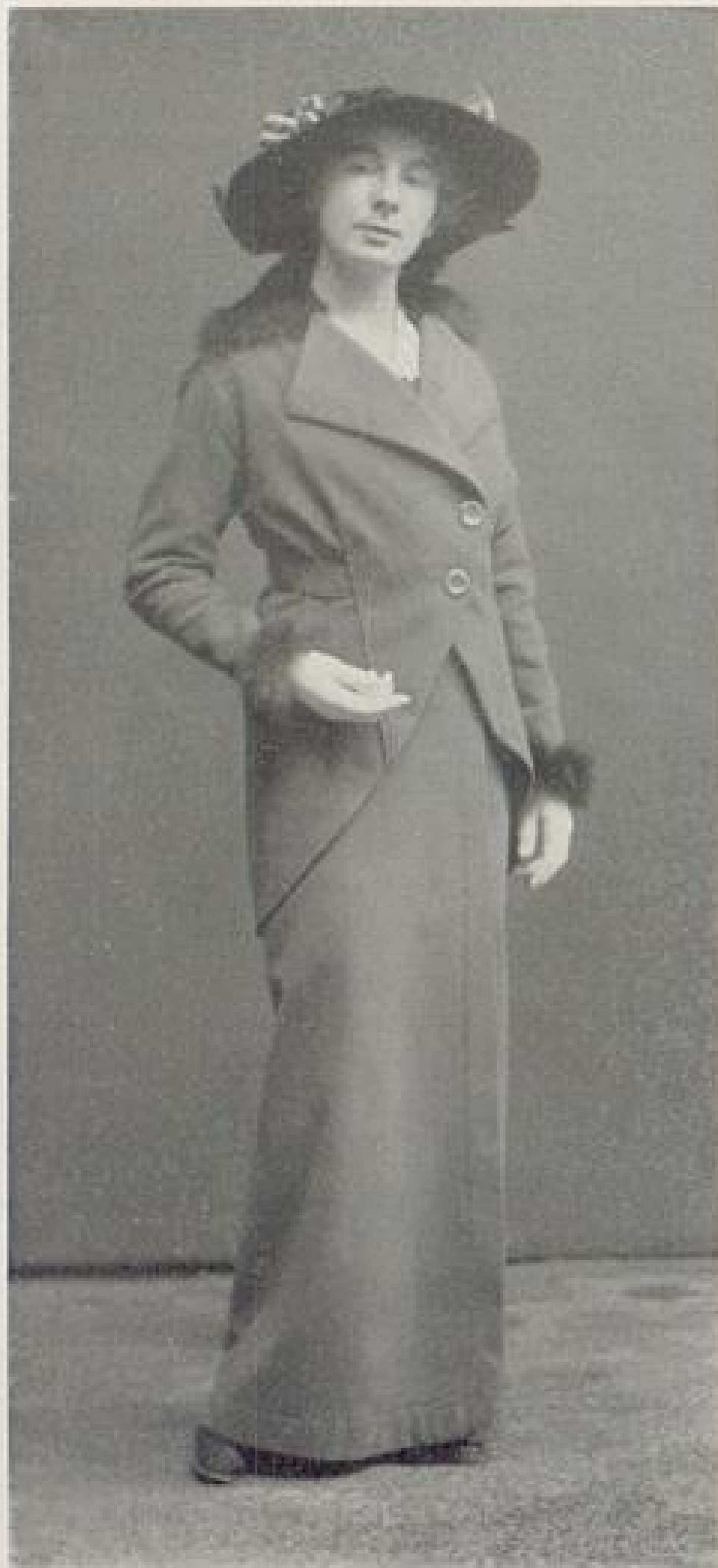
Abb. IV. Jackenkleid aus Tuch mit Pelzbesatz von Elisabeth Rudtke-München. Beschreibung Seite VII u. f.