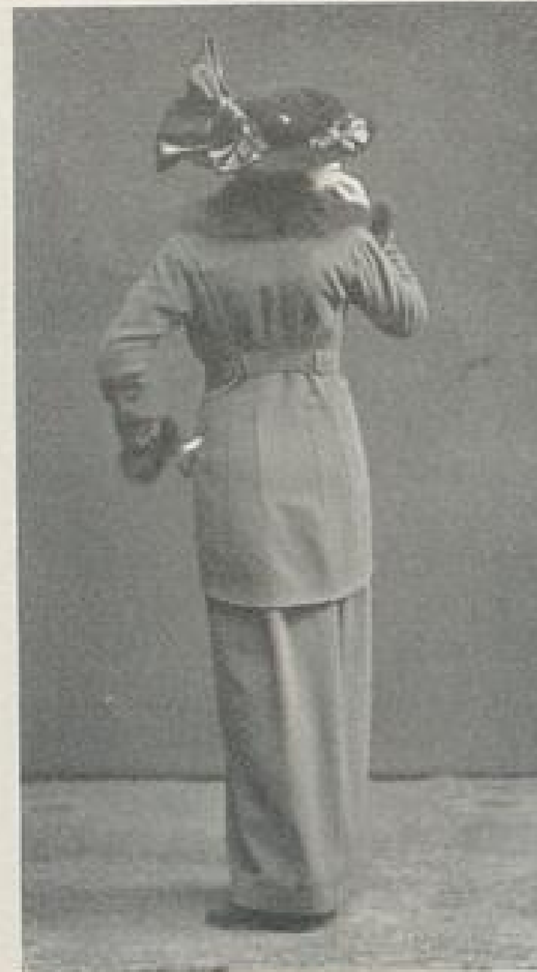
Abb. IV a. Rückansicht zu Abb. IV.

cm über ein Meter groß ist; also muß ein Mensch, der 160 cm groß ist, 60 kg wiegen. Diese Berechnung gilt nur für Erwachsene, nicht für Kinder.