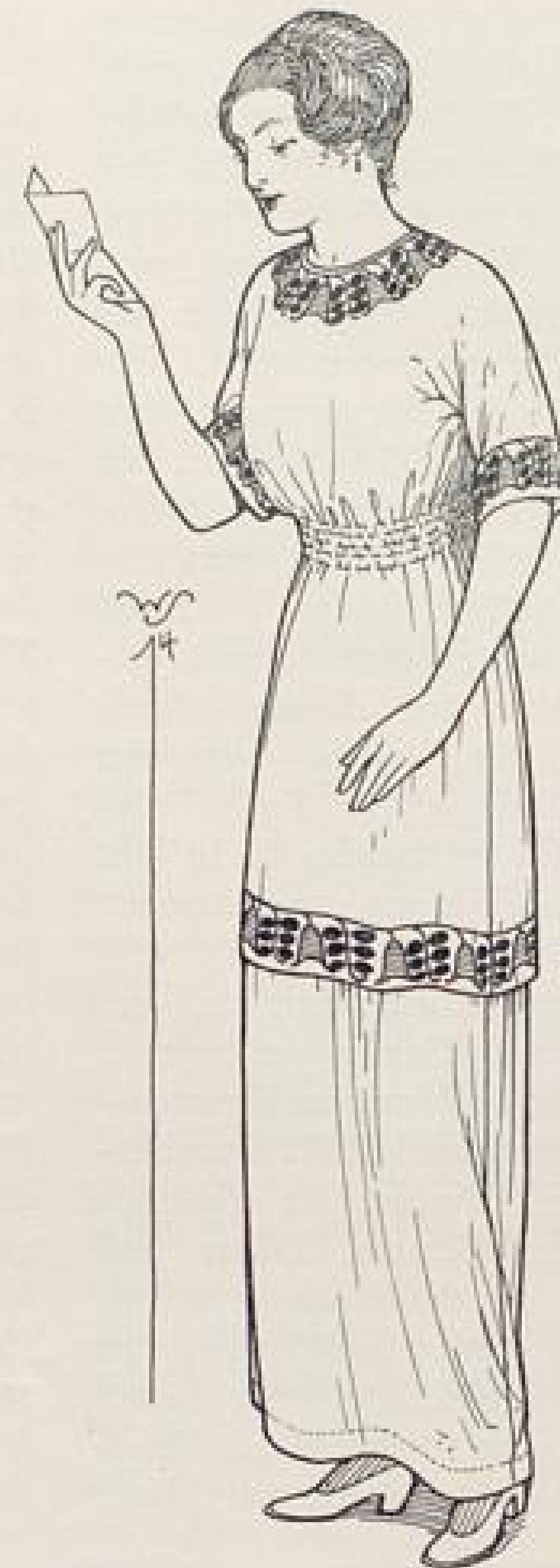
Abb. VI. Weißes halbseidenes Batistkleid mit schwarz-grüner Stickerei von Lambert Marchmeyer, Gildehaus, Provinz Hannover. Beschreibung Seite IX u. f. Schnitt und Mustervorzeichnung auf dem Schnittmusterbogen Nr. 5. Fig. 26-32.

Aftermieter beherbergen! Diese Häufung von Menschen wird durch die Preise bedingt. Für eine Küche wird monatlich 10 bis 12 M gezahlt, für Zimmer ohne Küche (ohne Aftermieter) gegen 13 M (mit Aftermietern 18—20 M). Für Stube und Küche 23—26 M, für 2 Stuben und Küche 33—40 M. Soll ein gesundes Verhältnis zwischen Wohnungsmiete und Einkommen bestehen, so muß die Miete \frac{1}{5} , höchstens \frac{1}{4} des Einkommens betragen. Zahlt eine Familie aber für Stube und Küche durchschnittlich 25 M monatlich, so bedingt das ein Einkommen von 1500 bezw. 1200 M. Diese Mieter haben aber meist unter 1200 M festes Einkommen, und nehmen Aftermieter, um es zu erhöhen. Ich möchte noch besonders betonen, daß der Zwang der Verhältnisse bei vielen Leuten bereits zur bösen Gewohnheit geworden ist. Ganz gut gestellte Familien, die es dazu haben allein in ihrer Stube und Küche zu hausen, wohnen in der Küche, vermieten die Stube, und haben noch einen »Herrn« auf dem Flur wohnen. Sie finden das sehr schön, denn es bringt Geld, und aus dem engen Zusammenwohnen mit Fremden machen sie sich nichts. Das Gefühl für das gesundheitlich und moralisch