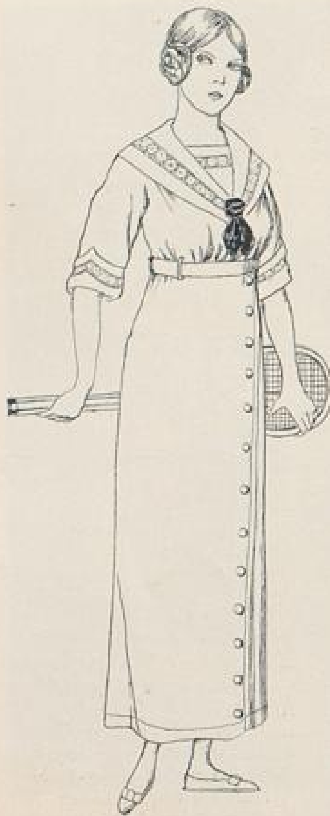
Abb. XVI. Tenniskleid aus mittelblauem Ripspikée.

Beschreibung Seite IX u. f. Schnitt und Rückansicht auf dem Schnittmusterbogen Nr. 4, Fig. 20-25.