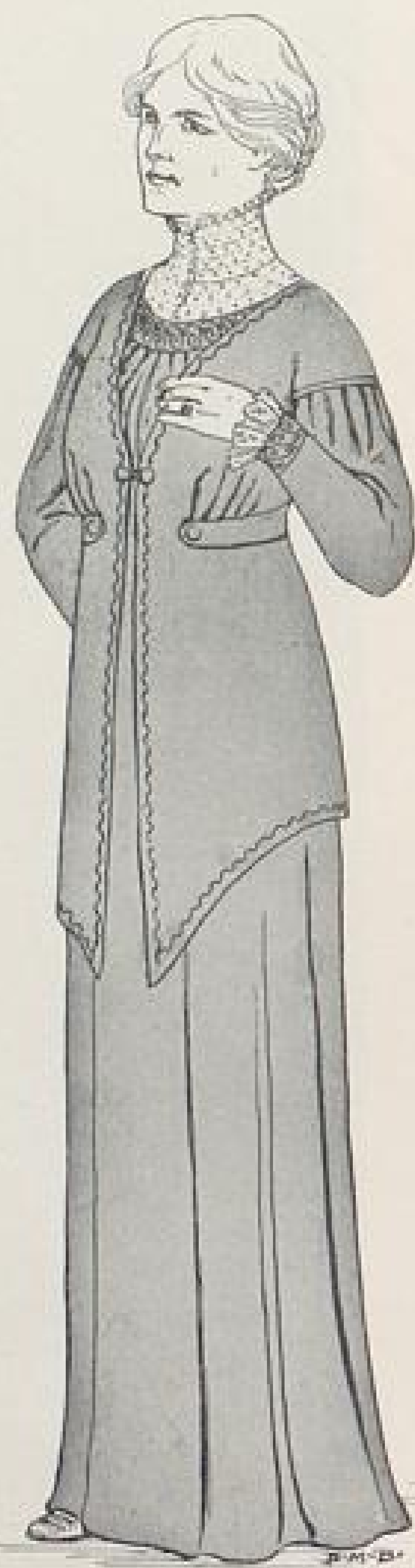
Abb. IV. Kleid für ältere Damen mit verschiedenen Blusen. Beschreibung und Einzelheiten Seite IX u. f.

Völker erheben, müssen wir immer weiter pflegen und gerade sie müssen sich auch in unserer neuen deutschen Frauenkleidung ausdrücken. Der zweite Grundsatz wird demnach sein: Wahrheit und Ehrlichkeit in unserer Kleidung und Selbstbeherrschung, die sich darin zeigen muß, daß wir keine unsinnigen oder herausfordernden Kleiderformen annehmen.