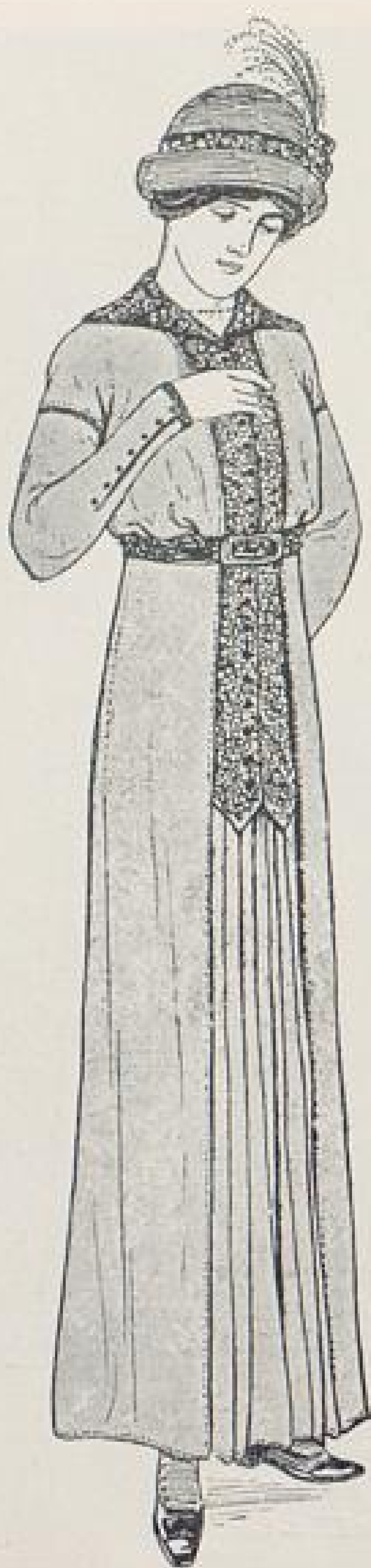
Abb. III. Straßenkleid aus einfarbigem Wollstoff mit Kragen und Weste aus schwarz- und bunt- gewebter Seide. Beschreibung Seite IX u. f.