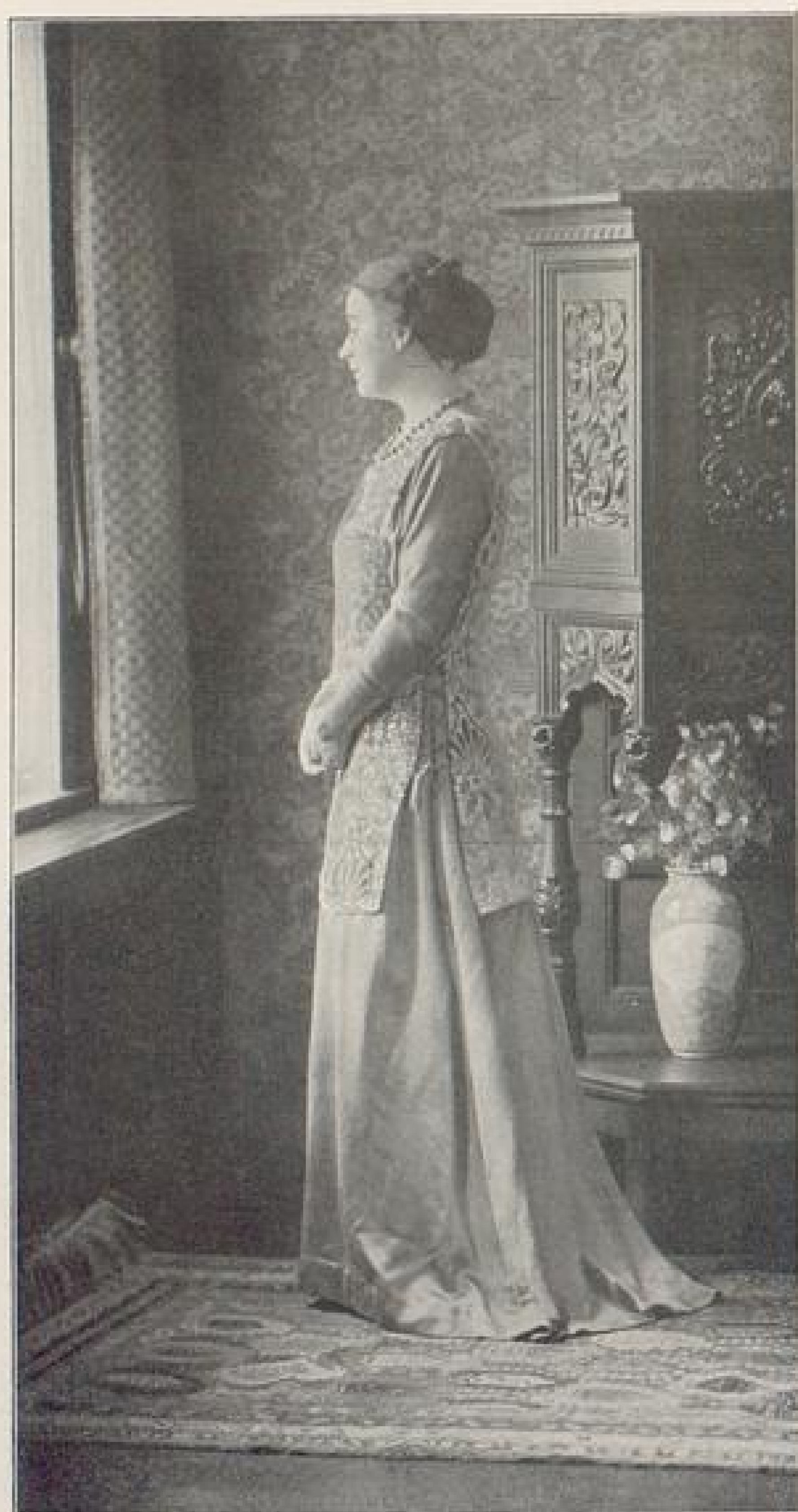
Abb. V. Abendkleid von Paula Schulz-Pruß, Hannover. Beschreibung Seite IX u. f.

die deutsche Herrenmode unter dem Zwange der Zeitumstände sich der bisherigen englischen Vorherrschaft zu entziehen, und ein gleiches zeigt sich auf dem Gebiete der Frauenkleidung. Es ist ein ganz besonderes Verdienst dieser Zeitschrift, schon seit Jahren auf das Entwürdigende hinzuweisen, das in der sklavischen Abhängigkeit unserer deutschen Frauenmodeindustrie von den französischen „Schöpfern“ der Modelle liegt, die jede billige Rücksicht auf wahren Geschmack und gutbürgerliche Sitte, auf gesundheitliche Bedürfnisse und nicht zum wenigsten auf die Zahlungskraft der großen Masse der Verbraucher vermissen lassen, die durch den raschen Wechsel der Mode und die dadurch bedingte Entwertung der Ware zu sinn- und zwecklosen Ausgaben verleitet wird. Die gegenwärtigen Zeitumstände werden, wie zu hoffen ist, auch denen die Augen hierüber öffnen, die den bisherigen Zustand, gegen den die Bewegung zu Gunsten der neuen Frauenkleidung in Deutschland schon so lange unermüdlich ankämpft, für einen unabänderlichen, gewissermaßen selbstverständlichen ansahen. Auch in den Kreisen der deutschen