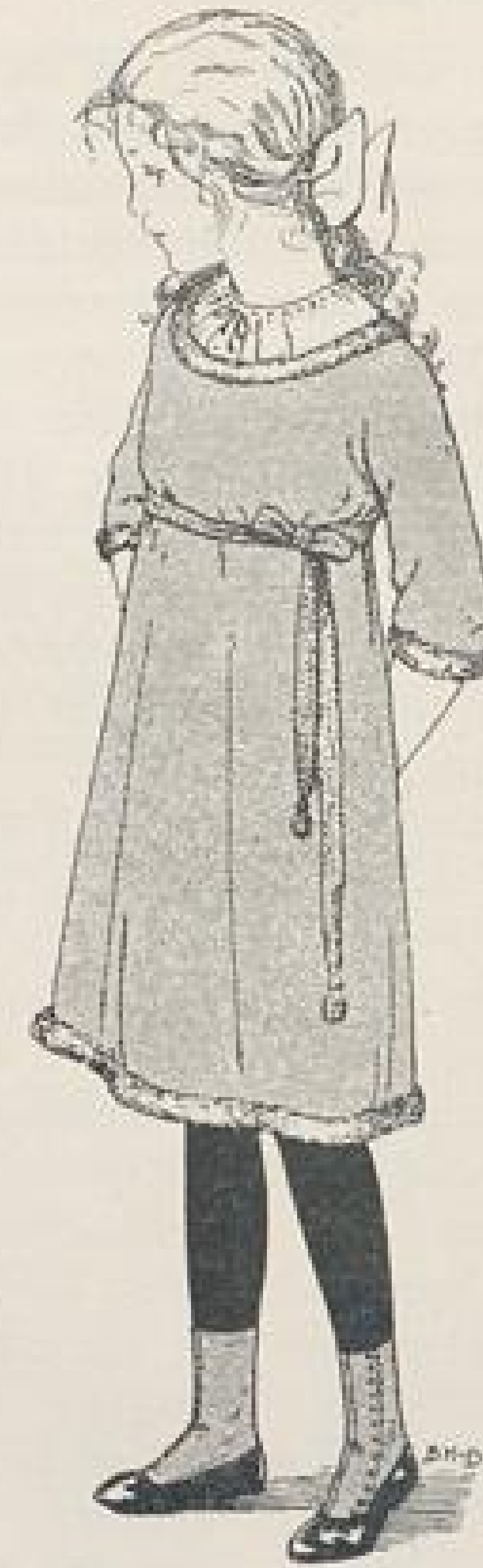
Abb. XII. Tuchkleid für Mädchen. Beschreibung Seite IX u. f.

(Kriegspflichten der Frau im »Hochland«). Und die Reichsorganisation der Hausfrauen Österreichs veröffentlicht in der »Frau« eine Reihe von Kriegsregeln, worin die Unabhängigkeit der deutschen und österreichischen Frau von der Pariser und englischen Mode den ersten Leitsatz bildet. — — —