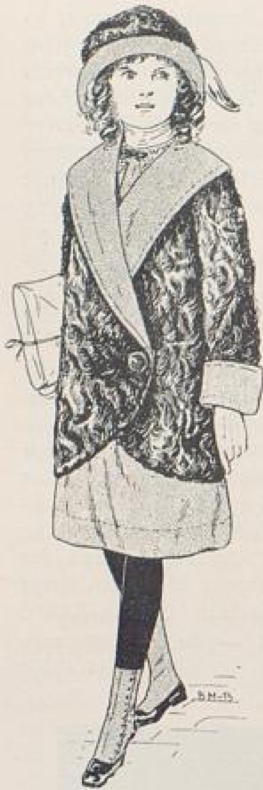
Abb. X. Wintermantel für Mädchen. Beschreibung, Schnittmuster- bogen Nr. 5 und Seite IX u. f.