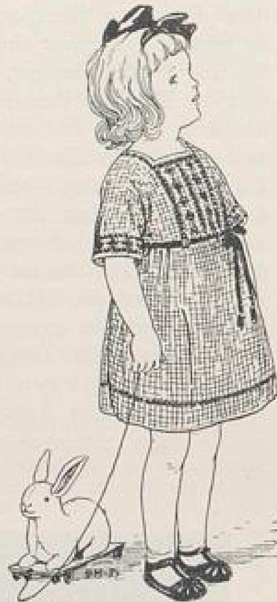
Abb. XI. Flanellkleidchen für kleines Mädchen. Beschreibung Seite IX u. f.