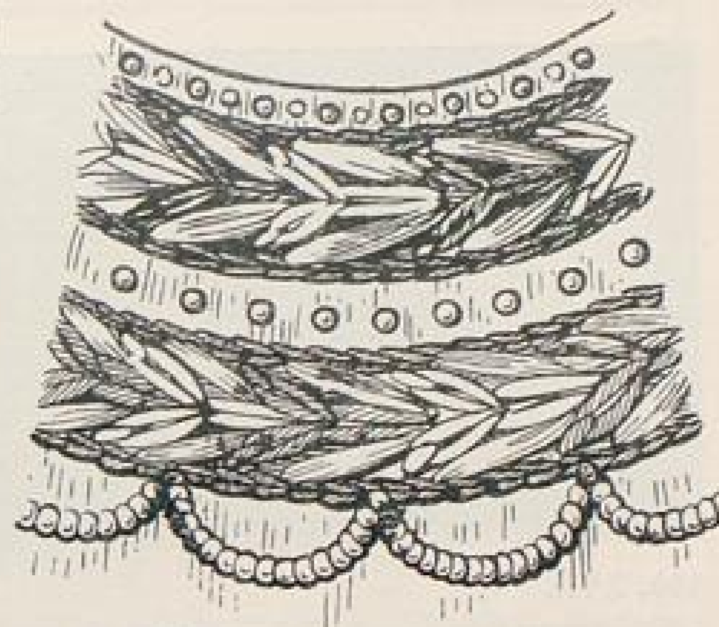
Abb. XVIa. Stickereieinzelheit zur nebenstehenden Bluse.

Crêpe de Chine oder Chinakrepp? Dieses schöne Gewebe wird in Deutschland (laut einer Zuschrift an die Kölnische Zeitung vom 20. März) u. a. in Krefeld, Berlin, Frankfurt, Rheydt und Viersen hergestellt und zwar in einer Qualität, die nicht hinter der besten französischen Ware zurücksteht. Kaufen wir also deutsches Crêpe de Chine. Oder wollen wir nicht lieber deutschen »Chinakrepp« kaufen? Bei dieser Stoffbezeichnung ist eine Übersetzung leicht und jede Verkäuferin wird verstehen, was man will. Bei Stoffnamen dagegen, wie Merveilleuse, Eolienne, Marquissette ist eine Verdeutschung schwerer, obgleich es sich bei diesen Geweben, die dauernd modern bleiben, lohnen würde, deutsche Namen einzuführen. Genau so gut wie beim Seidengewebe Satin, das in Deutschland jedermann Atlas nennt.