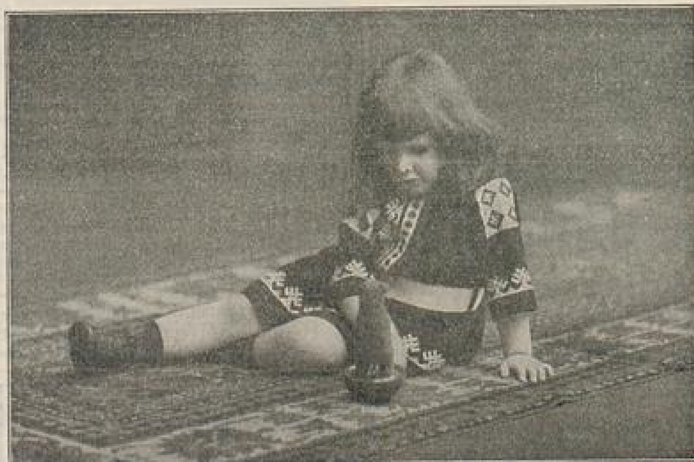
Ausstellung Dresden, Halle 55

Rumänische Seide Auswahlsendungen zu Diensten