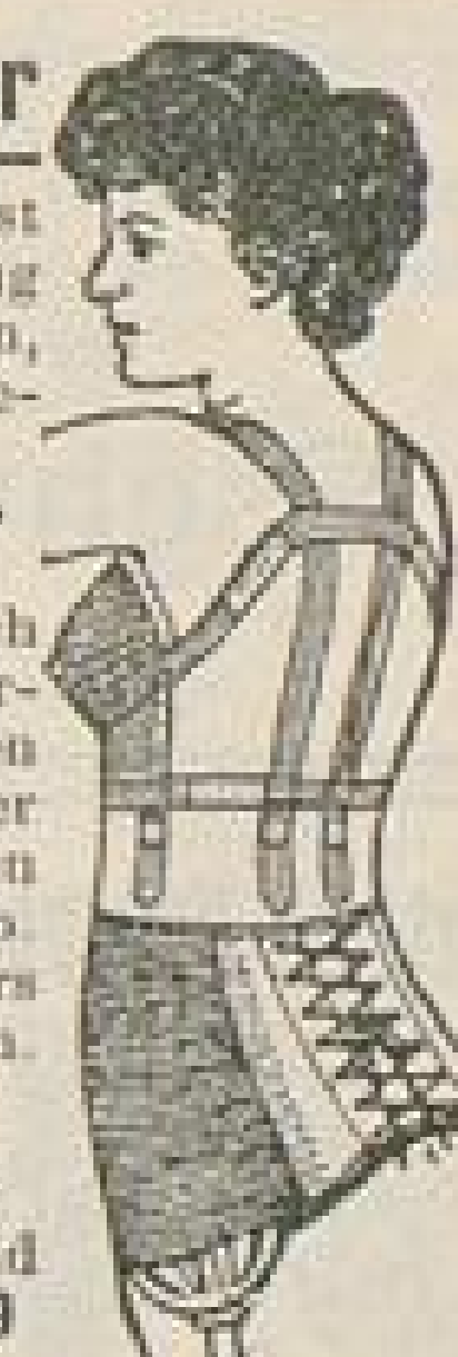
Patentiert im Ehrenkreuz u. gross. gold. Medaille

Fabrik für Bandagen und gesundheitstechnische Artikel.