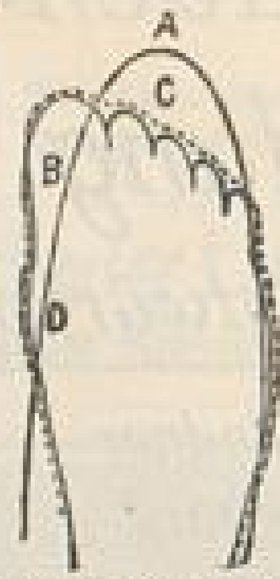
A unnatürliche alte ... naturgemäße Fußspitze