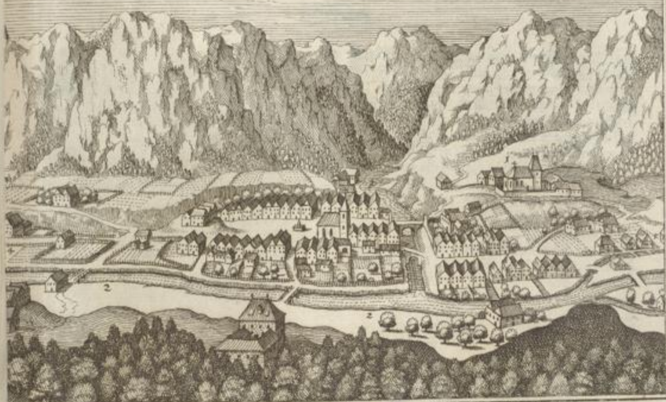
1. Pfarckirch. 2. Gafelents fluß. 3. Grambach. 4. Mauth. 5. Erfenhamer.