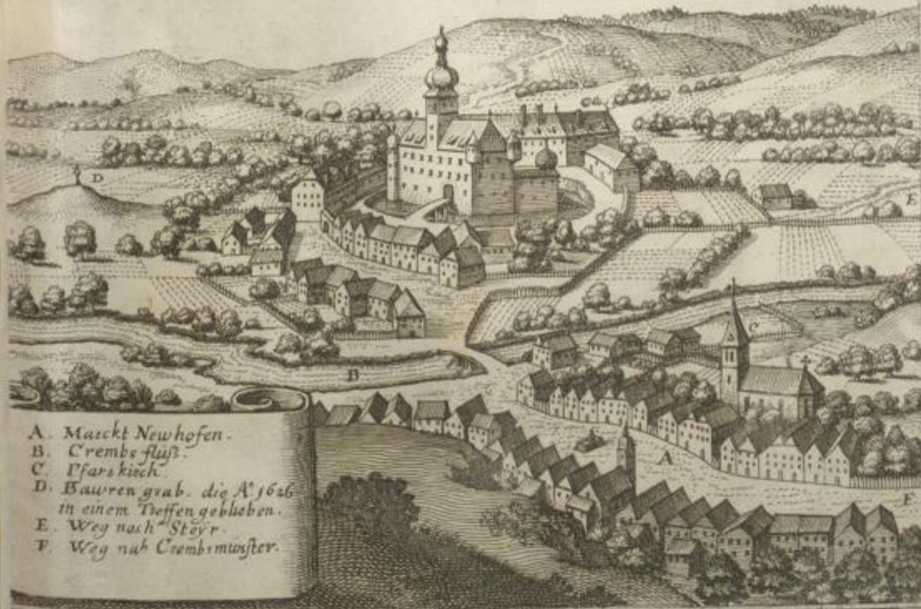
A. Marckt Newhofen. B. Crembs fluß. C. Pfarckirch. D. Bauern grab. die A° 1626. in einem Troffen geblieben. E. Weg nach Stöyr. F. Weg nah Crembsmünster.