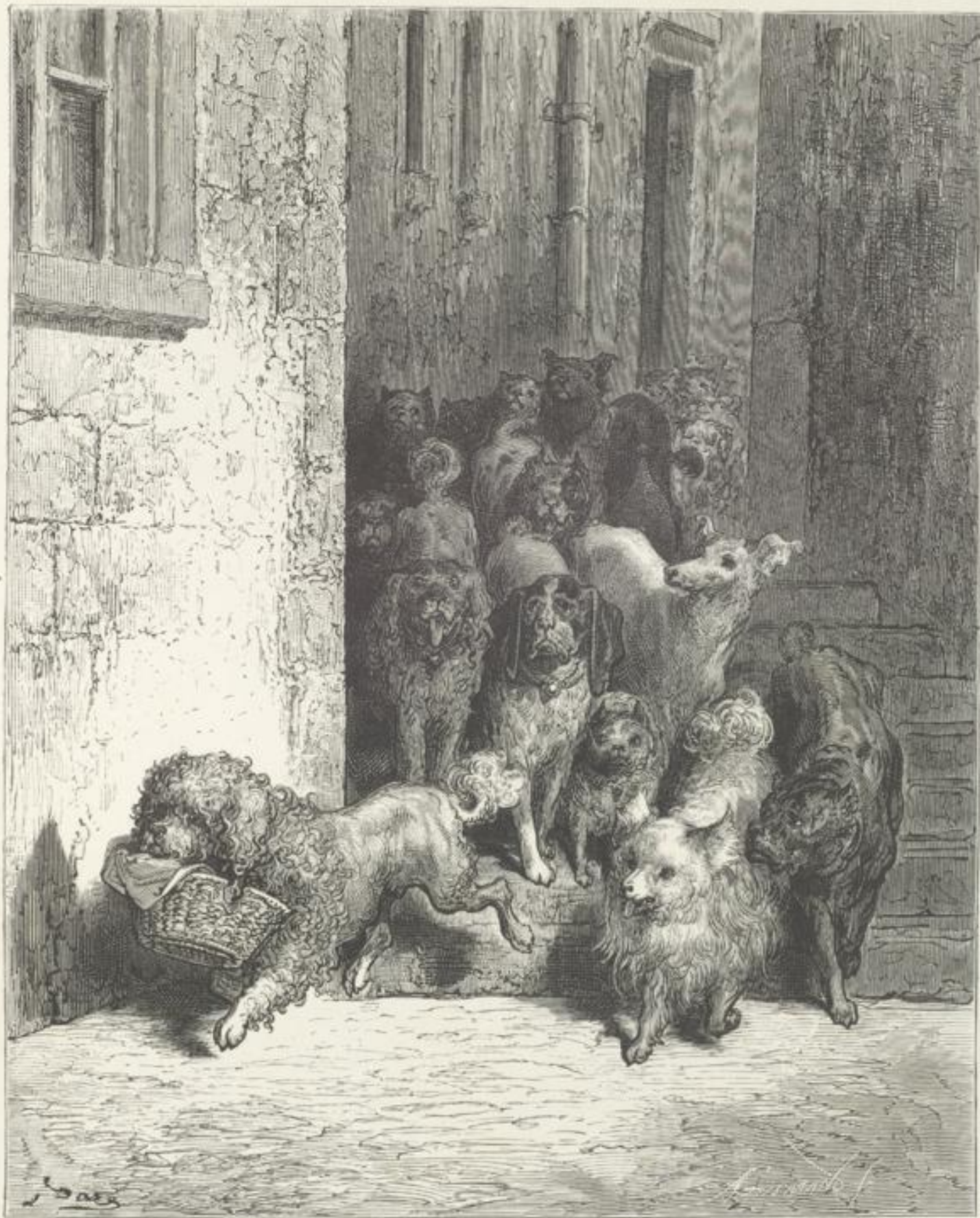
Der Hund, der seines Herrn Mittagbrot am Halse trug.