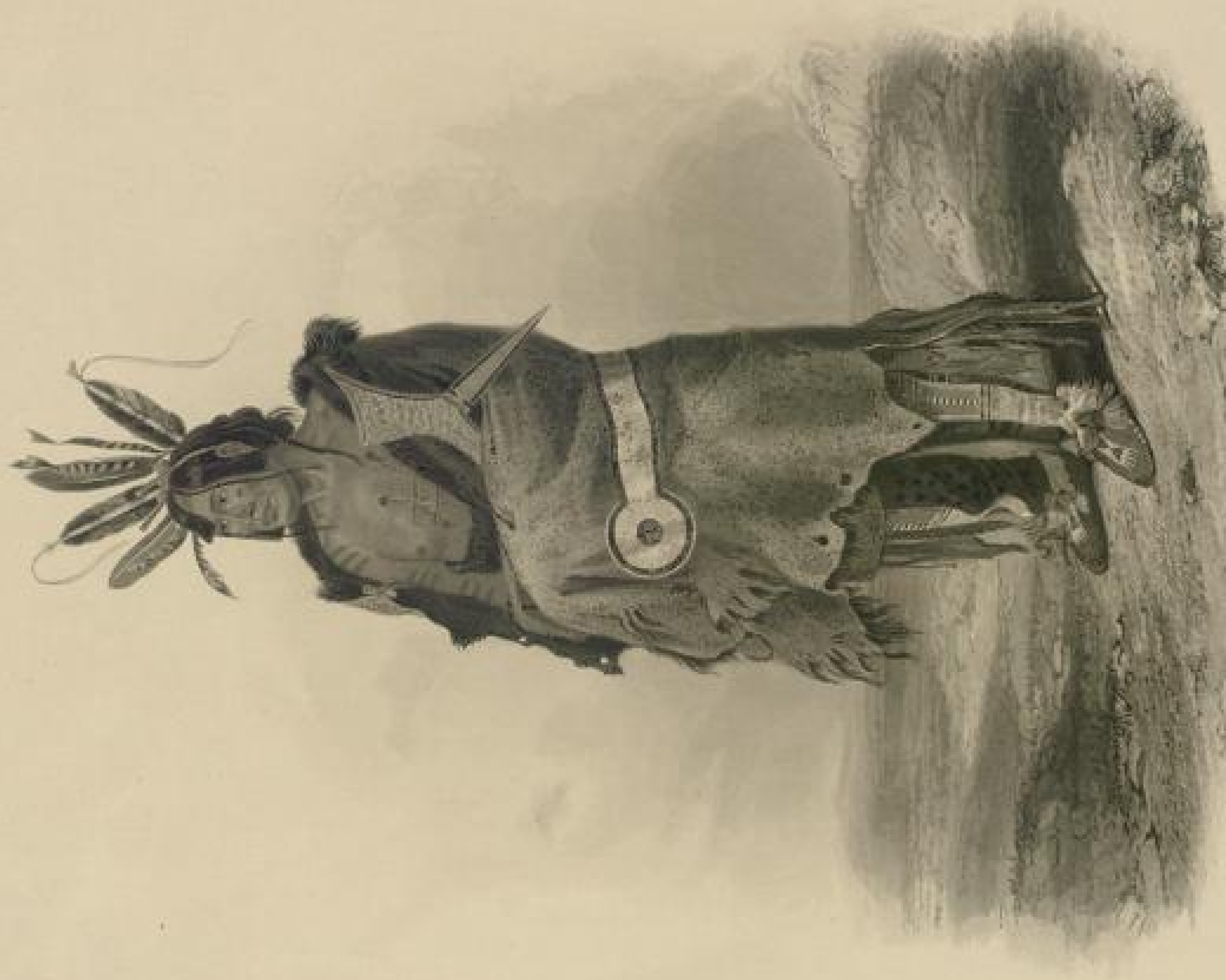
ZACHTŪWA - CHIHÄ. Mullens, Träger in Ardenne - Barren