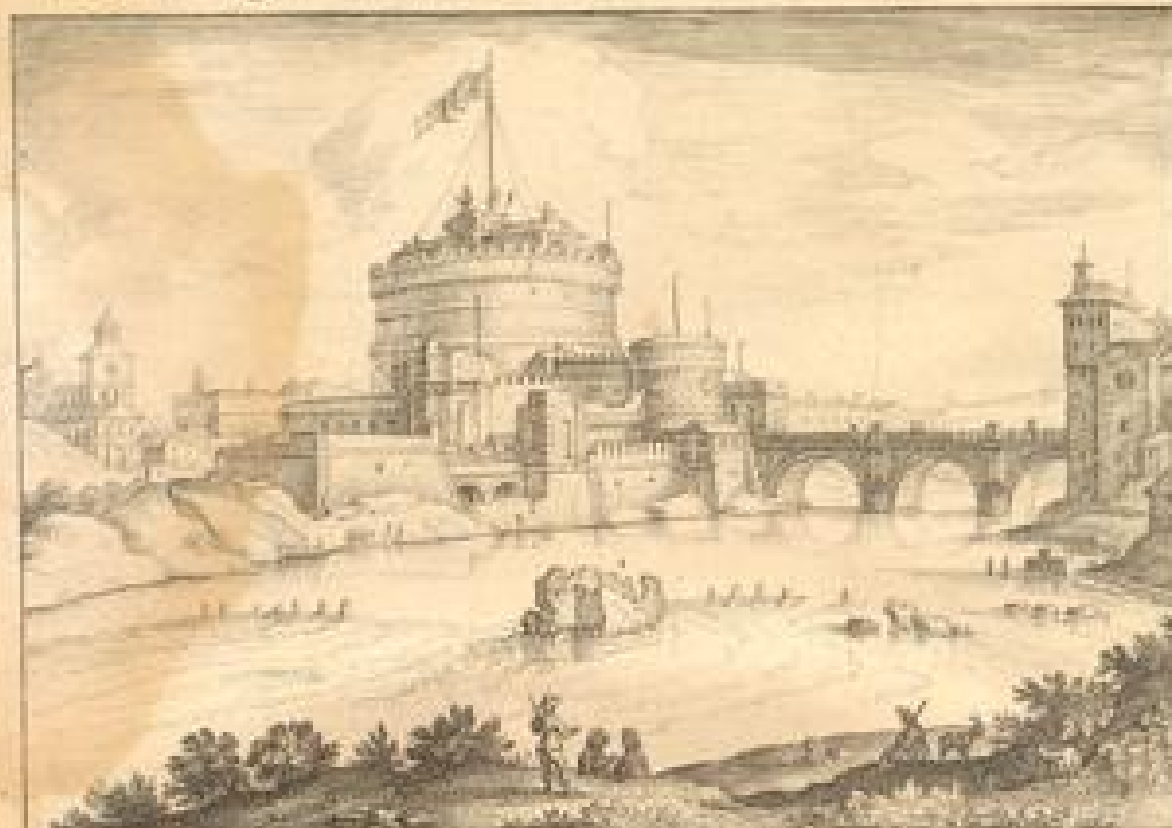
1. Castell S. Angelo. 2. Pons Aemilii. 3. Ruine Pons. Triumphalis.