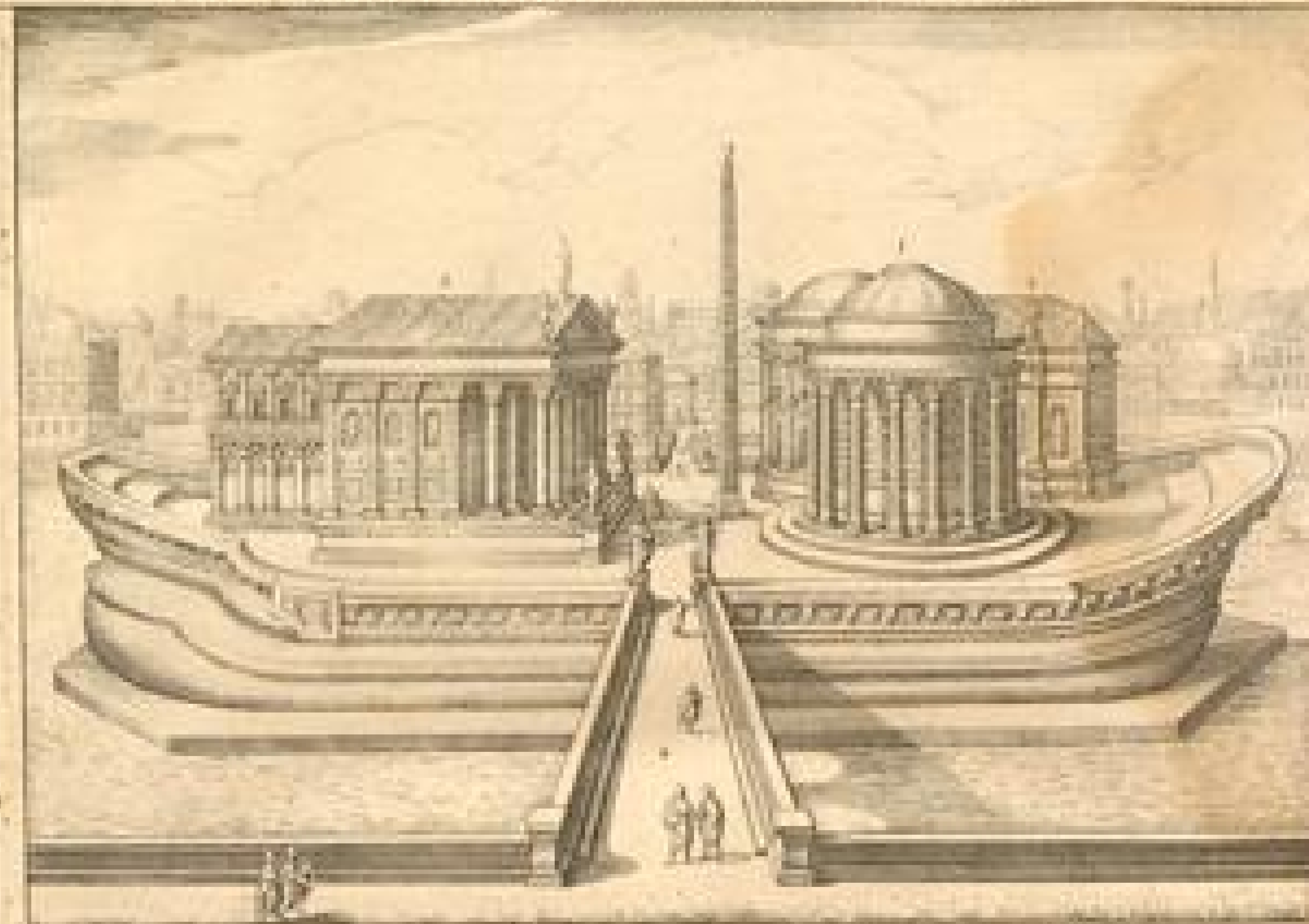
5. Basilica Trajani wie sie vor Altere gewesen. 1. Templum Iovis Olympici. 2. Templ. Aesculapii. 3. Templ. Faustae. 4. Pons Antoninus. 5. Pons quatuor Capitan.