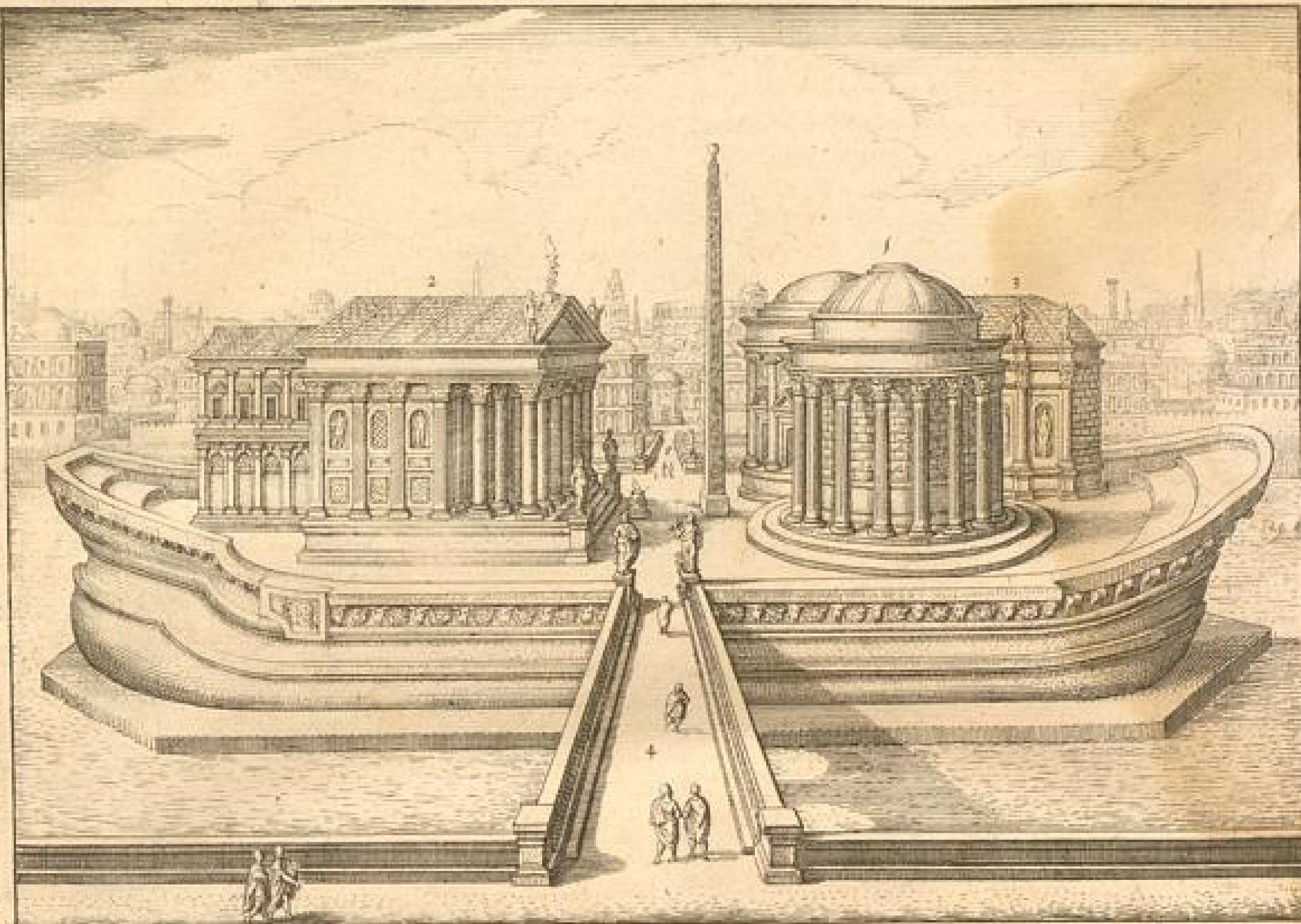
1. Arcus Septimii Severi. 2. Templum Iouis Statoris. 3. Capitulum.

5. Bartolomei Inful wie sic vor Alters gewesen. 1. Templum Iouis Lycaon: 2. Templ. Aesculapij. 3. Templ. Fauni. 4. Pons Senatorius. 5. Pons quatuor Capitem.