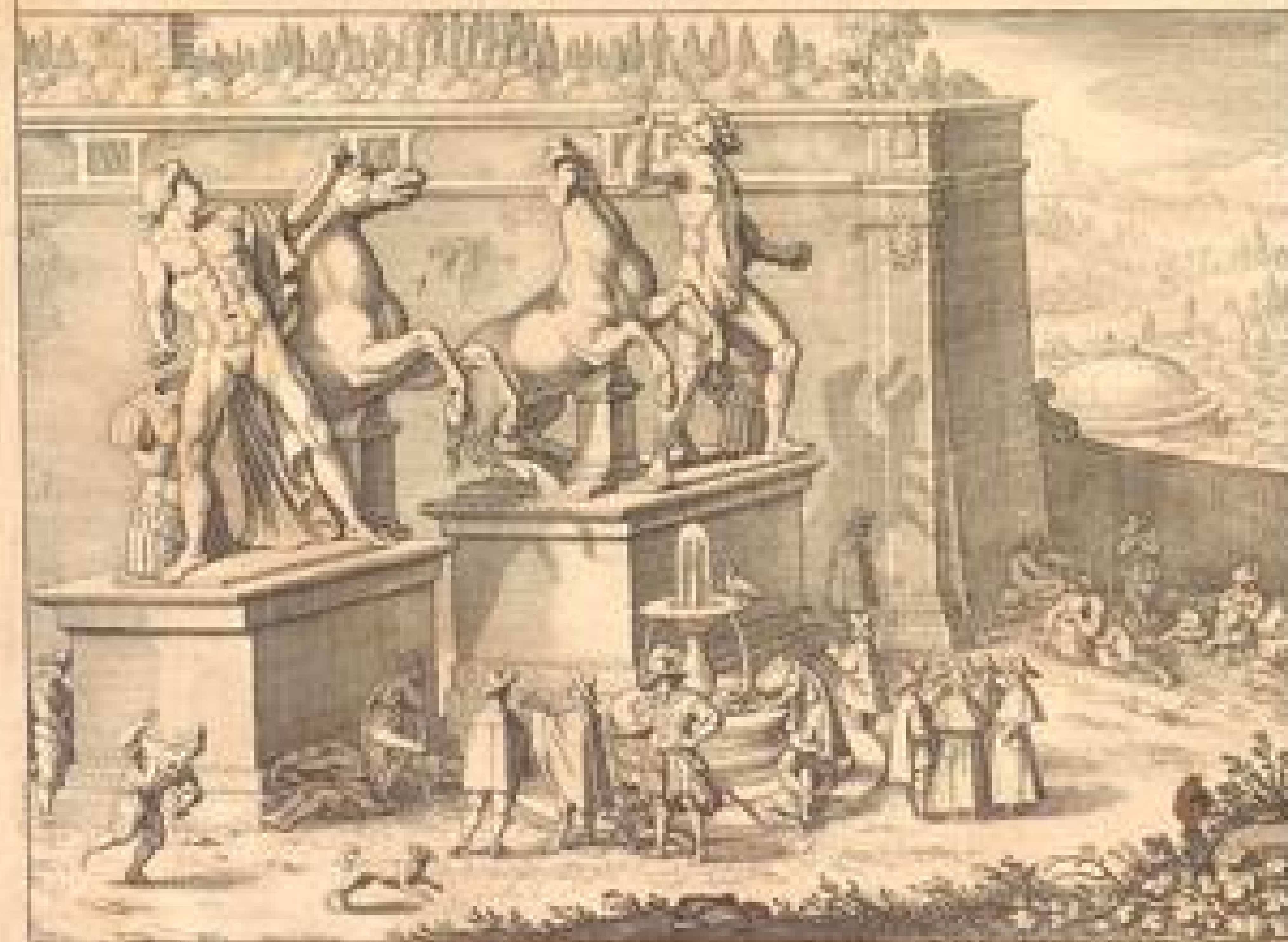
1. Zwei Marmorene Pferde auf dem Berg. Quirinali. 2. S. Maria Rotunda.