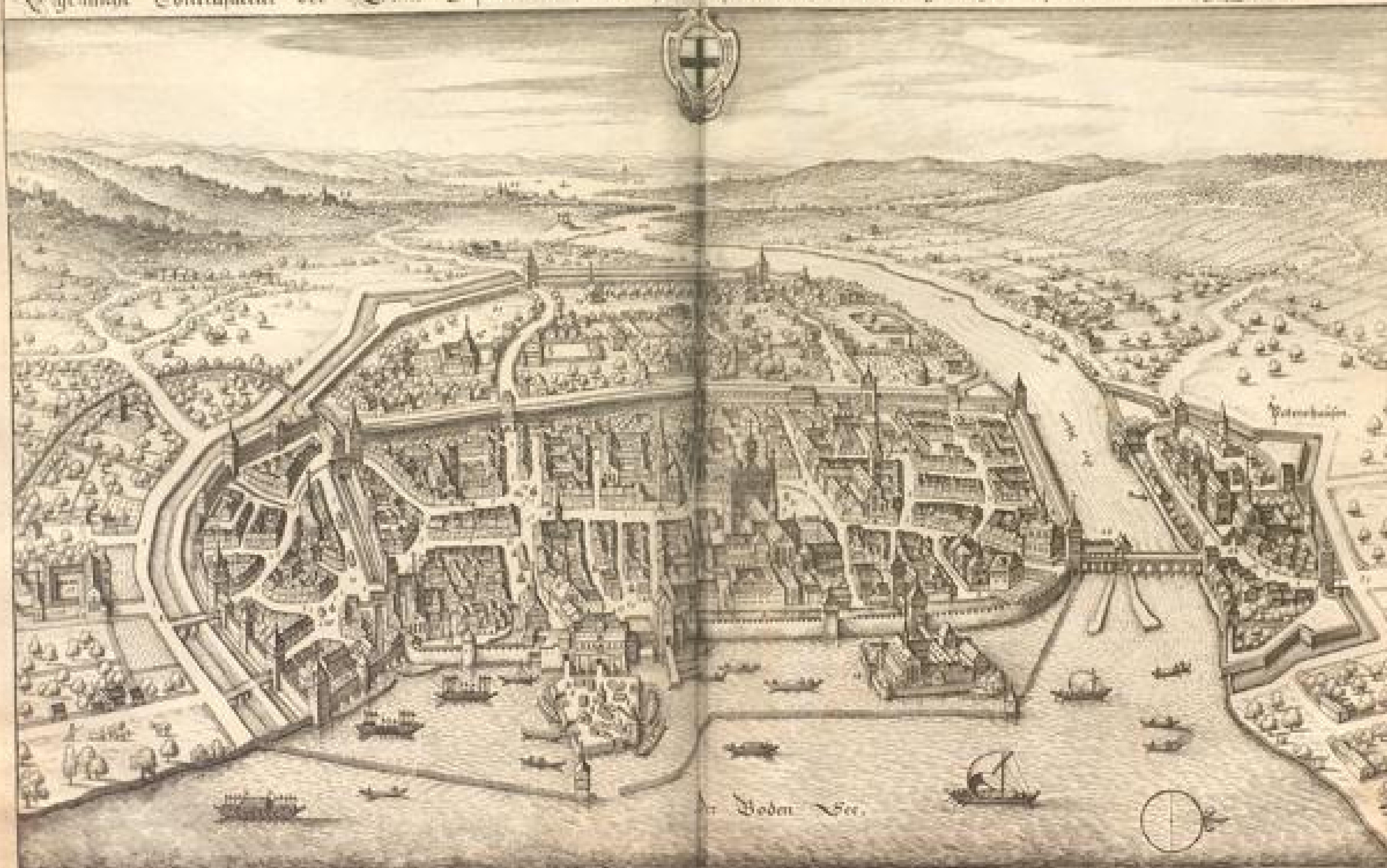
Eigentliche Contrafactur der Stadt Costantz am Bodensee = solche währender Belägerung Anno 1633. im wesen gestanden.