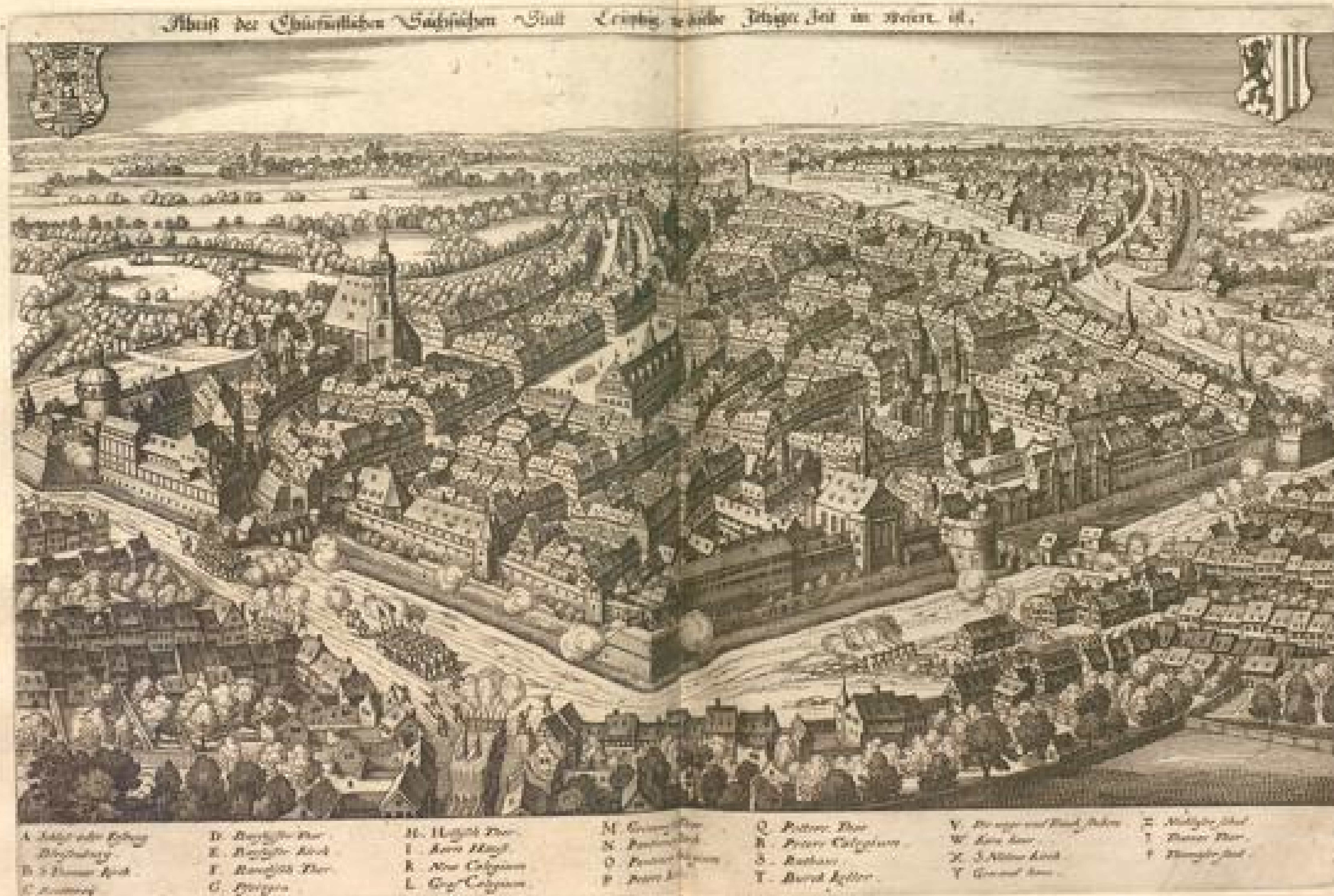
Abriß der Chrißlichen Sächſiſchen Stadt Leipzig welche 1709 Zeit im Meert ist.