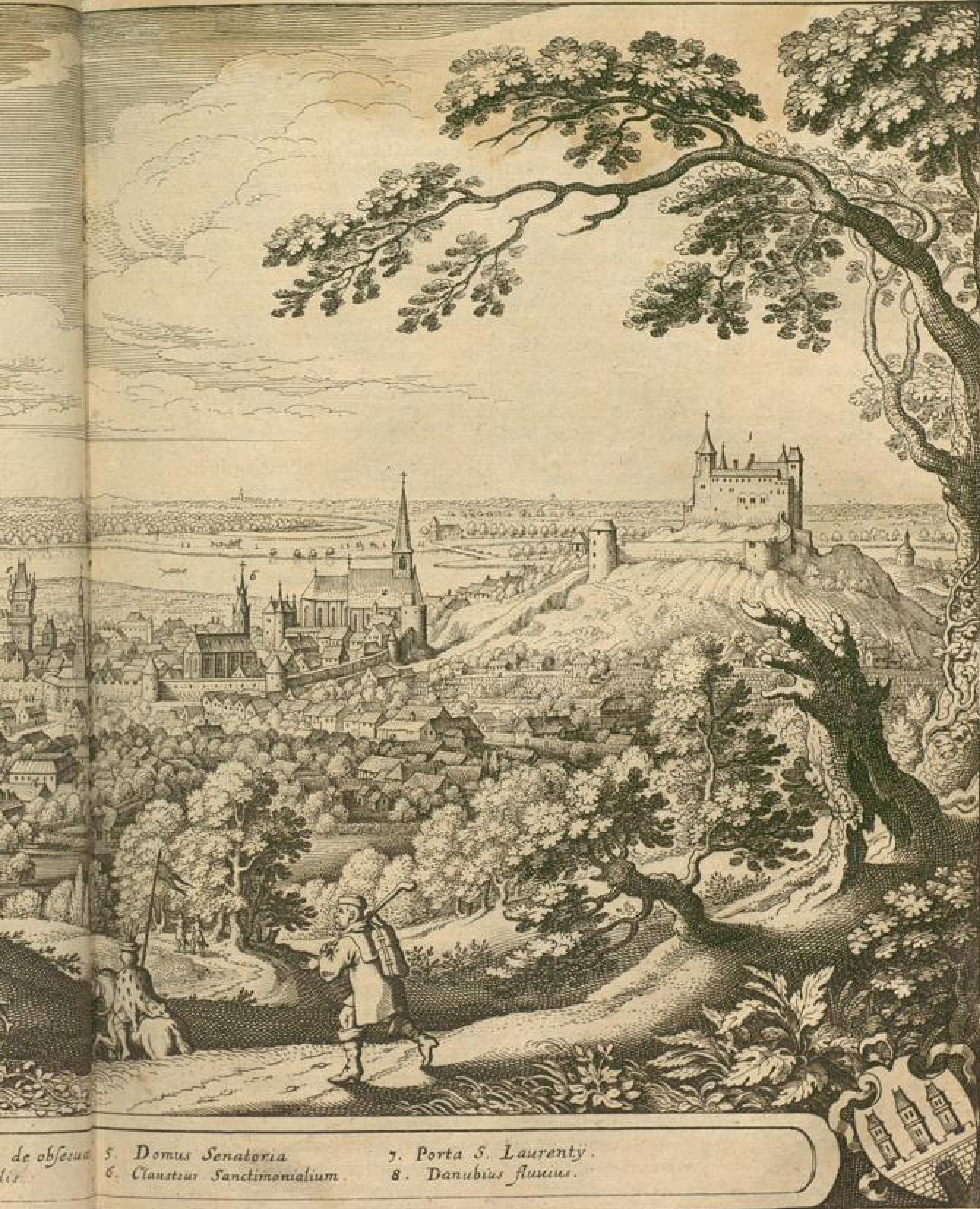
de obsecu 5. Domus Senatoria 6. Claustur Sanctimonialium 7. Porta S. Laurenty 8. Danubius fluvius