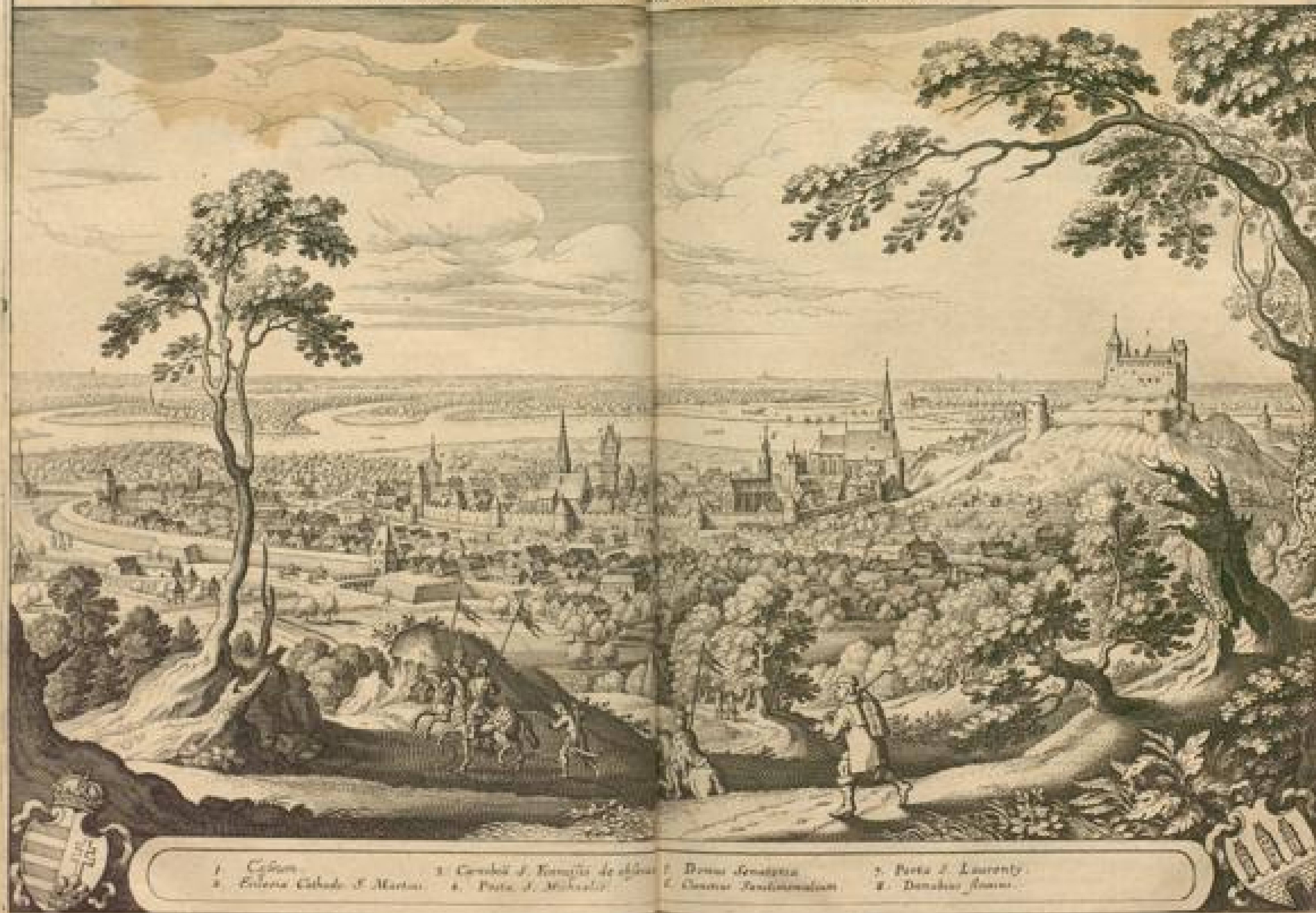
1. Castellum 3. Curia S. Klementis de obliquo 5. Domus Senatus 7. Porta S. Laurentii 2. Ecclesia Cathed. S. Martini 4. Porta S. Michaelis 6. Curia Rationum 8. Danubius fluvius