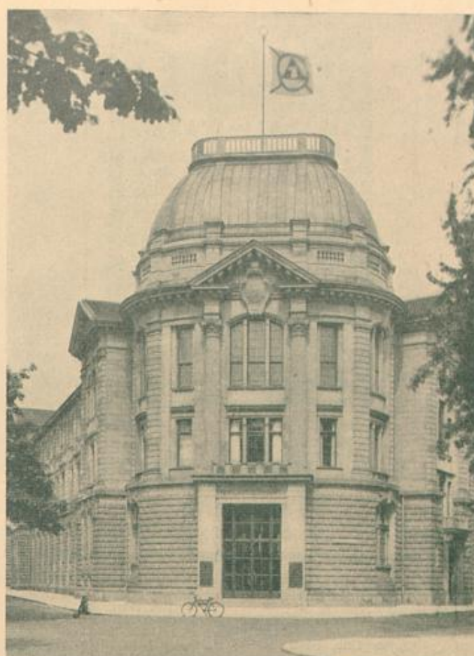
Karlsruher Lebensversicherung A.-G. Ursprung 1835 Kaiserallee 4 — Fernruf 5300—5306