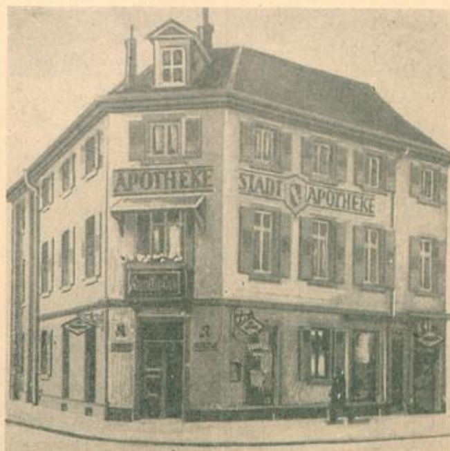
Stadt-Apothek H. Trumpfsheller

geb. 1786, gest. 1818 Begrabt an der Stephanienst. bei der Mühle und sieht sich in süd- licher Richtung bis Stadttell Beiertheim