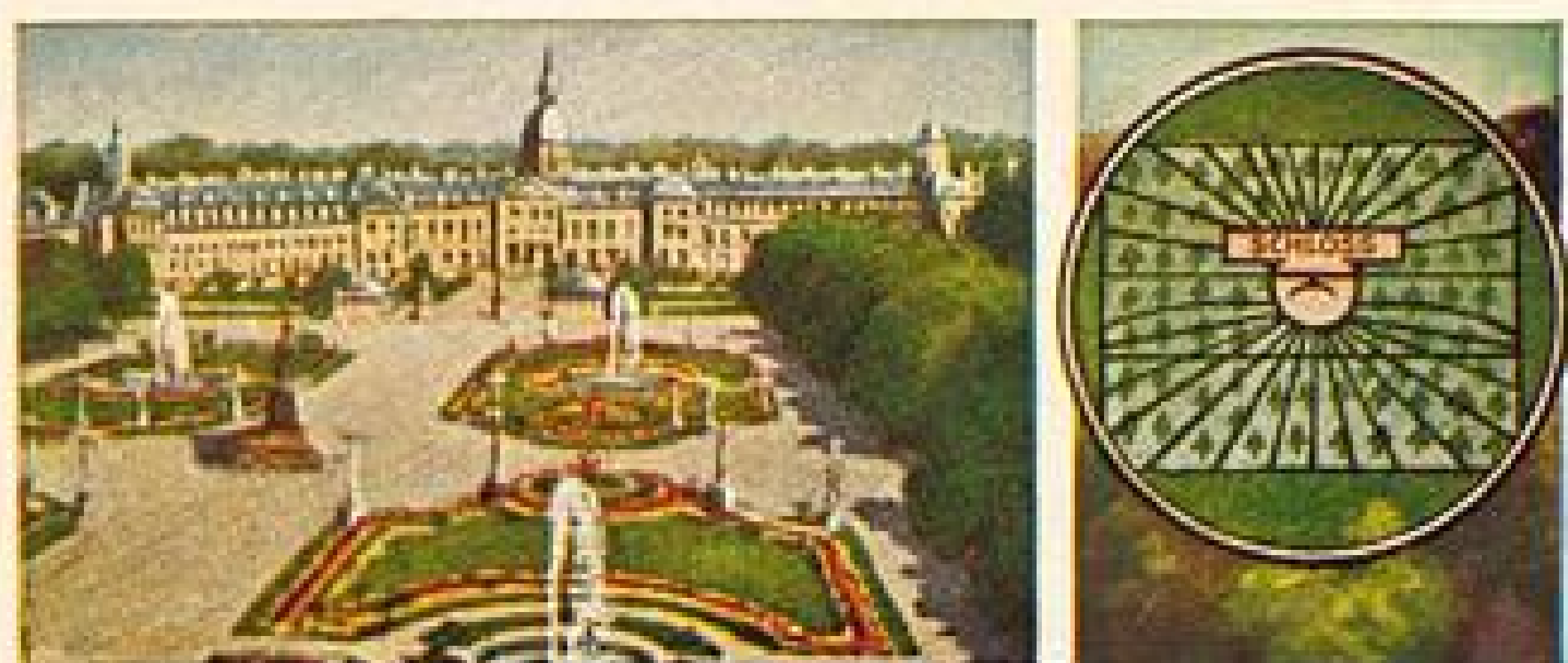
STOLWERCK SCHOKOLADE BILD 19