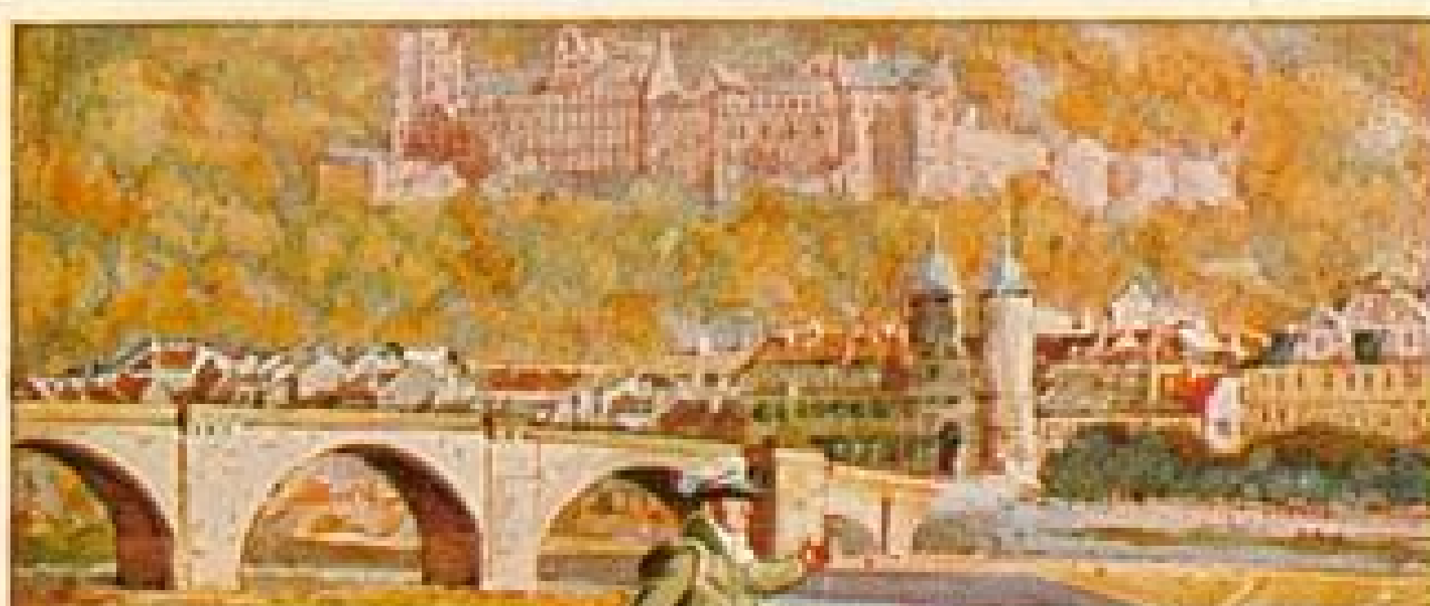
STOLWERCK SCHOKOLADE BILD 24