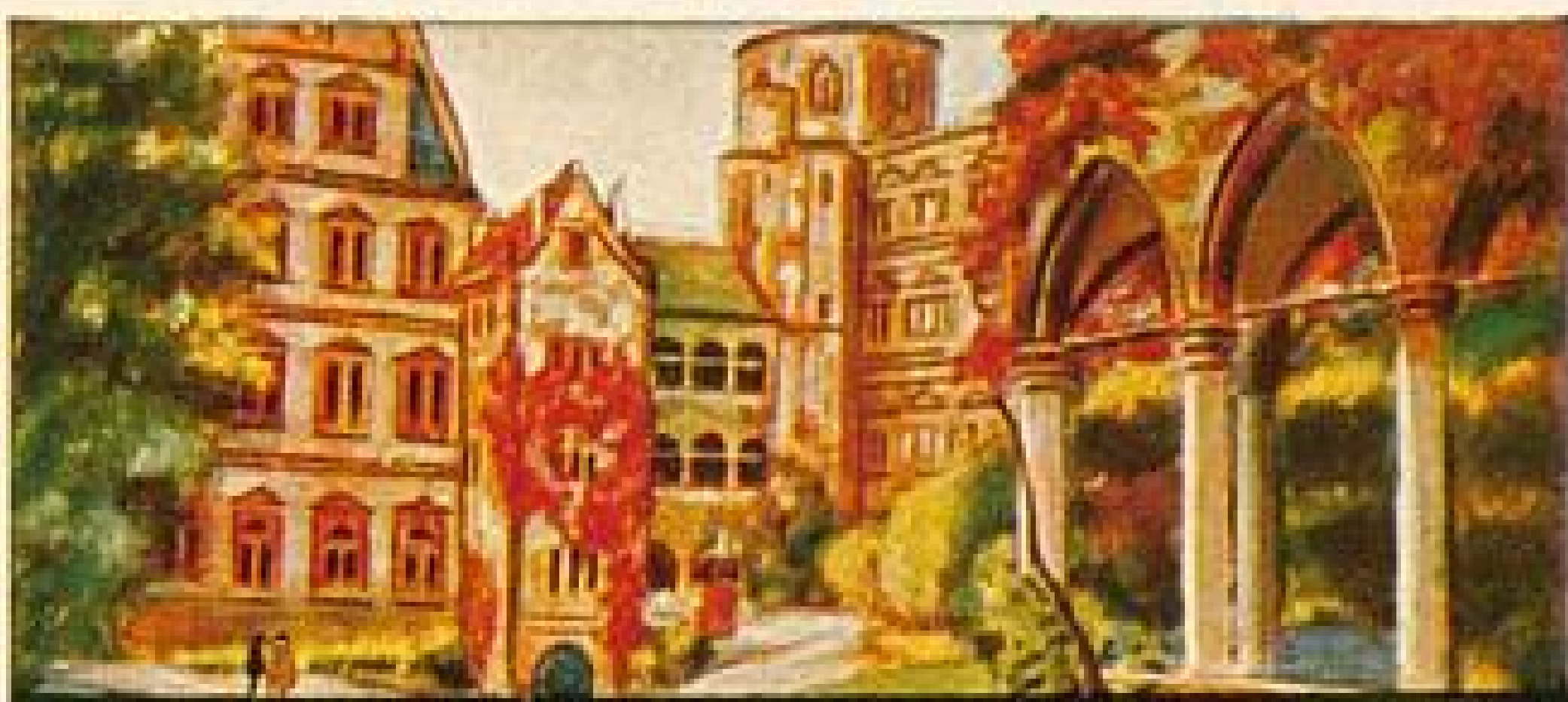
STOLWERCK SCHOKOLADE BILD 23