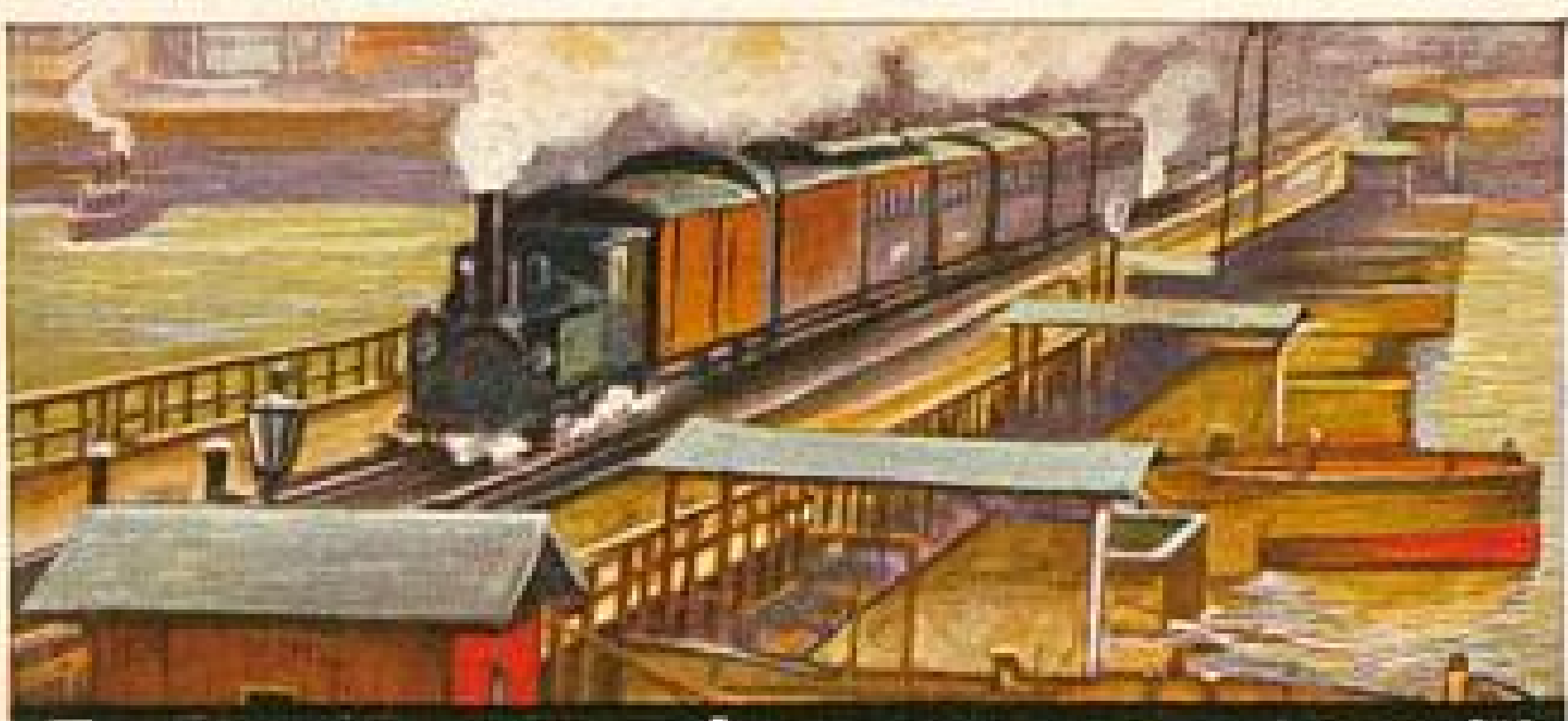
STOLWERCK SCHOKOLADE BILD 20

Die Hauptstadt Badens, Karlsruhe, Bild 19, ist eine vom Markgrafen Karl Wilhelm in der ersten Hälfte des 18. Jahrhunderts mit Zirkel und mit Lineal regelmäßig angelegte Fächerstadt. Ihr Hafenplatz ist das am rechten Rheinufer gelegene, kleine Marau, mit seiner interessanten Schiffsbrücke, Bild 20. Am linken Rheinufer grüßt uns auf unserer Rheinfahrt die alte Kaiserstadt Speyer, Bild 21. Wir verlassen für kurze Zeit die Rheinebene, um ein Juwel deutscher Städte zu schauen: Heidelberg, Bild 24. Sein Schloß, 1610 nach mehr als 300 jähriger Bauzeit fertiggestellt, wurde 1689 und 1693 durch die französischen Generale Melac und de Lorge verwüstet, aber seine Bauten, nach Friedrich, Ruprecht, Otto-Heinrich genannt, sind selbst in ihren Trümmern noch prächtige Bauwerke!