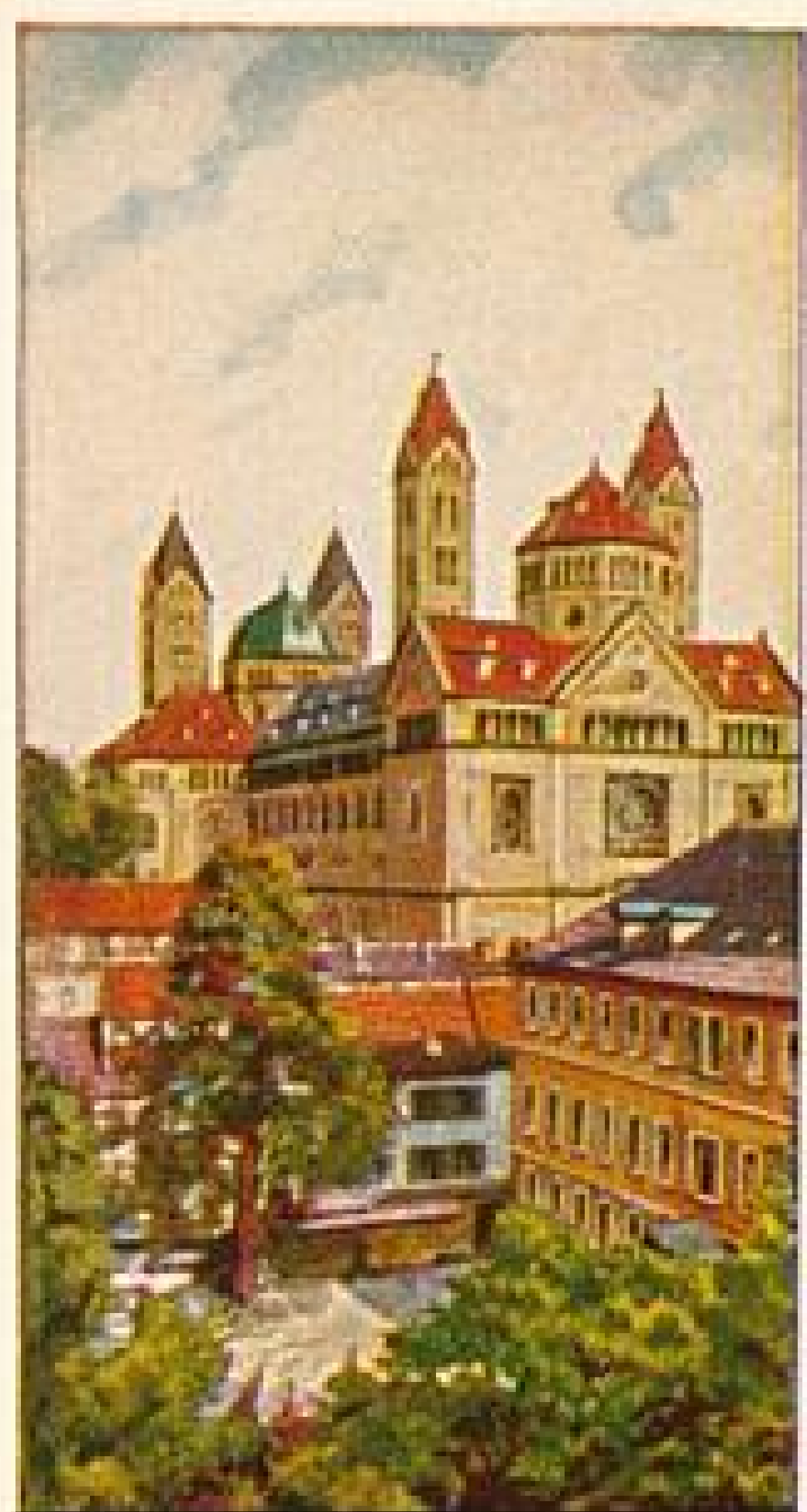
STOLWERCK SCHOKOLADE BILD 21