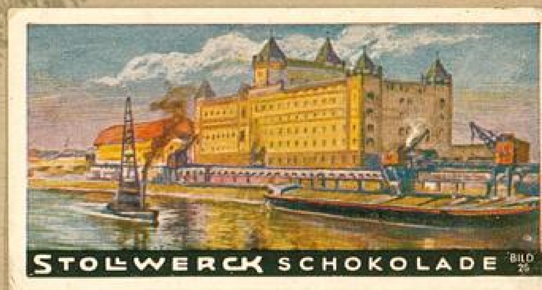
STOLWERCK SCHOKOLADE BILD 26