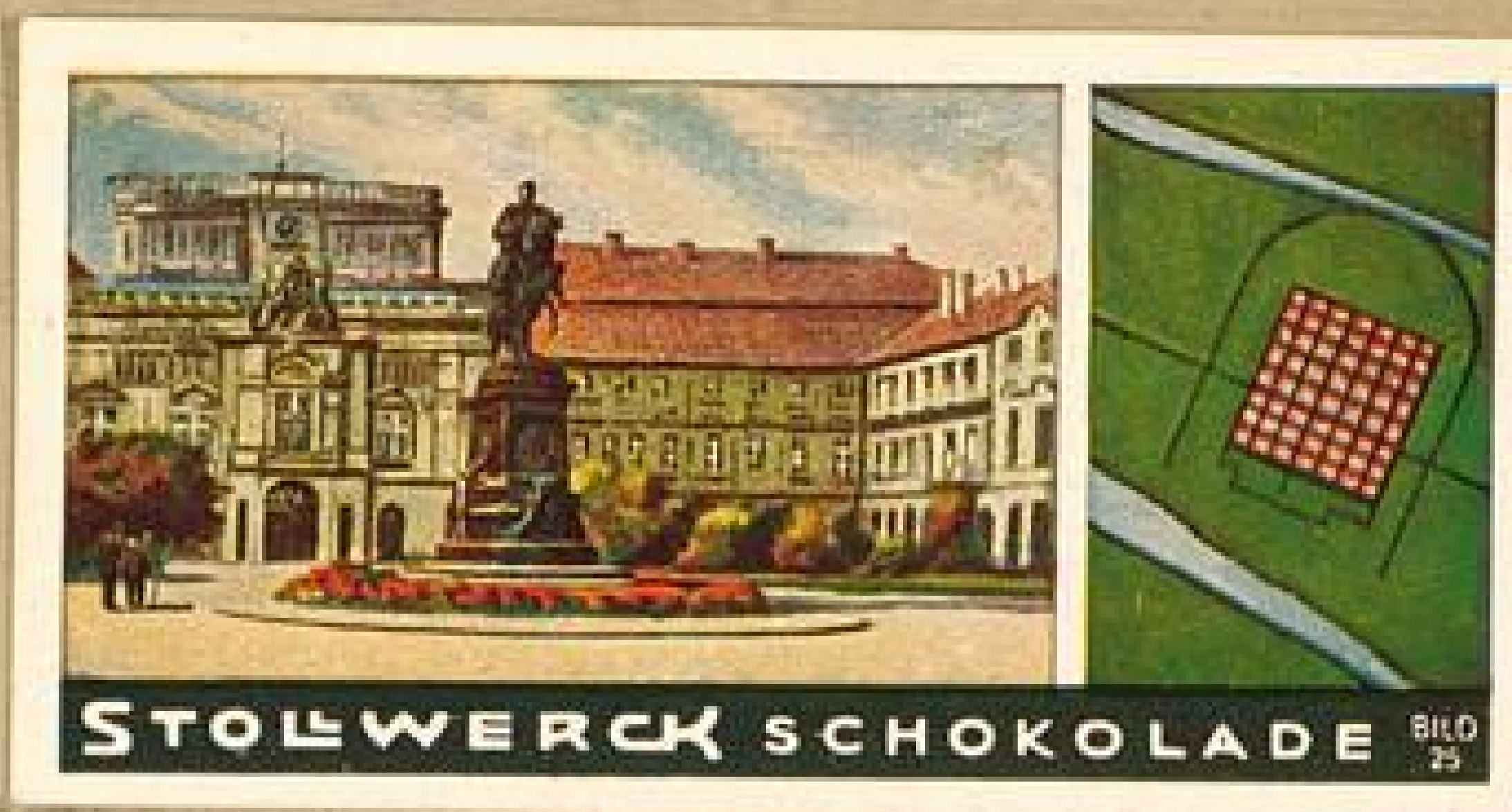
STOLWERCK SCHOKOLADE BILD 25

F st Karlsruhe ein Fächer, dann ist Mannheim, Bilder 25, 29, ein Schachbrett. Die Straßen kreuzen sich rechtwinklig und sind mit Buchstaben und Ziffern bezeichnet. Nach der Rheinseite zu, vom Strom durch den Schloßgarten getrennt, liegt das großherzogliche Schloß, ein mächtiges, eindrucksvolles Bauwerk. Die Lage Mannheims in dem Winkel zwischen der Neckarmündung und dem Rhein hat es zu einer der wichtigsten Industriestädte Süddeutschlands und zu einem der größten Binnenschiffahrtshäfen unseres Vaterlandes werden lassen. Gewaltige Speicher u. Fabrikanlagen, Bilder 26, 27, erheben sich an den Ladekais. Mannheim gegenüber liegt Ludwigshafen, noch 1840 ein Ort von 90 Einwohnern, heute eine Großstadt, durch eine Brücke, Bild 28, mit Mannheim verbunden.