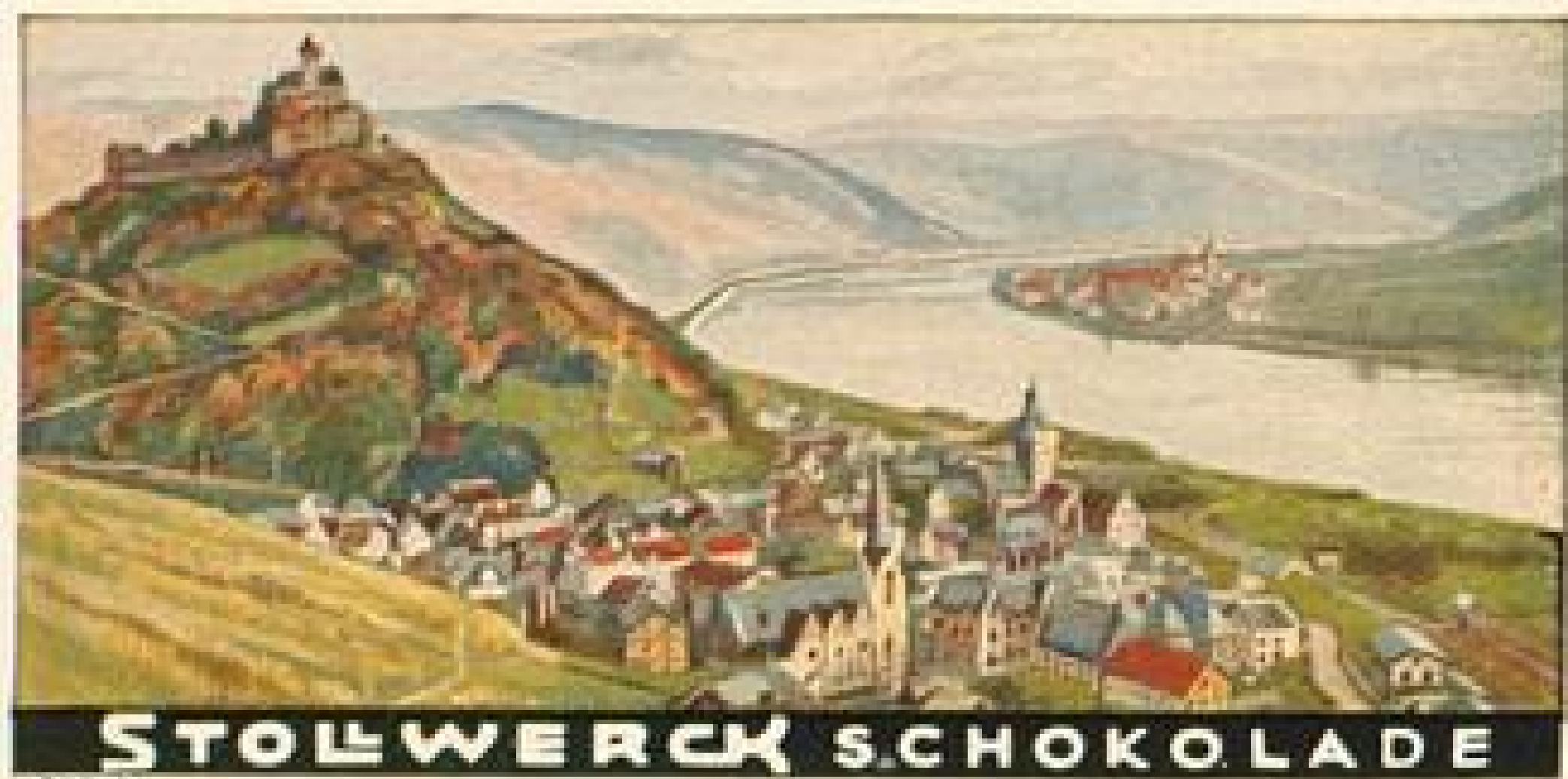
STOLWERCK SCHOKOLADE BILD 96

W ir haben schon soviel von der Schönheit des Lahntales gehört, daß wir auf kurze Zeit den Rhein verlassen. Wir schauen noch einmal zurück auf das liebe Braubach mit der Marksburg, Bild 96, wandern durch Oberlahnstein, Bild 97, und unternehmen einen Ausflug nach Burg Lahneck, Bild 98, um von dort aus den herrlichen Blick auf Niederlahnstein und seine Johanneskirche, Bild 99, zu genießen. Nun wandern wir der Lahn entgegen und erreichen den weltberühmten Badeort Ems, Bild 100, wo einst Kaiser Wilhelm I. seinen Kränchenbrunnen trank. Das Kurhaus von Ems war es, auf dessen Promenaden 1870 die historische Begegnung des Kaisers mit dem französischen Botschafter stattfand. Wir wandern weiter lahnauflwärts nach dem romantischen Diez, Bild 101, und beenden unseren Ausflug ins Lahnggebiet in Kunkel, Bild 102, dessen Felsenufer eine trutzige, malerische Burg trägt.