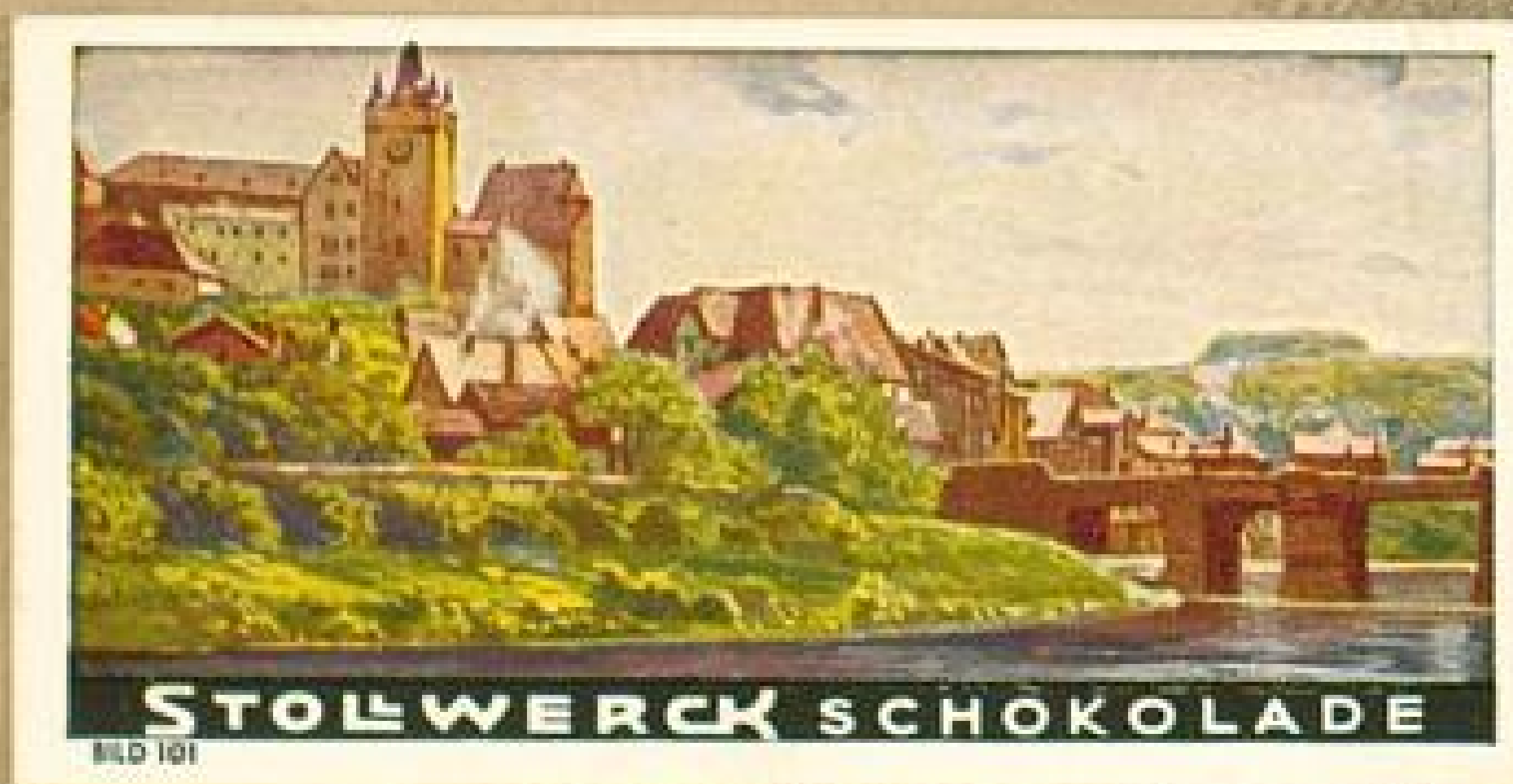
STOLWERCK SCHOKOLADE BILD 101