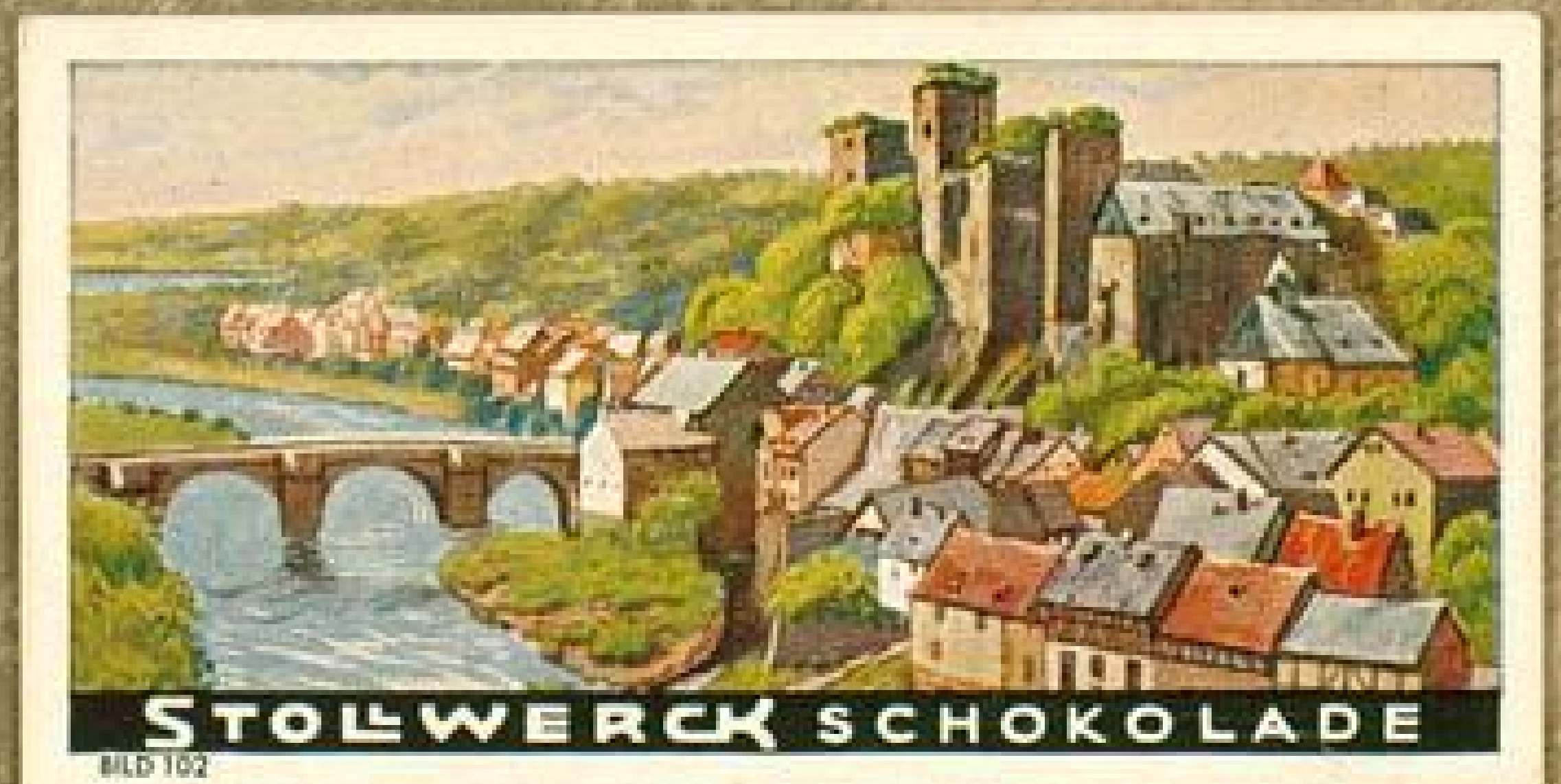
STOLWERCK SCHOKOLADE BILD 102