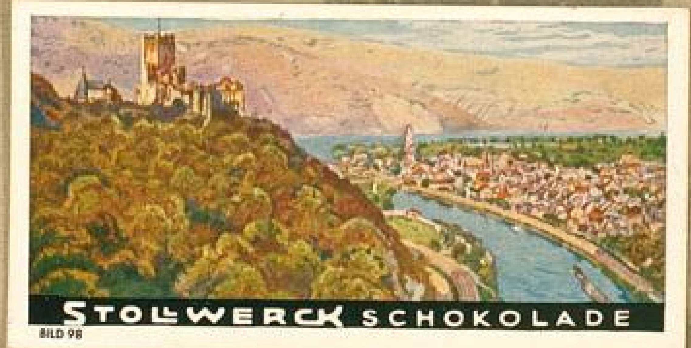
STOLWERCK SCHOKOLADE BILD 98