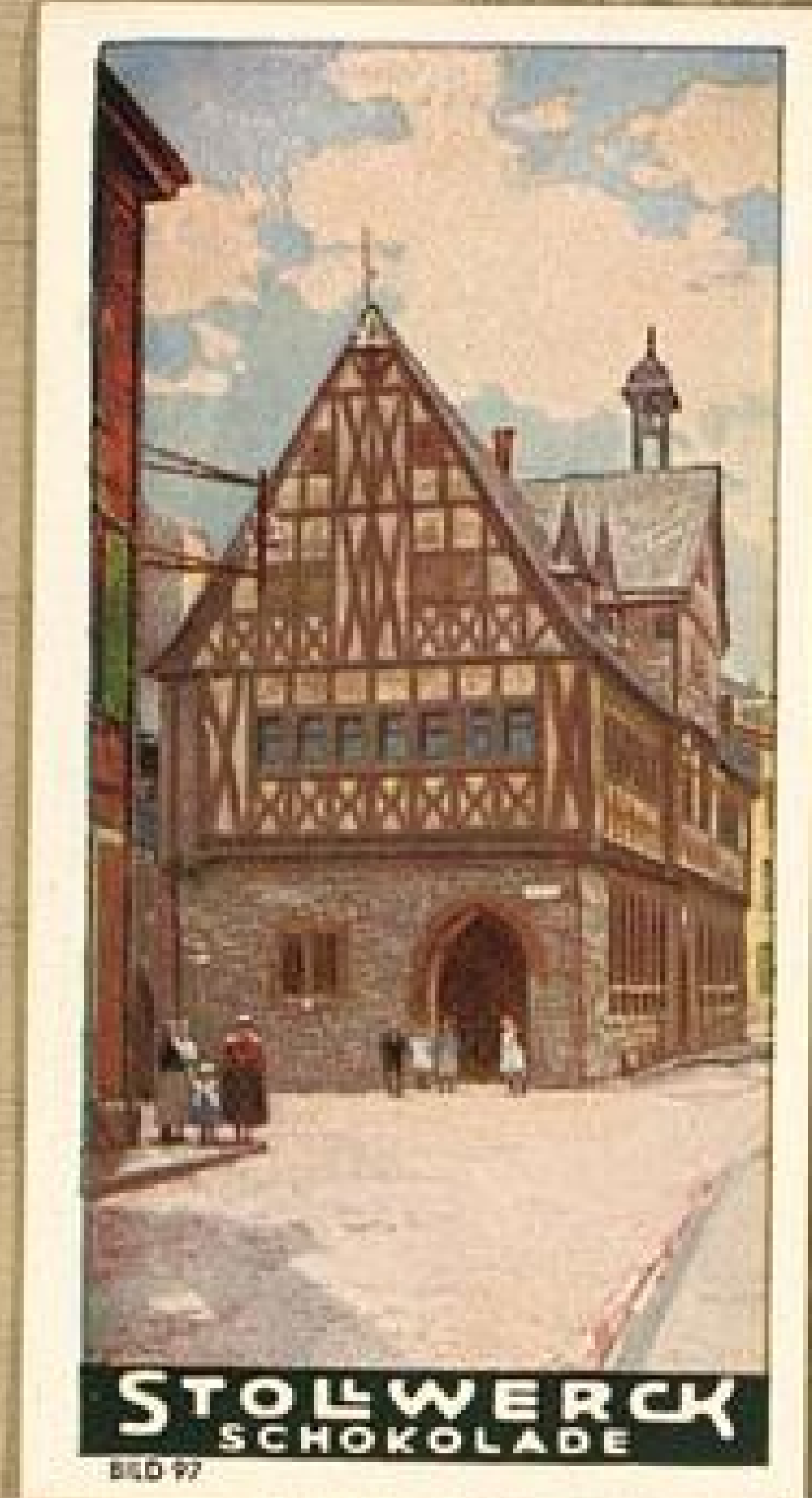
STOLWERCK SCHOKOLADE BILD 97

W ir haben schon soviel von der Schönheit des Lahntales gehört, daß wir auf kurze Zeit den Rhein verlassen. Wir schauen noch einmal zurück auf das liebe Braubach mit der Marksburg, Bild 96, wandern durch Oberlahnstein, Bild 97, und unternehmen einen Ausflug nach Burg Lahneck, Bild 98, um von dort aus den herrlichen Blick auf Niederlahnstein und seine Johanneskirche, Bild 99, zu genießen. Nun wandern wir der Lahn entgegen und erreichen den weltberühmten Badeort Ems, Bild 100, wo einst Kaiser Wilhelm I. seinen Kränchenbrunnen trank. Das Kurhaus von Ems war es, auf dessen Promenaden 1870 die historische Begegnung des Kaisers mit dem französischen Botschafter stattfand. Wir wandern weiter lahnauflwärts nach dem romantischen Diez, Bild 101, und beenden unseren Ausflug ins Lahnggebiet in Kunkel, Bild 102, dessen Felsenufer eine trutzige, malerische Burg trägt.