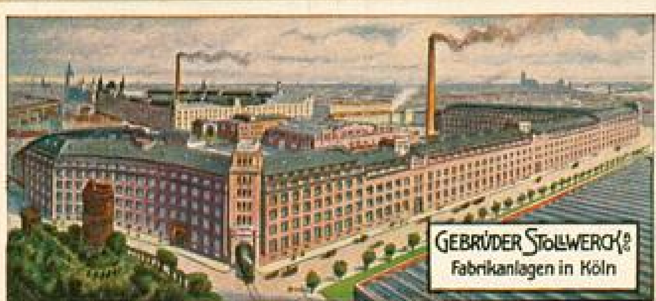
GEBRÜDER STOLLWERCK Fabrikanlagen in Köln