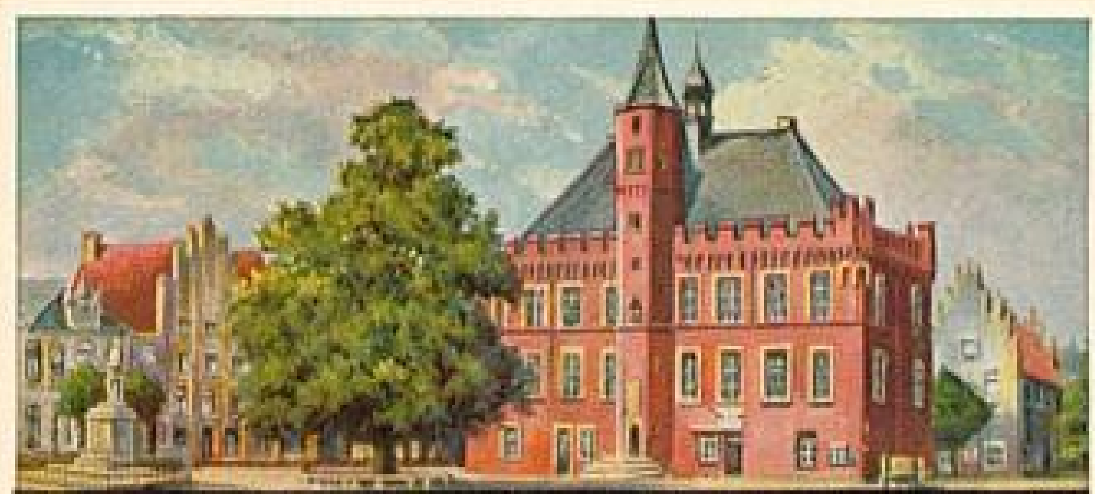
STOLWERCK SCHOKOLADE BILD 176