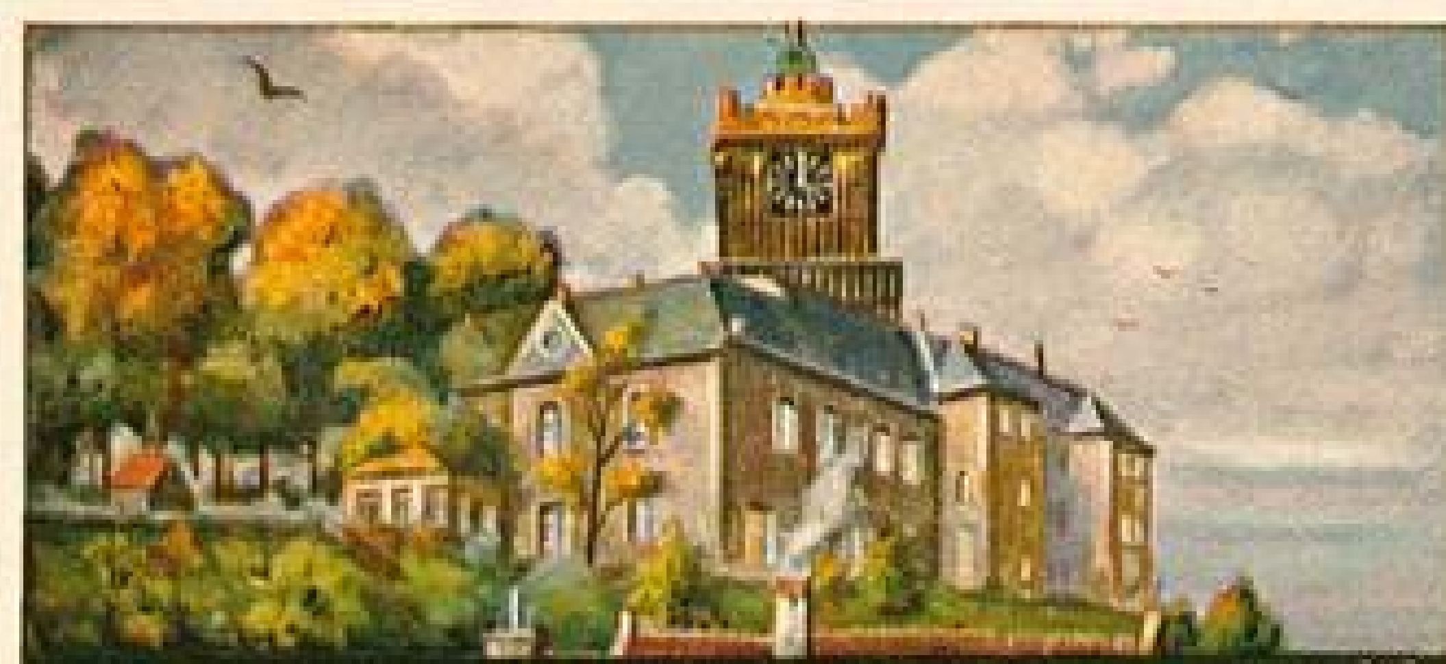
STOLWERCK SCHOKOLADE BILD 179