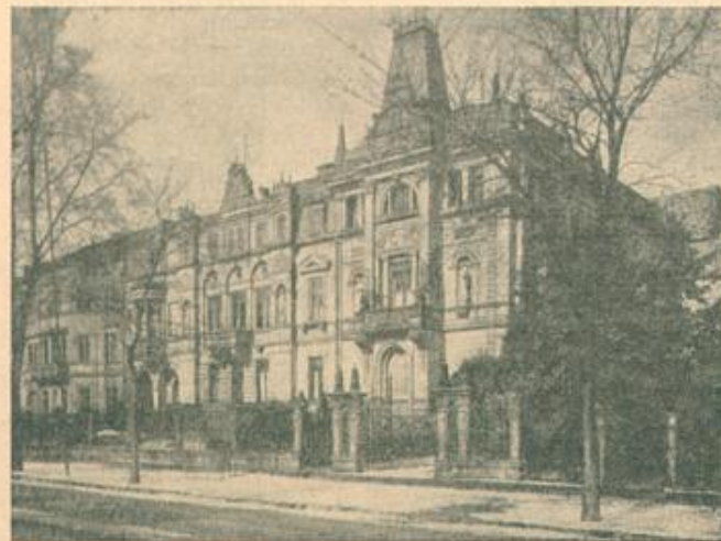
Staatl. Hochschule für Musik Kriegsstraße 166 168, Fernruf 2432