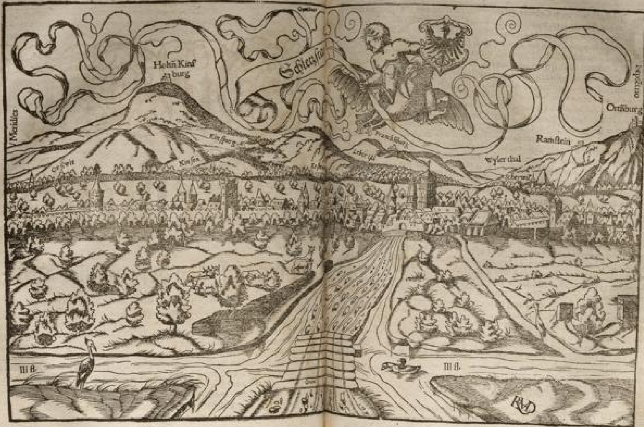
65 4 Schlesstace

Schlesstace erwan ein Dorff des Heyligen Römischen Reichs aber iczund ein hertliche Statt.