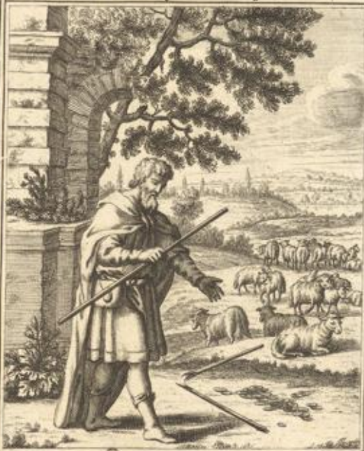
ZACH. XI. Visio de triginta argenteis.

Zach. XI. 30. et seq. Der Prophet weisaget vom inn tergang des Tempels u. von 30 Silberling.