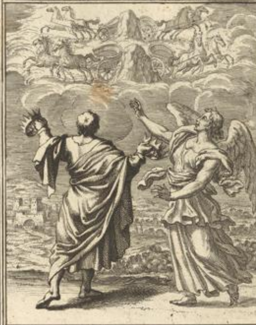
ZACH. VI. Visio quatuor quadrigarum.

Zach. VI. 1. Zacharias sieht ein Gesicht von Vier Wagen und Rossen zwischen zwey bergen.