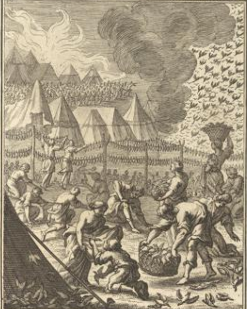
IV. Buch Mos. XI. 31. 32. Ein wind vo herze bringt machtel über das ganze lager der Kinder Israel, welche sie um das lager her aufhentele.