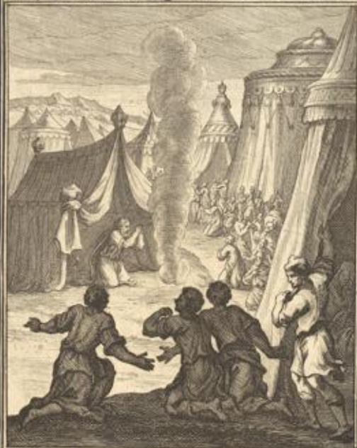
IV. Buch Mos. XI. 24. Der Herr redet mit Mose aus einer Wolcke und leget auf die siebenzig älteste den Geist desselbigen.