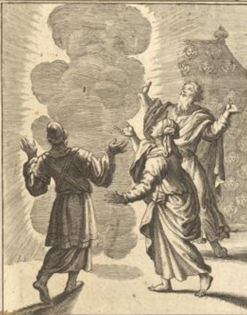
IV. Buch Mos. XII. 1. Das müren von Miriam und Aaron wieder Mose straffete der Herr, da Er in einer Wolcken sich hernider kam.