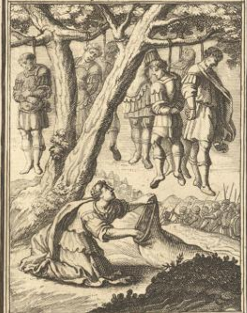
II. SAM. XXI. Septem filij Saul suspenduntur

II. Buch Sam. XXI. 9. 10. Der König David gab die sieben Söhne Sauls in die Hände der Gibeoniter die hien- gen ste auf, auf dem Berge für dem Herrn