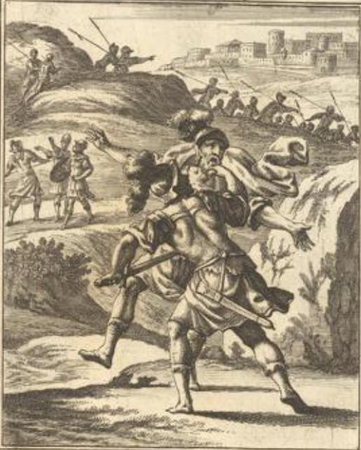
II. SAM. XX. Amasan interlicet Joab.

II. Sam. XX. 10. Joab fasset Amasa bey dem Durt, daß er ihn fasset, und stach ihm mit seinem Schwert in den Mantel.