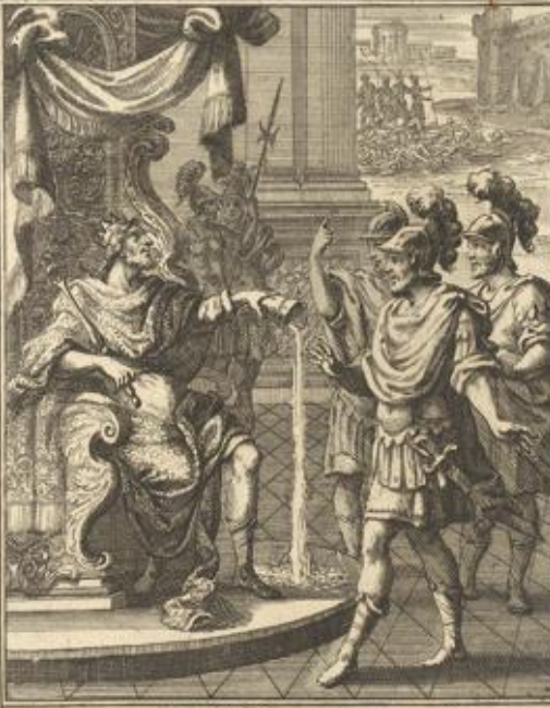
II. SAM. XXIII. David libavit aquam Domino.

II. Buch Sam. XXIII. 16. 17. David wolte das Wasser, darinn die drey Heldenthu gegangen sind nicht trincken, sondern goss es dem Herrn.