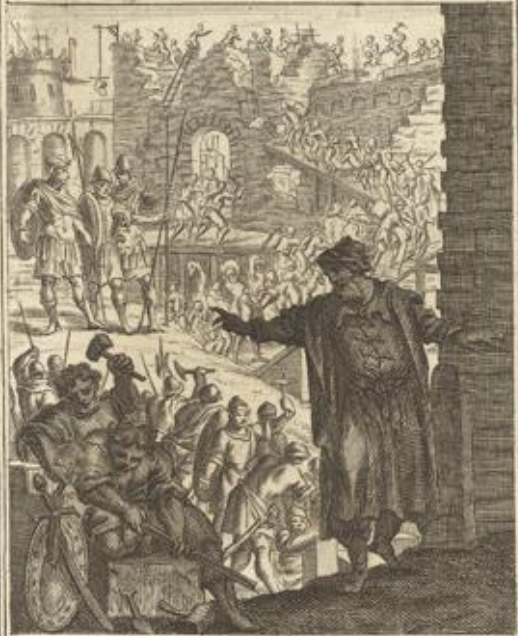
NEH IV Armati adificant Israélita.

Nehem. IV. 17. 18. Die Jiden baueten die Mäuren und mit einer Hand thaten sie die Arbeit und mit der andern hielten sie die Waffen.