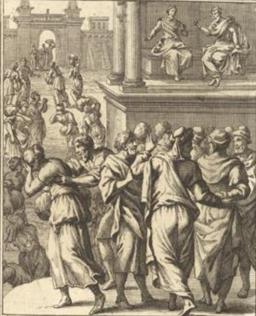
ESRAE X Populo de viris Iuda uxores alienigenas a se abijcit.

Esrae X. 17. Esra der Priester versamlet die Männer Juda und beredet sich mit ihnen dasi sie die fremde Weiber von sich scheiden.