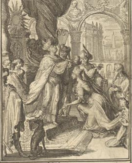
ESTH II Esther plus quod oes mulieres ab Assuero adamatae

Esther II. 17. Der König Ahasuerus gewar Esther sich über alle Weiber.