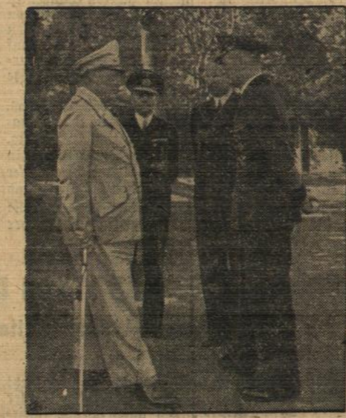
1. Marschall Göring und Großadmiral Donitz bei einer Besprechung im Führerhauptquartier.

Ähnlich wie am Kuban-Brückenkopf entwickelten sich die Kämpfe im südlichen und mittleren Abschnitt der Ostfront. Zwischen Asowischen Meer und Dnjepr-Anie wiesen unsere Truppen örtliche Angriffe des Feindes ab. Auch östlich Saporoschje sowie zwischen Poltawa, das den Sowjets als Trümmerfeld überlassen wurde, und dem Choro-Luh griffen die Bolschewisten mehrfach in Regimenterstärke an. Sie wurden aber