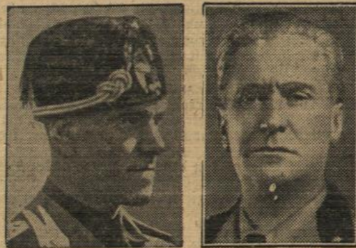
Rechts: Marschall Graziani, der neue italienische Verteidigungsminister. Links: Der Generalsekretär der faschistischen Militärgeneralleutnant Ricci.

Im Hinblick auf die bevorstehende Einberufung der konstituierenden Versammlung, die die Staatsform des neuen faschistisch-republikanischen Staates beschließen wird, hat der Duce, Regierungschef und