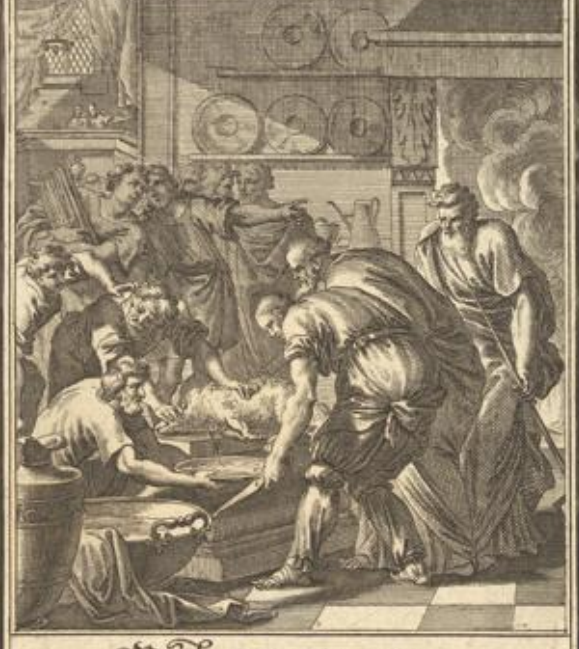
Matth. XXVI. 19. Jesus beide Junges Petrus und Johannes thun al- termassen wie ihnen ihr Herr und Meister befohlen hatte und bereiten zu Jerusalem das Ofter lam.