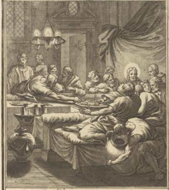
Matth. XXVI. 23. 26. Jesus entdecket seinen Verräther über Tisch da Er zugleich mit ihm in die Schüssel tauchet und ihm gleich darauff den Zissen überreichet