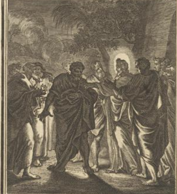
Matth. XXVI. 31. 34. Jesus verkündiget seinen Jüngern ihr baldfol- gendes Argernis, dem Verneinen seinen Apostel Pe- tro aber seine dreifache Verläugnung