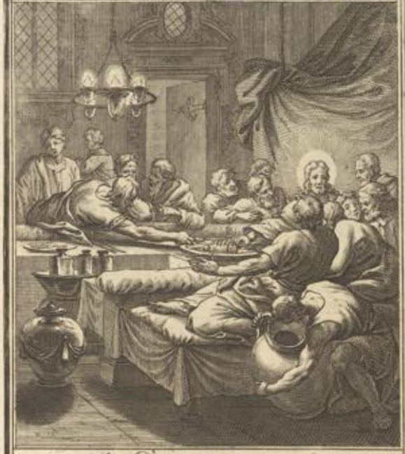
Matth. XXVI. 23. 26. Jesus entdecket seinen Verräther über Tisch da Er zugleich mit ihm in die Schüssel tauchet und ihm gleich darauff den Bissen überreichet