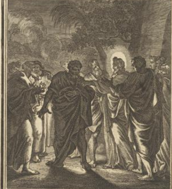
Matth. XXVI. 31. 34. Jesus verkündiget seinen Jüngern ihr baldfol- gendes Argerniß, dem Verneinen seinen Apostel Pe- tro aber seine dreifache Verläugnung