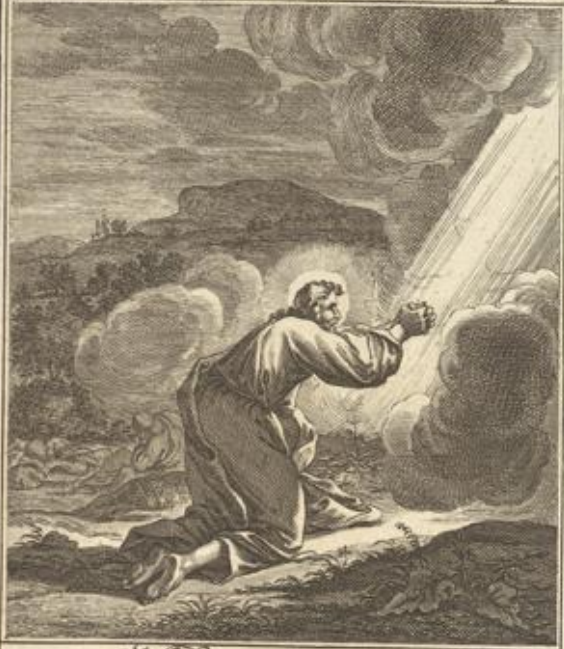
Matth. XXVI. 44. Jesus lässt seine Jünger im Garten am Ölberg schlaffen, gehet wiederum hin, betet zu dem dritten mal, und redet eben dieselben Wörth.