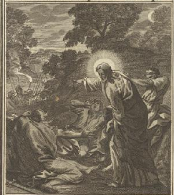
Matth. XXVI. 45. Jesus spricht zu dem dritten mal zu seinen Jüngern: Ach wolt ihr nicht schlaffen und ruhen? steht auf und lasset uns gehen. Siehe, er ist da, der mich verräth.