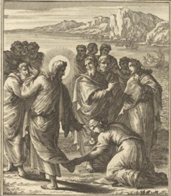
MARC . V . Mulier à profluvio sanguinis sanatur.

Marc. V. 33, 34 Ein Weib rühret von hinten zu das Kleid Jesu an. und er sah sich umb nach der die das gethan hatte.