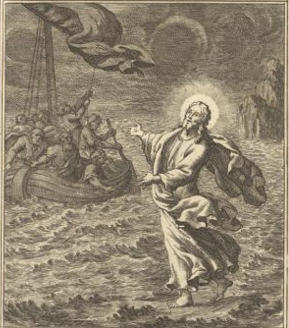
MARCI . VI . Iesus ambulat supra mare.

Marc. VI. 50. Jesús wandelte auf dem Meer. und seine Jünger im Schiff die Noth liden im rü- dern. sahen ihu. und erschrocken.