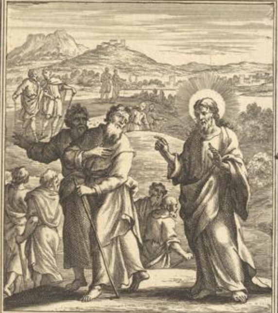
MARC . VI . Vocavit Iesus duos .et coepit eos mittere binos.

Marc. VI. 7 Jesús berieff zú sich die Zwölffe. und hieß an und sandte sie zu zweyen und zweyen. und gab ih- nen Macht über die unsaubern Geister.