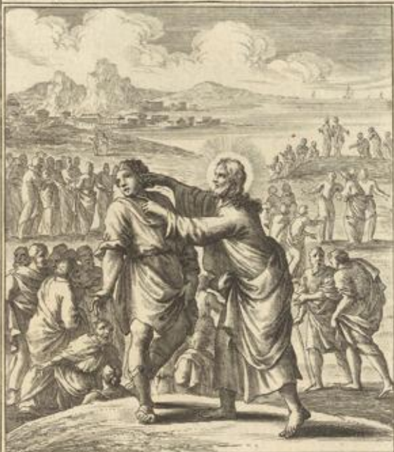
MARC. VII. Surdus mutus sanatur.

Marc. VII. 33. Jesus nam den Tauben der stimm war von dem Bolet besonders. End sprach zu ihm: Ephata, das ist, thue dich auf.