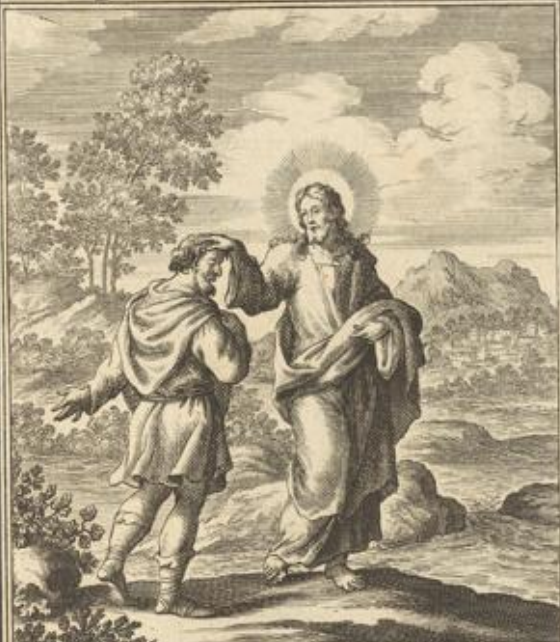
MARC. VIII. Iesit impositis manibus, coeco visu restituit.

Marc. VIII. 23. Jesus fuhret den Blinden hinaus fur den Be- cken, leget seine Hand auf ihn und bringet ihn wider zur recht, das er alles scharff sehen konnt.