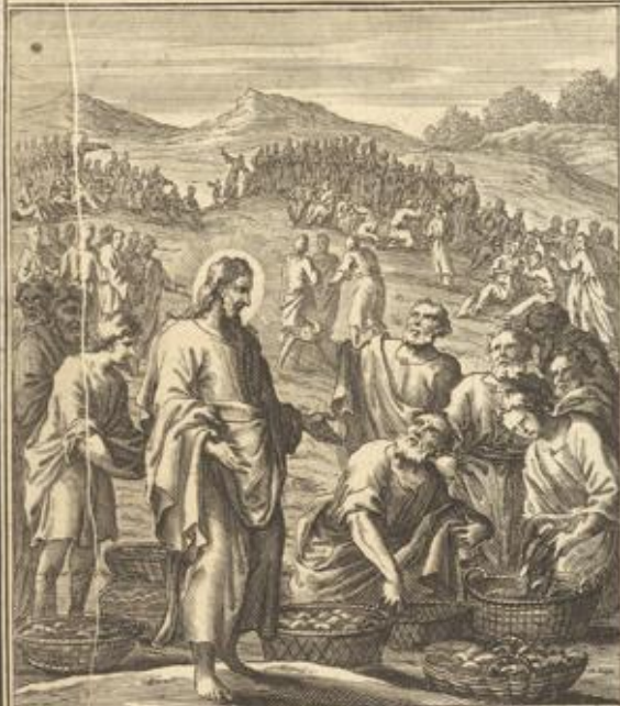
MARC. VIII. Iesus turbam satiat.

Marc. VIII. 9. Jesus speiset vier tausend Mann. Sie es- sen und wurden satt, und huben die ubri- gen Brocken auf sieben Korbe.