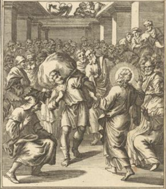
LUC. V. Paralyticus, verbo Christi, tollit lectum.

Luc. V. 25. Jesus sprach zu dem Nichtbrüchigen: Ich sage dir, stehe auf und hebe dein Bettlein auf, und gehe heim, und alsbald stund er auf.