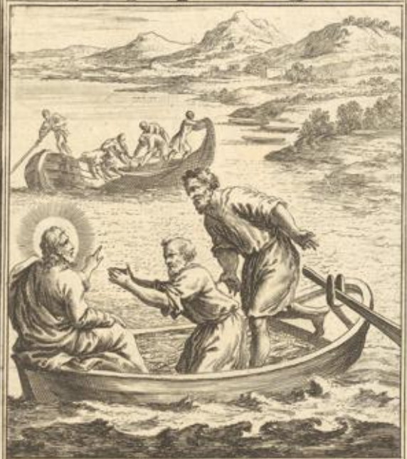
LUC. V. Petrus præ stupore procidit ad genua Iesu.

Luc. V. 8. Da Simon Petrus den reichen Fischzug sahe, fiel er Jesu zu den Knien und sprach: Herr, gehe von mir hinaus, ich bin ein sündiger Mensch.