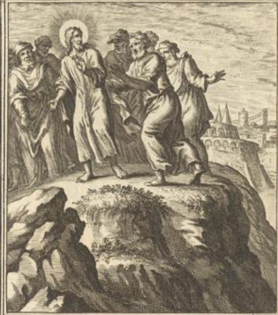
LUC. IV. Iesus ibat per mediū illorū qui volebant precipitare eū.

Luc. IV. 30. Alle die in den Schulen waren voll Hohn, führet er Jesus auf einen Hügel des Bergs, daß sie ihn hin abstürzen seten, aber er gieng mitten durch sie hinweg.