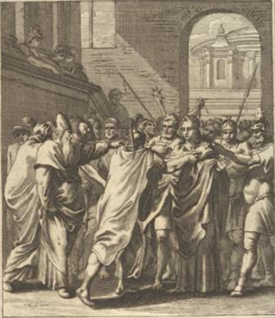
Apost. Gesch. IV. 5. Die Priester und Sadducäer vermah- ren den Aposteln im Tempel zu predigen.