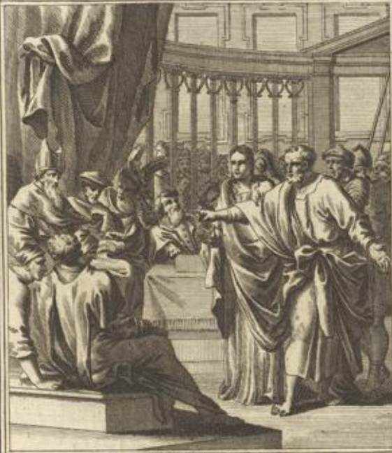
Apost. Gesch. IV. 8. Petrus und Johannes verantworten sich für den Obersten des Judentums über ihre Lehre.