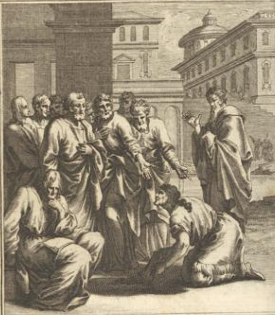
Apost. Gesch. IV. 36. 37. Barnabas legt das Geld von seinem verkauften Acker zu den Apostel Füße.