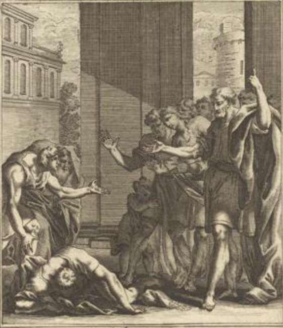
Apost. Gesch. V. 5. Ananias stirbt zu Straffe seiner Lüge, gen des jähren Todes vor den Augen der Apostel.