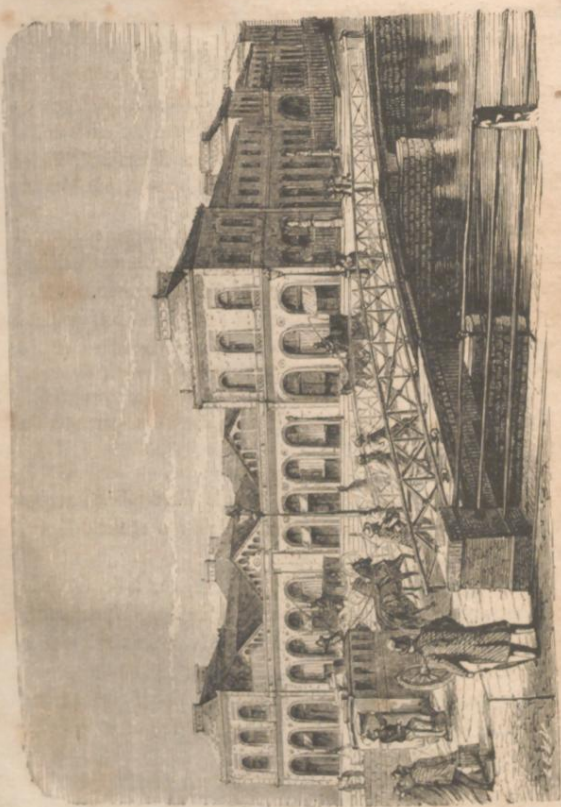
VUE GÉNÉRALE DE LA GARE DE PARIS (A. STEAS-LOUISE.)