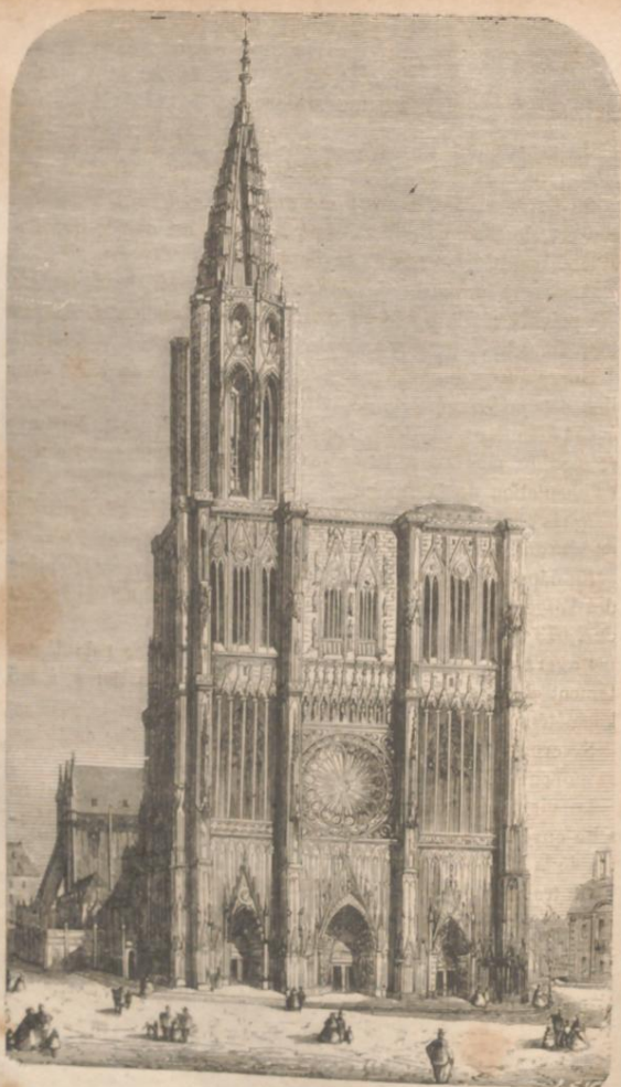
LA CATHÉDRALE DE STRASBOURG.