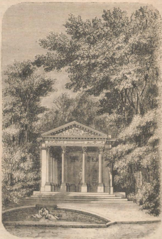
LE TEMPLE DE MINERVE DANS LES JARDINS DE SCHWETZINGEN.