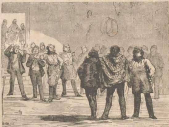
DUEL D'ÉTUDIANTS A HEILDEBERG.

demandé à une vieille fée qui ne comprend pas un mot de français, vous pourrez parcourir toute la maison.